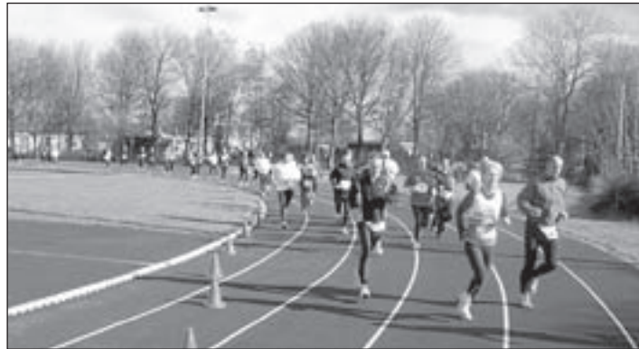
Op zaterdagmorgen hardlopen op de atletiekbaan.

Naast de Challenge houdt The Beach 27 december ook een open dag. Iedereen kan actief meedoen met verschillende activiteiten op en rondom het zand van The Beach. Zo verzorgd BeachTeamAalsmeer clinics beachvolleybal voor jong en oud, kan er deelgenomen worden aan Zumba en Salsa workshops en kan men zich uitleven bij de clinic Kick 'n Punch. Verder houden de in The Beach gevestigde bedrijven BeachNails en fitnesscenter Pro-Wave een open dag en zijn er diverse kraampjes en stands aanwezig. Van Kouwen staat met de nieuwe Opel Astra in het zand en er is een loterij met mooie prijzen die beschikbaar gesteld zijn door veel bedrijven uit de regio! Een deel van de opbrengst gaat naar Kika! Kortom volop gezelligheid en activiteit tijdens een heerlijk dagje strand midden in de winter. The Beach Open(dag) start om 12.00 uur en de entree is gratis! Voor meer info: www.beach.nl .