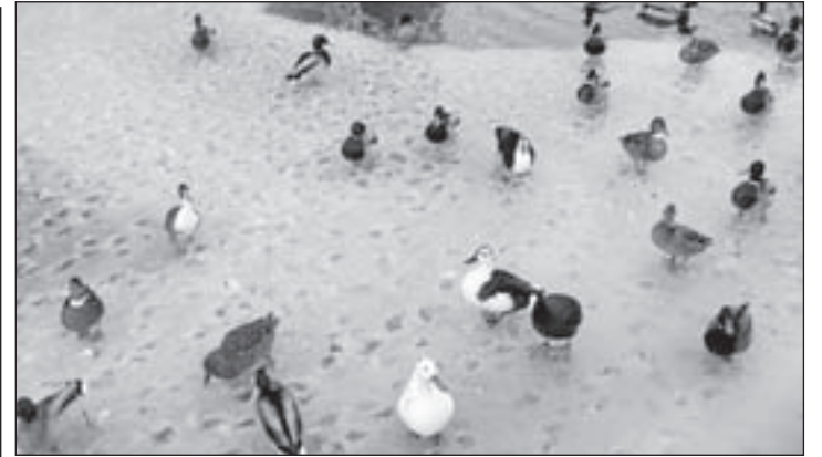
De eenden en meerkoetjes bij het gemeentehuis lusten graag een broodje. Bij het zien van mensen wordt gelijk aan eten gedacht. Massaal worden 'sprintjes' genomen om er vooral bij te zijn!