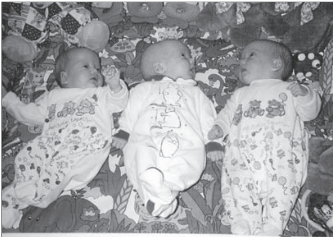
Net geboren.... 4 januari 1997, vijf weken te vroeg.

Er zijn nog enkele plaatsen vrij in deze groep. Voor opgave en informatie kan gebeld worden met Vita welzijn en advies: Parklaan 27, tel. 0297-344094.