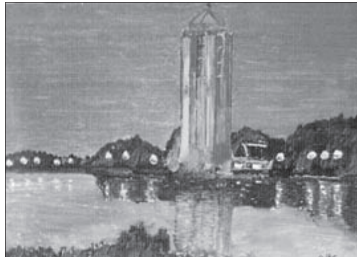
In Kaartenbak van KCA: