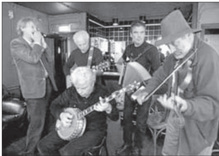
CCC Inc. komt weer naar De Oude Veiling.