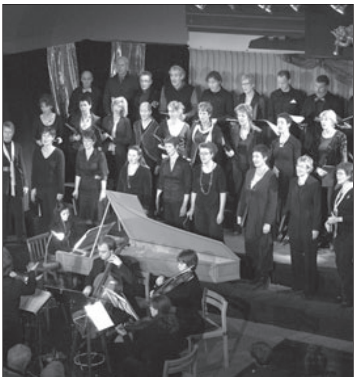
Een overtuigend en prachtig concert bracht het Bindingkoor jl. zondag.