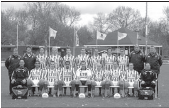
De mannen die het wekelijks voor Aalsmeer op de mat zetten en u graag verwelkomen op het mooie complex en in de gezellige kantine van VV Aalsmeer aan de Dreef.