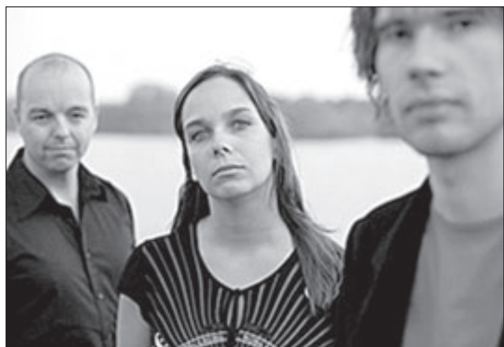
Indie-rocktrio Some Weird Sin.

* Kerstkien buurtver. Oostend in 't Middelpunt, Wilhelminastraat, 20u.