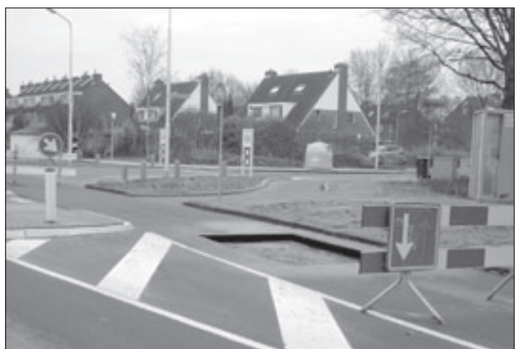
Kruising Mijnsherenweg/Curiestraat woensdagmiddag... een gapend gat waar eerst een hobbel zat.

en VVD voor waren zodat het voorstel met tien tegen negen stemmen werd aangenomen. Een aangekondigde motie van afkeuring over de handelwijze van de portefeuillehouder ingediend door AB, die aangaf dat de aankoop onnodige, ongewenste juridische en financiële risico's voor de gemeente Aalsmeer tot gevolg zou kunnen hebben, werd niet gesteund en niet in stemming gebracht en maakte derhalve geen onderdeel meer uit van de beraadslagingen.