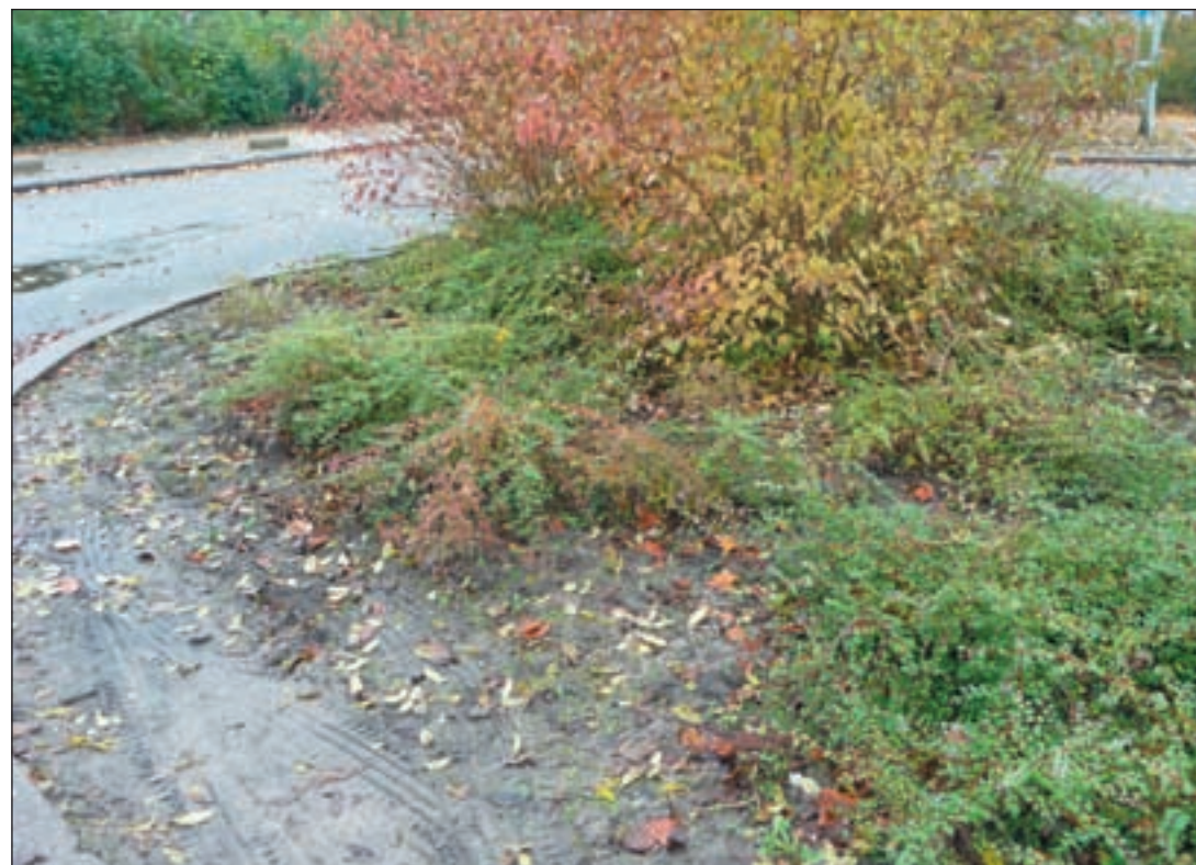
Kwaliteit en onderhoud van het openbaar groen moet beter en goedkoper, vindt de VVD.