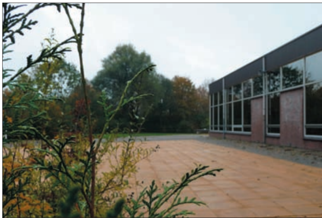
Het buitenzwembad sluiten, overgaan tot 1 bibliotheek? AB: Het is tijd voor echte veranderingen.

genwoordigd is op zittingen van de Raad van State, waarbij handhavingzaken van de gemeente Aalsmeer aan de orde zijn. "Het maakt een bijzondere slechte indruk wanneer de gemeente daar niet vertegenwoordigd is." De VVD, die in haar inleiding schrijft dat het huidige college niet de voorkeur geniet van deze partij, haalt ook uit naar de bestuurders wat betreft de kwaliteit en onderhoud van de openbare ruimte in Aalsmeer. "Deze laat te wensen over, dit ondanks hogere kosten in vergelijking met andere gemeenten." En: "Als enige partij wilde de VVD geen huisvesting van (tijdelijke) buitenlandse werknemers in de woonwijken. Deze woonwijken zijn er niet op ingericht en het heeft op meerdere plaatsen een negatieve invloed op het woongenot. De VVD schrijft een voorstander te zijn van grootschalige woonvoorzieningen voor arbeidsmigranten buiten de woonwijken, zoals voorzien wordt in Greenpark Aalsmeer."