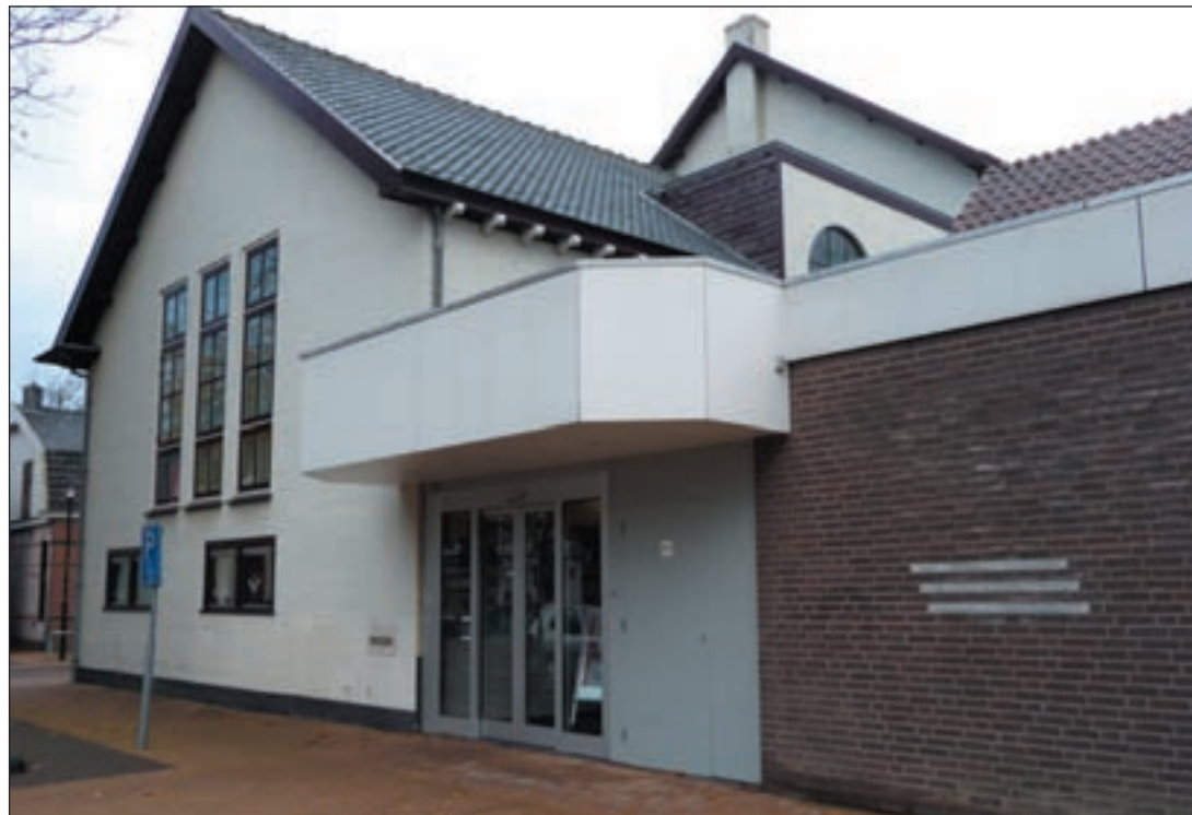
Sluiting van twee bibliotheken en 1 hoofdvesting houden? PACT is er nog niet uit.

(deels) gaan bijhouden. "Dit is een echte kerntaak van de gemeente. Iets anders is het om via de wijken specifieke acties, zoals zwerfvuil opruimen, te organiseren." Wat bezuinigingen betreft denkt PACT centjes te verdienen door de openbare verlichting op sommige tijden een (flink) tandje minder te zetten. "Ook goed voor het milieu." In de ogen van PACT moeten wijkraden veel meer betrokken worden bij (gebieds)ontwikkelingen, omdat zij nu eenmaal de kennis in hebben over het functioneren en de samenstelling van een wijk. Verder vindt PACT dat de beraads- en raadsvergaderingen nog veel te veel naar binnen is gericht. "Het echte contact met de burger komt onvoldoende uit de verf." Tot slot schrijft de fractie niet weg te zullen lopen voor het financiële programma. "Wij willen mede de verantwoordelijkheid dragen voor -soms ingrijpende- keuzen."