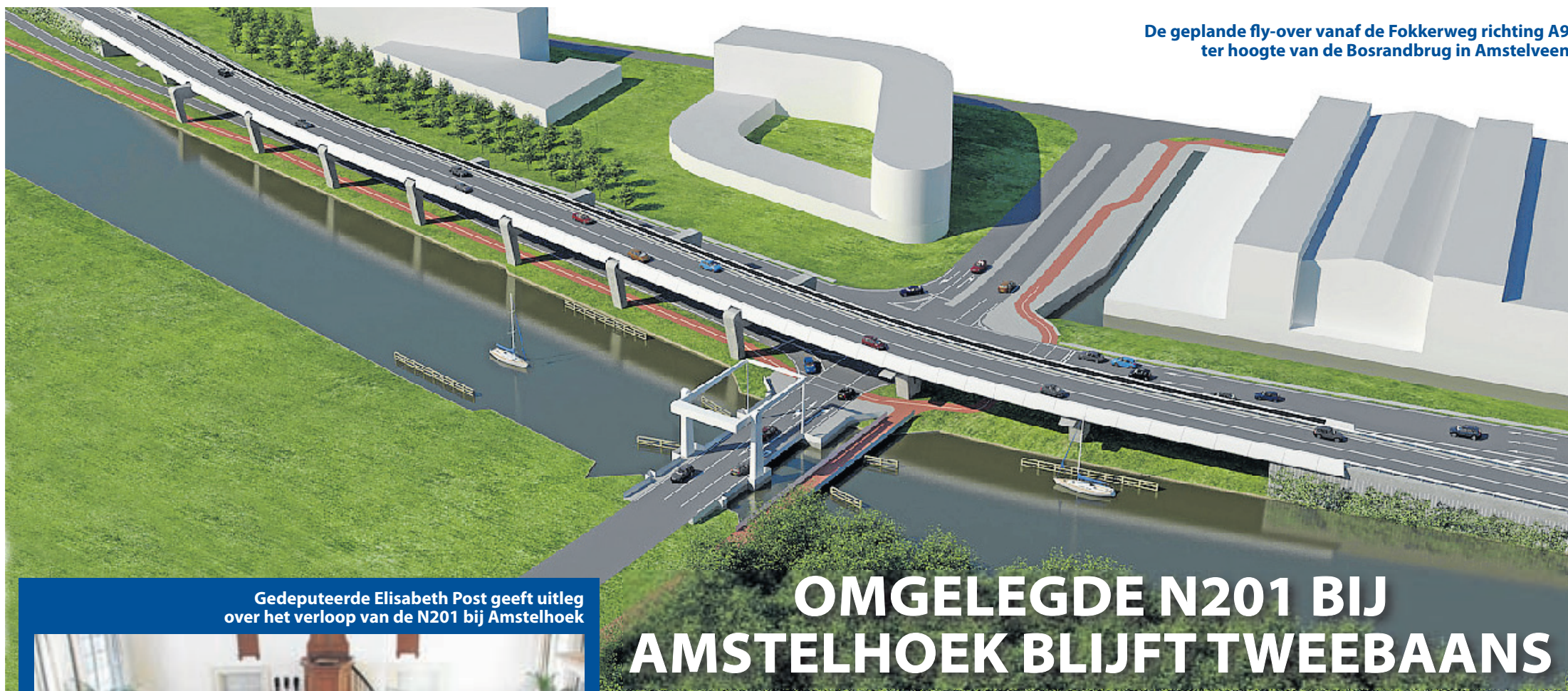
De geplande fly-over vanaf de Fokkerweg richting A9 ter hoogte van de Bosrandbrug in Amstelveen