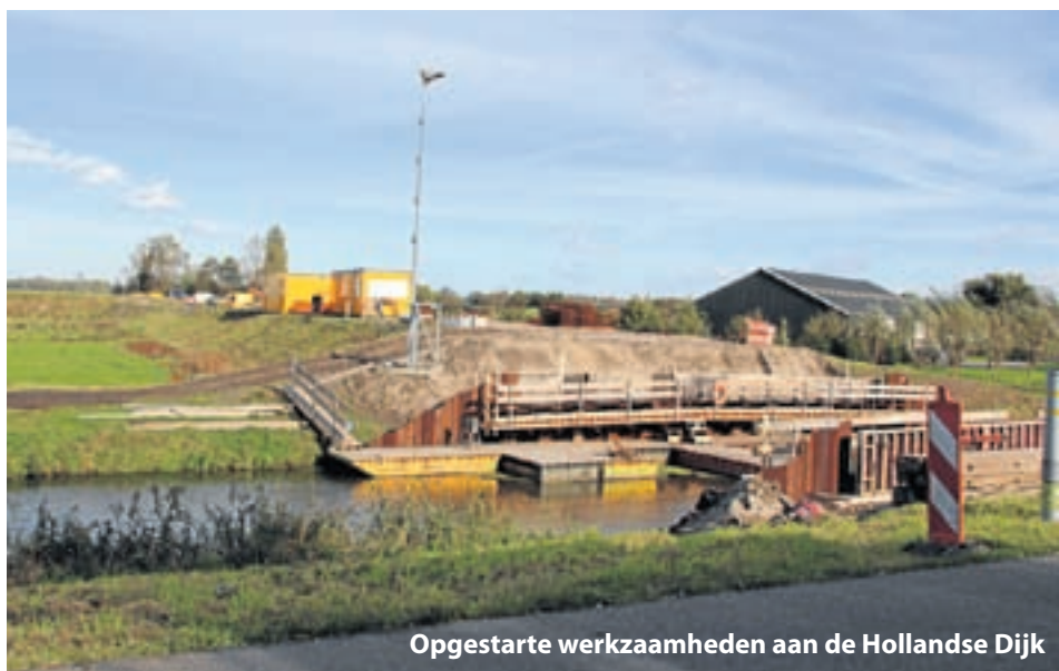
Opgestarte werkzaamheden aan de Hollandse Dijk

De hele weg kunnen we naar verwachting eind 2012 opleveren en toegankelijk maken voor het verkeer. In ieder geval moeten de werkzaamheden voor het laatste stuk N201 – dus ook op het grondgebied van De Ronde Venen – eind 2011 zijn afgerond. Hoewel de Waterwolfunnel