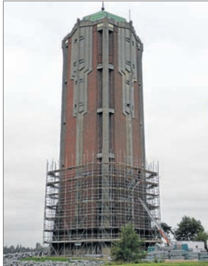
Het valt nu nog mee, maar de steigers zullen hoger en hoger worden geplaatst. Hoogtevrees moet je niet hebben!

Kudelstaart - De brandweer werd zaterdagmiddag 9 oktober rond 14.00 uur gealarmeerd voor een woningbrand aan de Joke Smitstraat in Kudelstaart. Het bleek te gaan om een 'middelbrand' met behoorlijke rookontwikkeling. De brand in de benedenwoning woedde kort maar hevig. Gelukkig kon de bewoner zich op tijd in veiligheid brengen en zijn huisdieren mee naar buiten nemen. Hoe de brand is ontstaan, is onbekend.