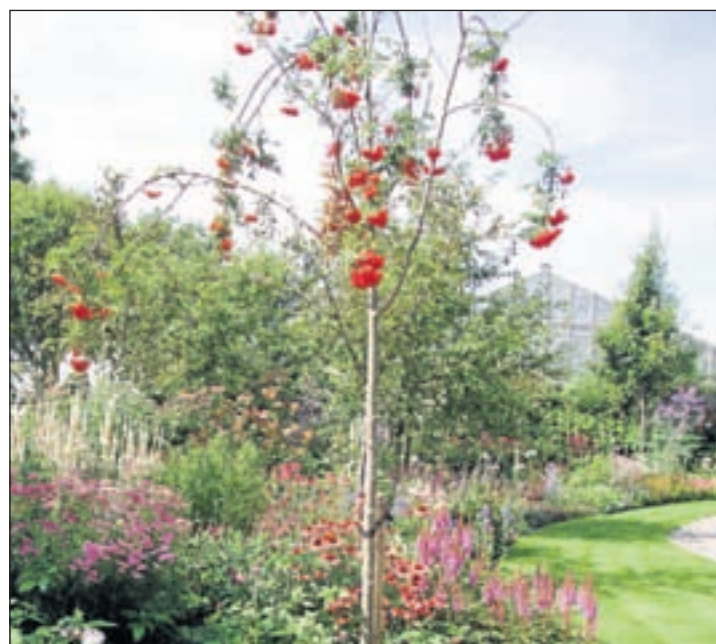
Eerste prijs voor Ton Boerlage, Aalsmeerderweg 164.

Als de Dorpsstraat dan vernieuwd en weer open is voor verkeer, staat de reconstructie van de Van Cleeffkade, vanaf de N201 tot de Kerkwetering, op het programma. De weg wordt deels ingericht als vijftig kilometer weg en vanaf de bebouwing gaat een 30 km zone gecreëerd worden. De reconstructie staat in de planning van eind april tot de bouwvakantie. Tijdens alle werkzaamheden zullen de omleidingen met borden aangegeven worden.