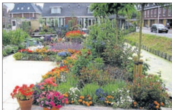
Als tweede is geëindigd de tuin van de heer Donicie aan het Pijkruidhof 3 te Kudelstaart.

Het Oosten aan de Aalsmeerderweg. De tweede prijs, ook een aantrekkelijke 100 euro (waardebon) gaat naar de heer Piet Donicie, wonend aan het Pijkruidhof 3 in Kudelstaart. Deze tuin in de jonge Rietlandwijk viel op door enorm veel kleur. Tot slot de derde prijs, een leuk bedrag van 50 euro (waardebon), en die is voor mevrouw Leny van Alphen-Bol uit Kudelstaart. Haar 'ark'tuin' aan de Herenweg 34 is bijzonder samengesteld door groene planten gecombineerd met paarse bloeiers. Alle waardebonnen zijn beschikbaar gesteld door tuincentrum Het Oosten uit Aalsmeer. De winnaars dienen zelf contact op te nemen met Het Oosten: 0297 324026.