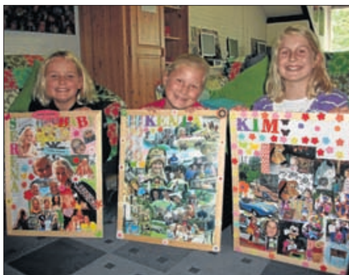
Wekelijks worden in de Binding Oost aan de Machineweg allerlei activiteiten georganiseerd voor de jeugd. Er wordt geknutseld, film gekeken en gezellig gerelaxed tijdens inloopmiddagen en -avonden. Ook jij bent welkom. Kijk voor het programma op www.debinding.nl .