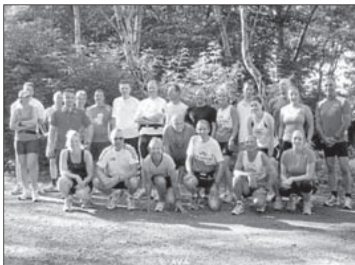
Onderschrift bij de foto: AVA Dam tot Dam trainingsgroep in Amsterdamse Bos.