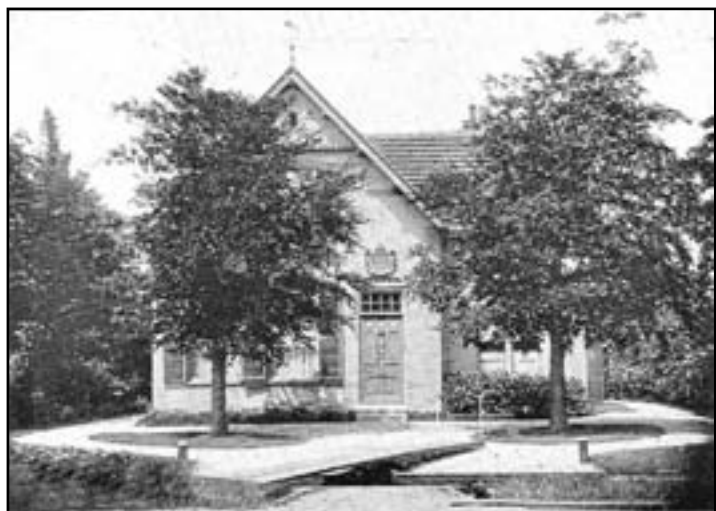
Het huis annex kantoor van Terra Nova in 1905.