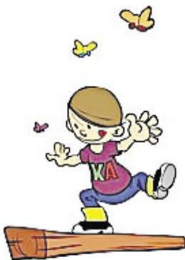
Beter in balans

Voor kinderen en jongeren van 4 t/m 18 jaar.