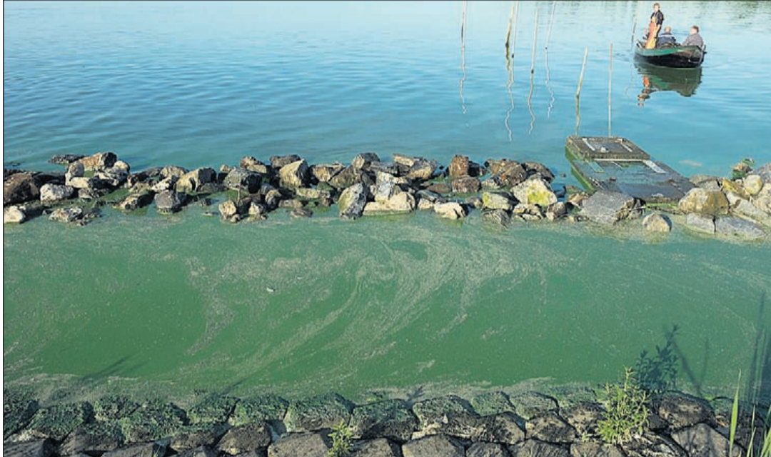
Miljarden muggenlarven in het water achter de steentort langs de Stommeerweg. De muggenlarven liggen in een soep van blauwalg.