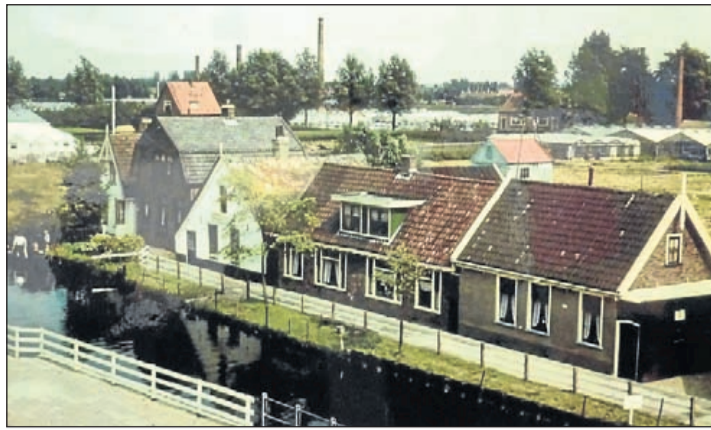
Het Molenpad dat rond 1960 plaats moest maken voor het gemeentehuis.

Aalsmeer - Op zaterdag 10 augustus om half zes in de ochtend zijn politie, brandweer en leden van de AED uitgerukt na een alarmering over hartklachten bij een 74 jarige bewoner van de A.H. Blaauwstraat. De inwoner is met spoed vervoerd naar het AMC.