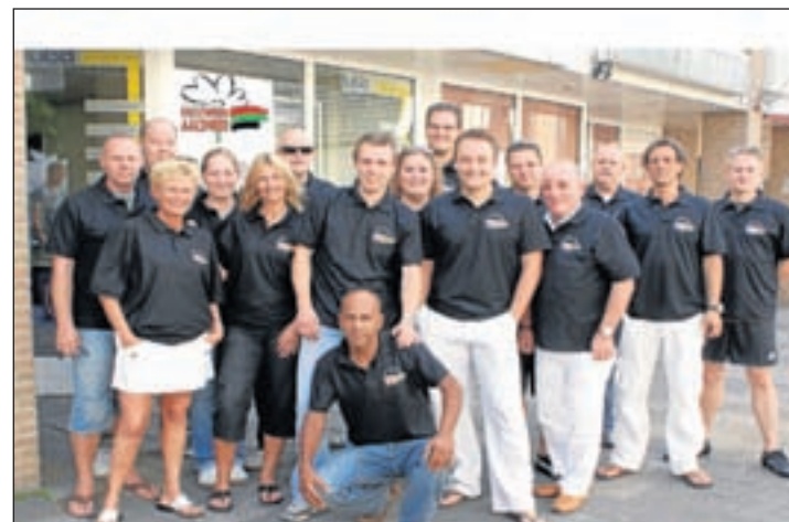
De medewerkers van de Aalsmeerse feestweek.

* Kinderworkshop Aalsmeers Schilders Genootschap (ASG) in Oude Raadhuis, Dorpsstraat. Iedere zaterdag, t/m 28 augustus, 14-17u.