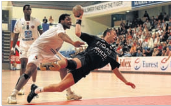
Twee jaar geleden speelde FIQAS Aalsmeer ook tegen een Franse ploeg: Paris Handball