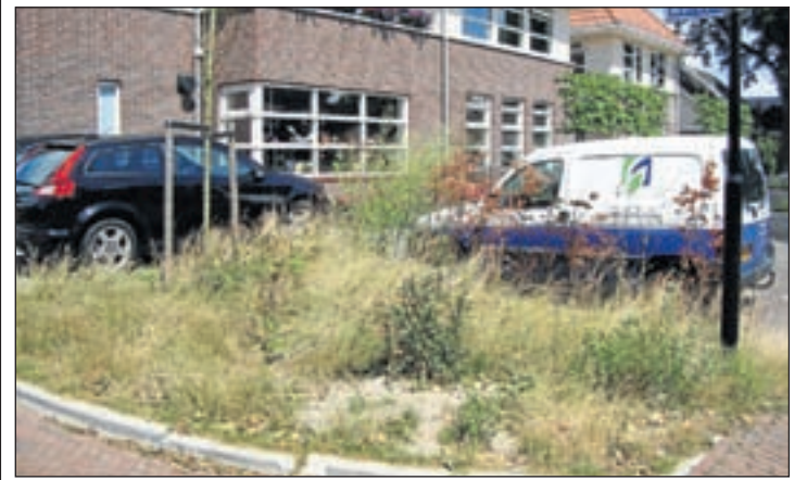
Onkruid tiert weilig in De Werven.

Als het goed is, is deze week een aanvang gemaakt met onderhoudswerk aan de Legmeerdijk tussen de Marshallsingel en de kruising Bosrandweg/Beneluxbaan (Legmeerdijk Noord). Deze werkzaamheden vinden gewoon plaats 'in' het verkeer, dus de weg hoeft niet te worden afgesloten. Meer info over het project: www.n201.info