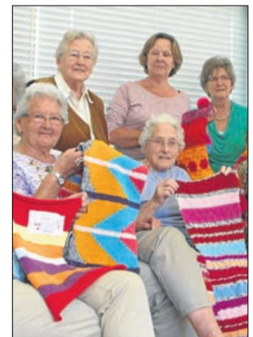
De maandagmiddag breigroep van het Rode kruis adopteerde de dode kersenboom.

en urban interventions besproken. De stand van zaken wordt bekeken en er wordt afgesproken wie komt meehelpen om de bomen in te pakken voor de Kunstroute in het derde weekend van september. Ook wordt er door de Kunstploeg nog overlegd met het jongerenwerk van De Binding om ook jongeren een plek te geven in het project. De meest fantastische breisels zijn er inmiddels al gemaakt en met alle deelnemers is afgesproken dat het zo wordt georganiseerd dat ieder zijn, maar vooral haar, bijdragen kan zien dat weekend. De Kunstploeg is druk bezig om vervoer voor dat weekend te regelen. Als 95-jarige spring je nu eenmaal niet zo maar meer op de fiets als je het resultaat van je werk als breikunstenaar wilt zien. Het project vindt plaats onder de vlag van stichting De Kunstploeg. Voor meer