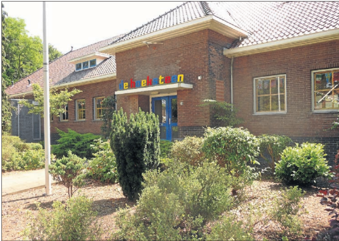
De basisscholen De Hoeksteen en De Wegwijzer, nu nog resp. in de Ophelialaan en de Roerdomplaan.

zaamheidsgebied van elkaar kunnen leren. En het zou natuurlijk geweldig zijn als Aalsmeer de eerste gemeente wordt die in deze regio een duurzaam en energieneutraal kindcentrum bouwt." Inmiddels hebben medezeggenschapsraden van De Hoeksteen en De Wegwijzer ingestemd met de fusie. De planning is op dit moment dat de nieuwe school in 2016 geopend kan worden op het voormalige terrein van Voetbalvereniging Aalsmeer aan de Dreef in de Hornmeer. Het project Metropolitan Green School wordt in samenwerking met het ministerie van EZ (Piano) en de gemeenten Amsterdam en Aalsmeer uitgevoerd.