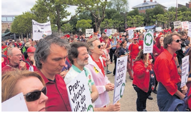
Een groepje inwoners was afgelopen zaterdag aanwezig op het Museumplein voor de protestactie tegen de uitbreiding van het aantal vluchten op Schiphol. 'Pretvlucht uit de lucht' was op de borden te lezen.