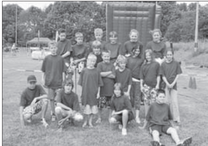
De 3 jeugdteams van IJclub De Blauwe Beugel.