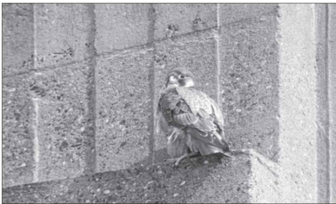
De Slechtvalk-man nadat hij zaterdagochtend de kast aan zijn vrouw heeft overgedragen. Inmiddels laat het vrouwtje het mannetje niet meer toe bij de drie eieren en dit betekent, volgens kenners, dat deze heel spoedig zullen uitkomen en er dus jongen geboren worden.