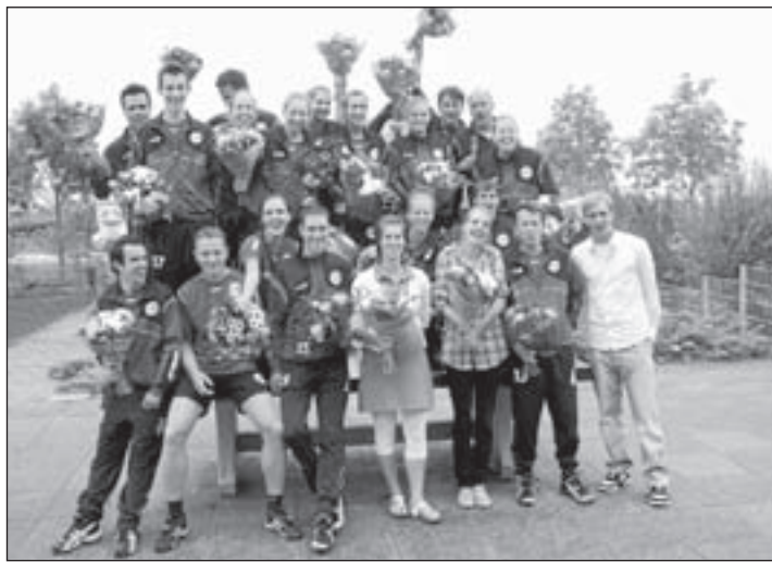
De selectie van VZOD promoveert door kampioenschap naar de derde klasse.