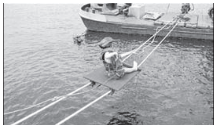
Deelnemer aan de eerste 'Peur um erin' vorig jaar.

Zondag 6 juni is de Loswal de locatie van verschillende evenementen. Om 14.00 uur wordt het startschot gegeven voor 'Peur um erin'. Vorig jaar verscheen dit spektakel-evenement voor het eerst ten tonele, en de Kudelstaartse versie van Ter land, ter zee en in de lucht bleek een groot succes. Degenen die dit jaar willen proberen om zo snel mogelijk van het ene ponton naar het andere te 'racen' worden om 13.30 uur verwacht op de Loswal. Van tevoren inschrijven hoeft niet en ook een eigen voertuig maken is niet nodig. Van tevoren trainen is wel aan te raden want de snelste deelnemer wint liefst 75 euro! Een ander spektakel deze dag is de ringsteekwedstrijd. Verder zullen tractors van vroeger acte de présente geven en hun beste bandje voor zetten. Bezoekers van alle evenementen wordt gevraagd zo veel mogelijk met de fiets te komen. Kijk voor meer informatie op www.pretpeurders.nl