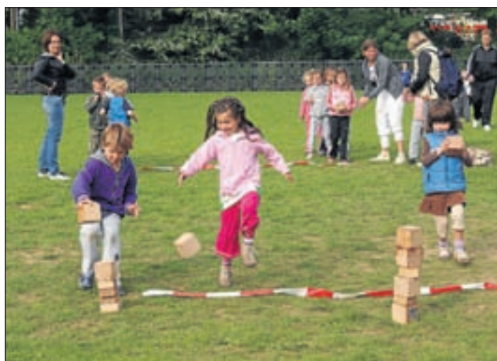
De onderbouw Jozefschool met het blokken bouwen.

Ami gaan om 20.30 open en sluiten pas weer om 00.00 uur. Kaarten kosten 6 euro per stuk en zijn alleen verkrijgbaar aan de deur. Het bedrag is inclusief een drankje. Binding Oost aan de Machineweg 12 staat in juni in het teken van het WK voetbal, maar ook andere sporten! Kom gezellig slagballen of handballen in juni. En als je zin hebt om een oranje armbandje te komen maken, ben je dinsdag 8 juni welkom. Voor niks mag je meedoen. Kom je uit school langs? Er staat wat lekkers te eten en drinken voor je klaar! En op de BindingZolder aan de Haya van Somerenstraat 35c kan woensdag 9 juni een shirt helemaal naar eigen smaak versierd worden. De middag is van 14.00 tot 16.00 uur en is bedoeld voor tieners in de leeftijd van 10 tot en met 15 jaar. De kosten zijn 5 euro en opgeven kan bij inge@debinding.nl .