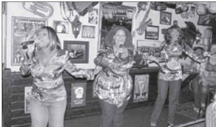
Super gezellig en goed was het optreden zondagmiddag 30 mei van de meidengroep Big Black & Beautiful in een bomvol danscafé de Praam.

zal donderdag 1 juli weer losbarsten en dan hebben De van Cleefftjikkies, De handtassen, Team Beetje Beerig, Flassig, The Blondies, Sjoels unlimited, De Suukels, Team glymerin, Sjoelbabes en Sjoel-la-li Sjoel-la-la weer de kans om de avondprijzen te winnen en zich te kwalificeren voor de finale op donderdag 23 december. Uiteraard is iedereen van harte welkom om de teams aan te komen