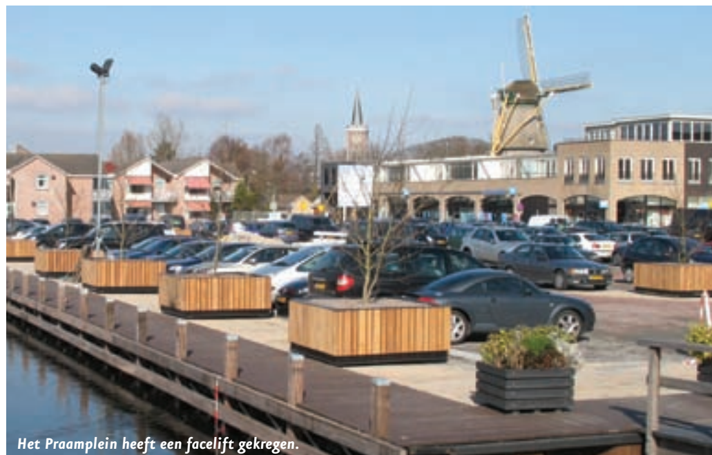
Het Praamplein heeft een facelift gekregen.

Het Centraal Bureau voor de Statistiek heeft het bevolkingscijfer in Aalsmeer per 1 januari 2010 vastgesteld op 29.187 inwoners, waarvan 14.480 mannen en 14.707 vrouwen.