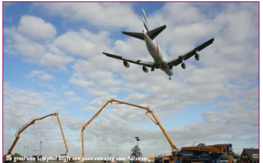
De groei van Schiphol blijft een punt van zorg voor Aalsmeer.