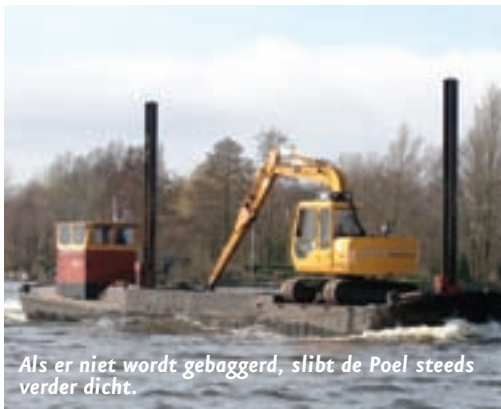
Als er niet wordt gebaggerd, slibt de Poel steeds verder dicht.