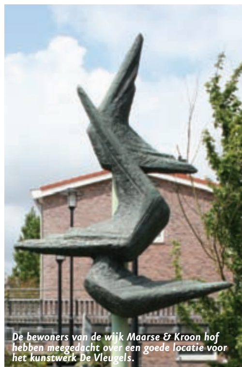
De bewoners van de wijk Maarse & Kroon hof hebben meegedacht over een goede locatie voor het kunstwerk De Vleugels.

De plaatsing van een kunstwerk dat op deze manier tot stand is gekomen is de fluisterbank aan het einde van de Zijdstraat. De bewoners zijn heel blij met de bank en dus zijn zij er ook zuinig op. Op deze manier krijgt het kunstwerk niet alleen een grote