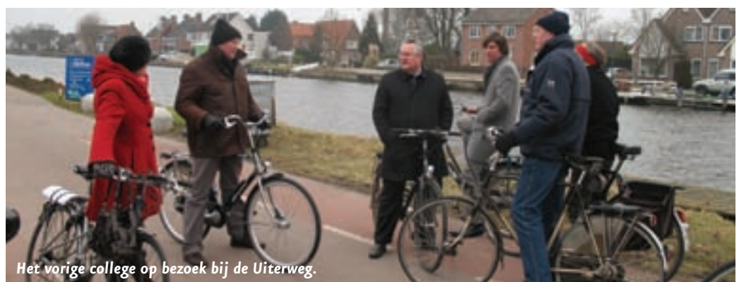
Het vorige college op bezoek bij de Uiterweg.