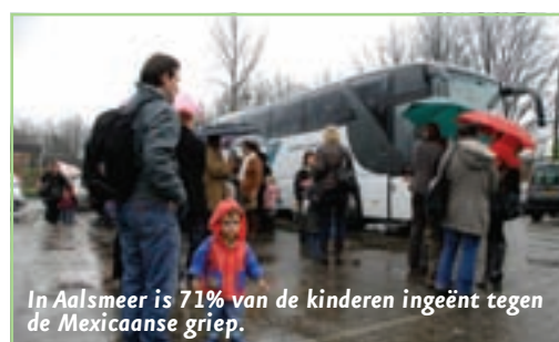
In Aalsmeer is 71% van de kinderen ingeënt tegen de Mexicaanse griep.