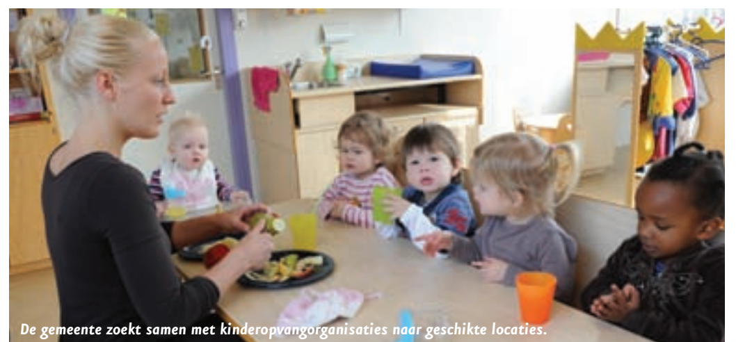
De gemeente zoekt samen met kinderopvangorganisaties naar geschikte locaties.