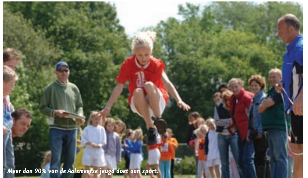
Meer dan 90% van de Aalsmeerse jeugd doet aan sport.