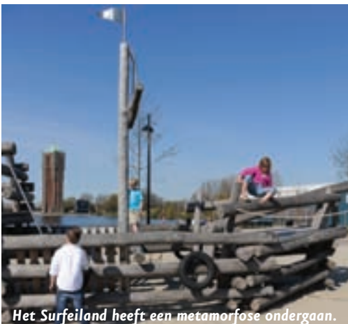
Het Surfeiland heeft een metamorfose ondergaan.