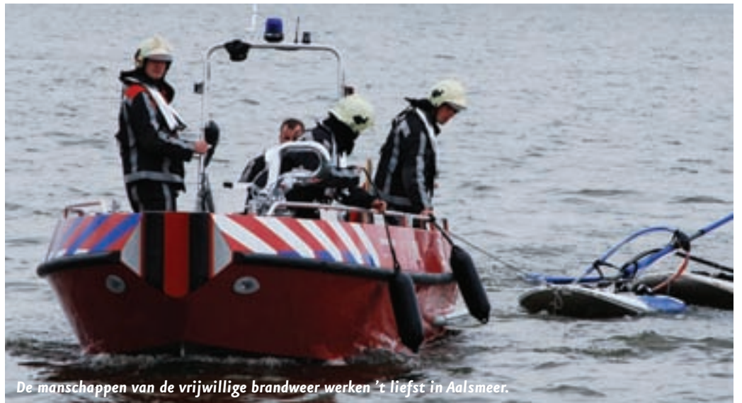
De manschappen van de vrijwillige brandweer werken 't liefst in Aalsmeer.

in de categorie crimineel vallen." Er zijn volgens Schouwstra drie manieren om dergelijke groepen aan te pakken: als groep, dus als collectief, individueel (zondag via de ouders) en een combinatie ervan. "Maar je kunt pas je aanpak bepalen als je weet in welke categorie ze vallen. Als bijkomend probleem heeft zich eind 2009 een derde groep gevormd die moeilijk met de Ferweda-methode valt te categoriseren. Het is namelijk een uitzonderlijk grote groep en wisselend van samenstelling, leeftijdsgemiddelde én hangplek. Deze groep valt daarmee compleet buiten de definitie van een 'reguliere' groep. Kortom, moeilijk grip op te krijgen, maar dat gaat ons ook bij deze groep zeker lukken."