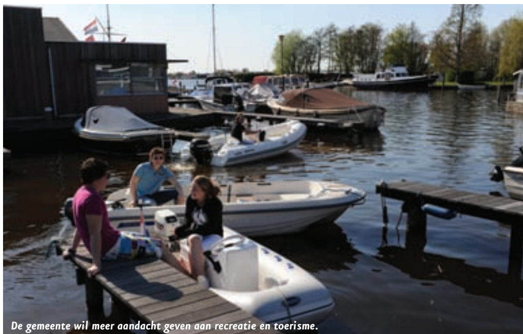
De gemeente wil meer aandacht geven aan recreatie en toerisme.