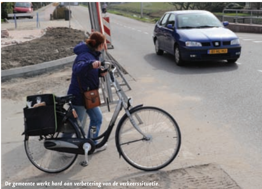
De gemeente werkt hard aan verbetering van de verkeerssituatie.