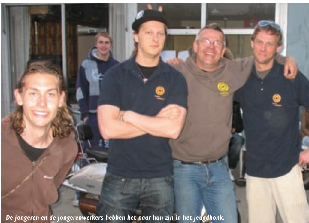
De jongeren en de jongerenwerkers hebben het naar hun zin in het jeugdhonk.

De gemeente is nu bezig met het verbeteren van de verkeersveiligheid rondom De Mikado. Overbeek: "Bij De Mikado zullen we tijdens de zomervakantie onder andere de draaihekken aanpassen, het fietspad verleggen en de trottoirs verbreden. De maatregelen die we treffen binnen dit zogenaamde Octopus-project hebben we in nauw overleg met ouders en scholen opgesteld. Dit project zullen we binnenkort ook bij De Rietpluim starten."