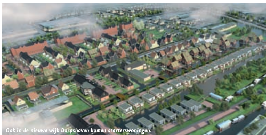
Ook in de nieuwe wijk Dorpshaven komen starterswoningen.

Al deze bouwprojecten blijven ook dit jaar zorgen voor overlast, zegt Ebels. "We proberen daarom al sinds de start van het project zo goed mogelijk met de bewoners te communiceren. We verspreiden elke drie maanden huis-aan-huis een nieuwsbrief met informatie over de werkzaamheden. En dat wordt gewaardeerd. We hebben tot nog toe heel weinig klachten gekregen." De vernieuwing van het Dorp is veel werk, zegt Ebels. "Maar het was dan ook broodnodig. Het Dorp was een tikje vergane glorie, maar het tij is inmiddels gekeerd. Volgend jaar heeft Aalsmeer een stijlvol centrum met een bijzonder en divers winkelbestand."