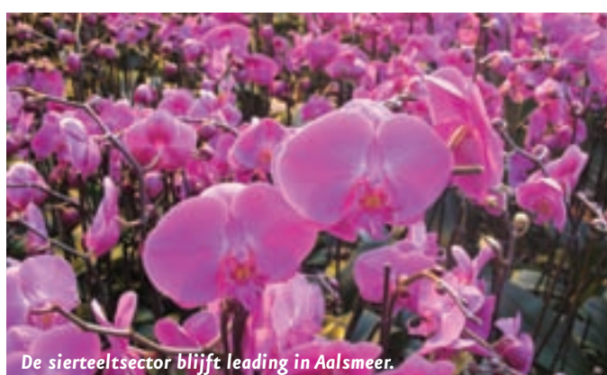
De sierteeltsector blijft leading in Aalsmeer.

sierteelt de grote aanjager van de economie, dus dat willen we blijven stimuleren. In Aalsmeer zijn we vorig jaar begonnen met de herstructurering van het bedrijventerrein in Hornmeer, dat echt verouderd is. Verder gaan we onderzoeken of we vervallen kassengebieden kunnen herinrichten tot moderne bedrijventerreinen." In het hart van Greenport Aalsmeer komt Bloomin'Holland dat het innovatieve en bruisende centrum zal worden met onder andere een kenniscentrum, hotel en beursgebouw.