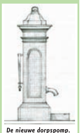
De nieuwe dorpspomp.

De gemeente heeft afgelopen jaar besloten het centrum van Aalsmeer te verfraaien met een natuurstenen dorpspomp, die geïnspireerd is op de oude dorpspomp die vroeger voor het oude Raadhuis in de Dorpsstraat stond. De bedoeling is meer sfeer te brengen in het Dorp en de geschiedenis van het oude centrum meer te laten leven. De pomp wordt gemetseld en vervolgens bekleed met grijs Belgisch hardsteen. De pomp zal op de hoek Zijdstraat / Dorpsstraat worden geplaatst, naast de bodewoning. De dorpspomp zal naar verwachting in de zomer van 2010 officieel worden onthuld.