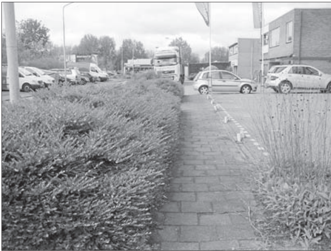
De voetpaden op de Turfstekerstraat en de Visserstraat functioneren niet of nauwelijks.

Klaas Groot, Schweitzerstraat 57, 1433 AH Kudelstaart.