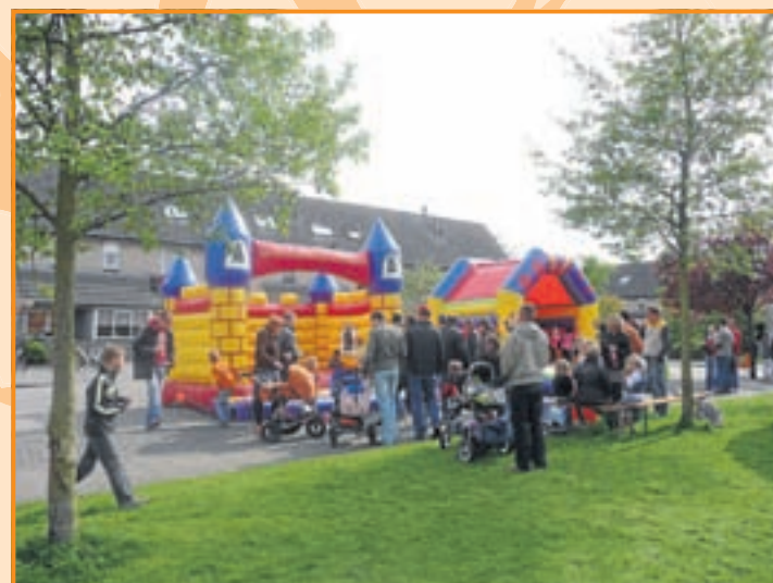
Luchtkussens in Nieuw Oosteinde in vele uitvoeringen, het leek wel een luchtkussenfestival, de kinderen beleefden er vele uitgelaten uurtjes op!