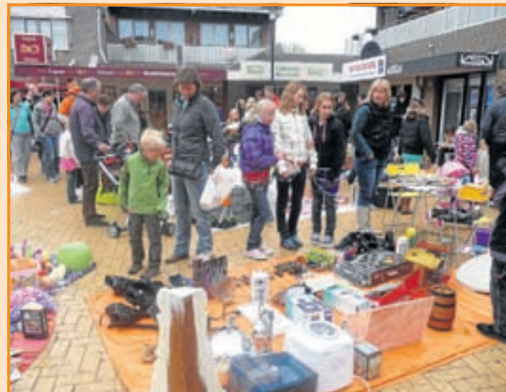
Niet achter het Dorpshuis ditmaal maar 'gewoon' weer gezellig in en rond het winkelcentrum werd de vrijmarkt Kudelstaart vrijdag gehouden. De plekjes onder de luifels van de winkels waren favoriet natuurlijk, daar was het tenminste droog!