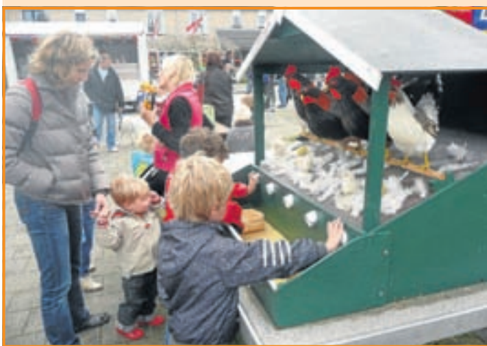
In Oost werd de jeugd dit jaar ook getraakteerd op veel vermaak met springkussens, een hindernisbaan en leuke spelletjes als de spiraal en eieren vangen. De ouderen konden een gokje wagen bij het rad van fortuin. Ook in Oost ging de Koninginnedag van start met een versierde optocht en waren kleedjes uitgesteld rond Het Middelpunt voor de vrijmarkt.