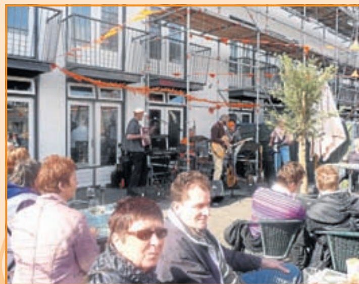
De Klught trad op tussen de steigers voor hotel Chariot in Aalsmeer Oost. Buiten was een gezellig terras ingericht en door de muziek van de heren werd daar tot in de vroege avond genoten. Menig classic uit de sixties kwam voorbij en die waren zeker uitnodigend om 'de dansvloer' op te gaan.