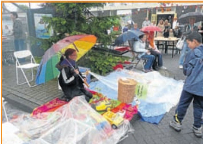
In Rijsenhout begon de Koninginnedag met het hijsen van de vlag en een gezellige optocht. Aan de vrijmarkt daarna kwam al vrij snel een einde. Net toen de verkoop begonnen was, ging het regenen en wel steeds harder. Slechts een handje vol jeugdige verkopers bleef zitten onder een paraplu of tent, maar ook zij hielden het naar een tijdje voor gezien. Geen kopers, is tot slot niets verdienen. De disco mag wel een succes genoemd worden, evenals de voetbalwedstrijd bij SCW.