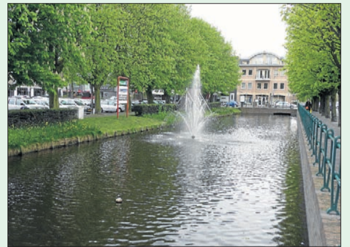
Aalsmeer is een waterrijke gemeente, eenderde deel is water. De fontein in het water bij het gemeentehuis aan het Raadhuisplein is een echte blikvanger, zeker als zomers het hekwerk wordt opgeluisterd met geraniumbakken: Aalsmeer bloemendorp aan het water.

Politieboten gingen gelijk na de start het water op om campagne-materiaal uit te delen aan recreatieschippers op de Poel. Na deze informatieve actie controleert de politie net als op de weg - tijdens diverse acties schippers op alcoholgebruik.