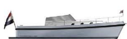
HOLLANDER TREND 32 cabrio €119.900,-

HOLLANDER TREND Dit stoer vormgegeven schip wordt op een vernieuwende manier gebouwd. Gewaarborgde kwaliteit voor een zéér aantrekkelijke prijs.