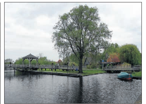
Het Stokkeland, het groene park achter het gemeentehuis met aanmeerplaatsen voor met name kleine boten. Een heerlijk oase ook om te gaan picknicken. Eveneens gelegen in het centrum.