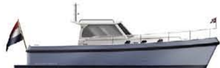
HOLLANDER TREND 32 €119.900,-