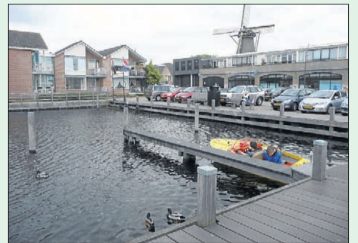
Het Praamplein. Een prima plek voor waterrecreanten om aan te meren. Er zijn stroom- en watervoorzieningen. En midden in de centrum, dus de mogelijkheid om de zeebenen te strekken in de winkelstraten.