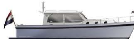
HOLLANDER TREND 35 €149.900,-