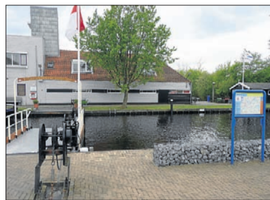
De Kolenhaven biedt eveneens aanmeerplaatsen voor grote boten. Wie de achter gelegen jachthaven De Nieuwe Meer wilt bezoeken, moet met het zelfbedieningspuntje overvaren.