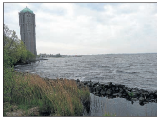
De watertoren, de vijftig meter hoge toren van ingenieur Sangster. Wie enige tijd is weggeweest en bij terugkomst het puntje van de watertoren in het vizier krijgt, weet: Bijna thuis!

Aalsmeer - Vrijdag 4 juli strijkt deze watersportsensatie voor de vierde keer in Aalsmeer neer. Geïnspireerd door het succes van het Friese skûtsjesilen wordt er in de boten van de nationale Regenboogklasse door 15 teams 'om de eer van de gemeente' gezeild. Het NRE start op 1 juli op de Kager Plassen en de zeilwedstrijden worden daarna iedere dag in een andere gemeente, op een andere plas, gezeild. Kijk op www.nationaalregenboogevenement.nl voor spectaculaire beelden, met nfo en het definitieve programma.