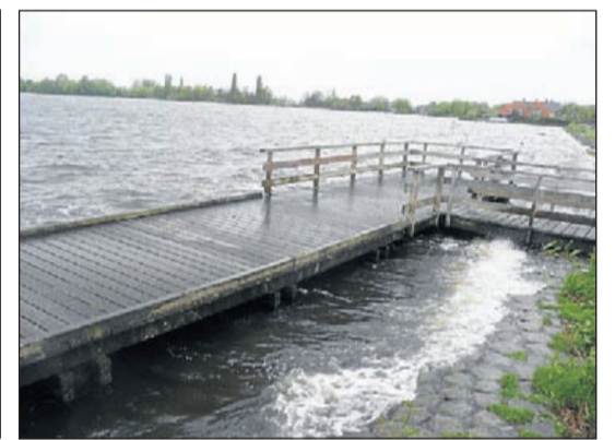
De vissteiger bij de Westeinder, aan de Stommeerweg. Even verderop is de mogelijkheid om boten te water te laten en nog iets verder staat de picknicktafel klaar om gebruikt te worden.