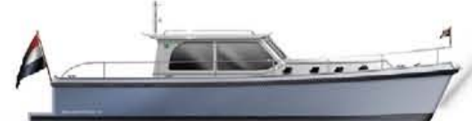
HOLLANDER TREND 38 €179.900,-