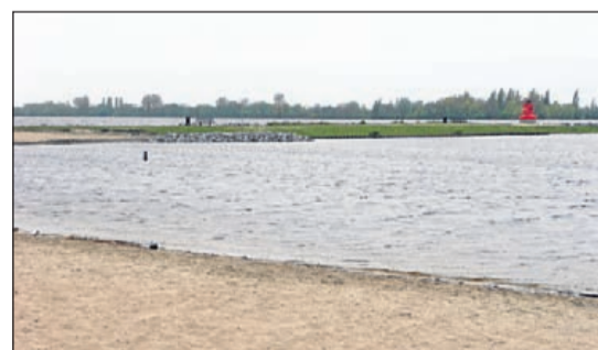
Surfeiland Vrouwentroost, bij mooie zomerdagen bijna wel de meest bezochte plek in Aalsmeer. Heerlijk om te zonnen en voor de kinderen spelen met zand en water en klimmen en klauteren op de klimboot op het eiland. Het Surfeiland is tevens de stek waar zowel de Windsurfclub als de Waterskivereniging hun onderkomen hebben.