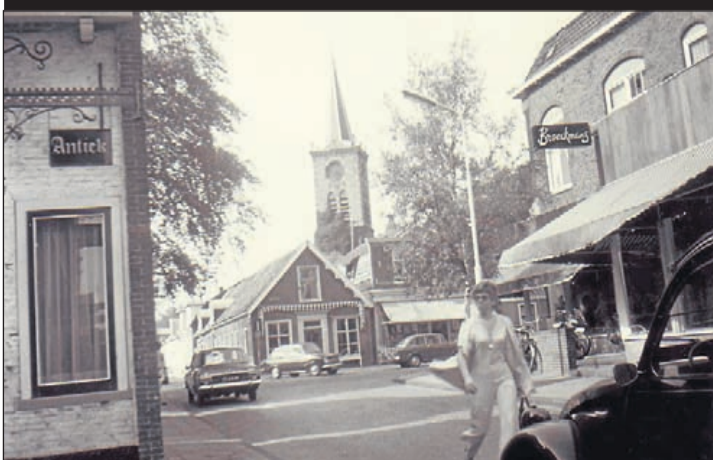
Einde van de Zijdstraat. Op de hoek Kanaalstraat en Dorpsstraat staat nog de groentezaak van Opoe Walraven, tegenwoordig dorpspomp.

Met ondersteuning van de jongerenwerkers van De Binding maakten zij van al die interviews een videodocumentaire, een bijzonder document in de tijdgeest van nu. Deze documentaire zal in een speciaal daarvoor als 'bioscoop' ingerichte ruimte van het Oude Raadhuis een prominente plaats krijgen in de tentoonstelling. Elfjes, korte gedichtjes van leerlingen van alle scholen in deze gemeente, vele foto's en oude documenten uit de tijd van de bevrijding en kunstwerken van Aalsmeerse kunstenaars rond het thema vrijheid maken de tentoonstelling compleet en heel speciaal. Te bezichtigen van 5 mei tot 21 juni aanstaande in het Oude Raadhuis in de Dorpsstraat.