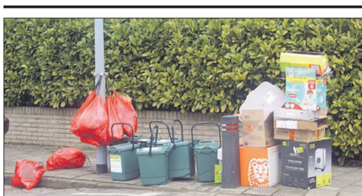
Afval ophaaldag in Rijsenhout. Best rommelig.

huishoudens om de laatste kinderziekten eruit te halen. De inwoners in Rijsenhout volgen het Aalsmeerse afvalplan op de voet. In hun woonplaats is namelijk helemaal geen inspraak gehouden. De bewoners hebben een nieuw systeem voor afval inzamelen 'gewoon' opgelegd gekregen. Een proef sinds 16 januari van een half jaar om 'winst uit je afval' te halen. De inwoners van Rijsenhout hebben hun rolcontainers in moeten leveren. Ter vervanging zijn kleine afvalcontainers uitgedeeld waar dertien pro-