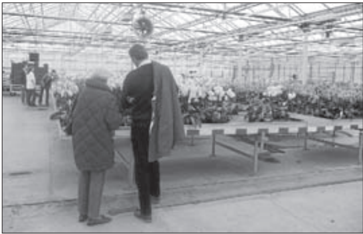
Kijkje in de kas(sen) van Hoogenboom Breeding BV.

Onderdeel van de afspraken is dat Eigen Haard in de eerste helft van 2010 de mogelijkheden onderzoekt om één of twee van haar complexen te verkopen aan starters op de woningmarkt. In het onderzoek komt ook de mogelijke toepassing van vormen van maatschappelijk gebonden eigendom/starterskoopregeling aan de orde. De gemeente zal, waar nodig, medewerking verlenen aan de uitvoering van het verkoopbeleid van Eigen Haard.