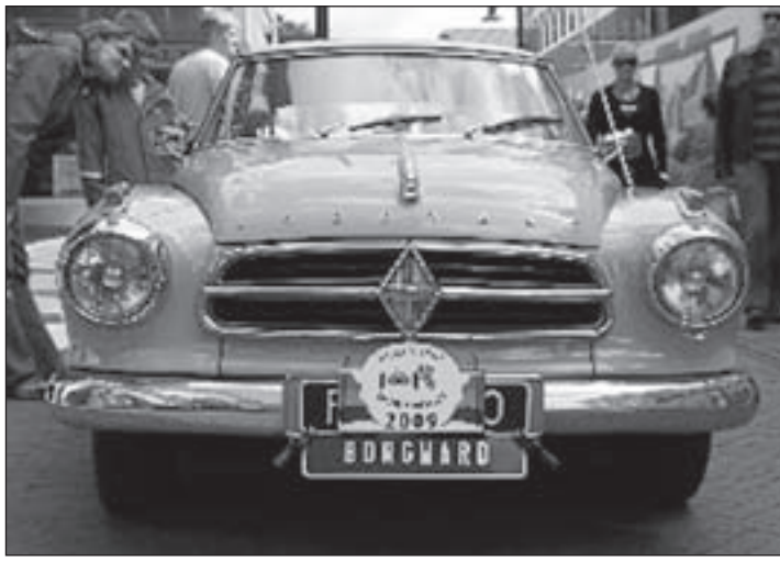
Sfeerimpressie Aalsmeer Roest Niet 2009.

Voorafgaand aan de finale, die om circa 18.00 uur zal beginnen, wordt een jeugdtribune gehouden waarin jonge meners met enkel- en dubbelspan pony's hun kwaliteiten zullen laten zien. De toegang tot dit spektakel is gratis.