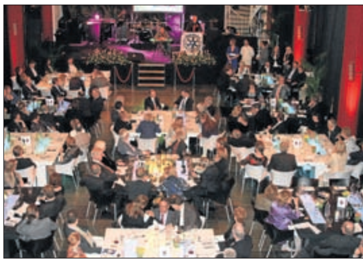
In de fraai ingerichte burgerzaal van het gemeentehuis in Aalsmeer boden bijna 200 gasten voor de goede doelen Stichting Opkikker en Moederverwendag.