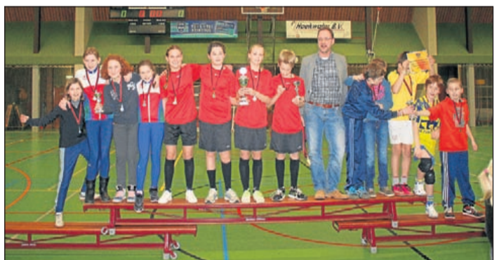
De kinderen van groep 4 tot en met 8 van De Brug hebben met zeven teams meegedaan met het schoolvolleybaltoernooi afgelopen zaterdag 15 februari. Groep 4 heeft zilver gewonnen en groep 8 heeft goud gewonnen. Zij mogen naar de provinciale kampioenschappen.