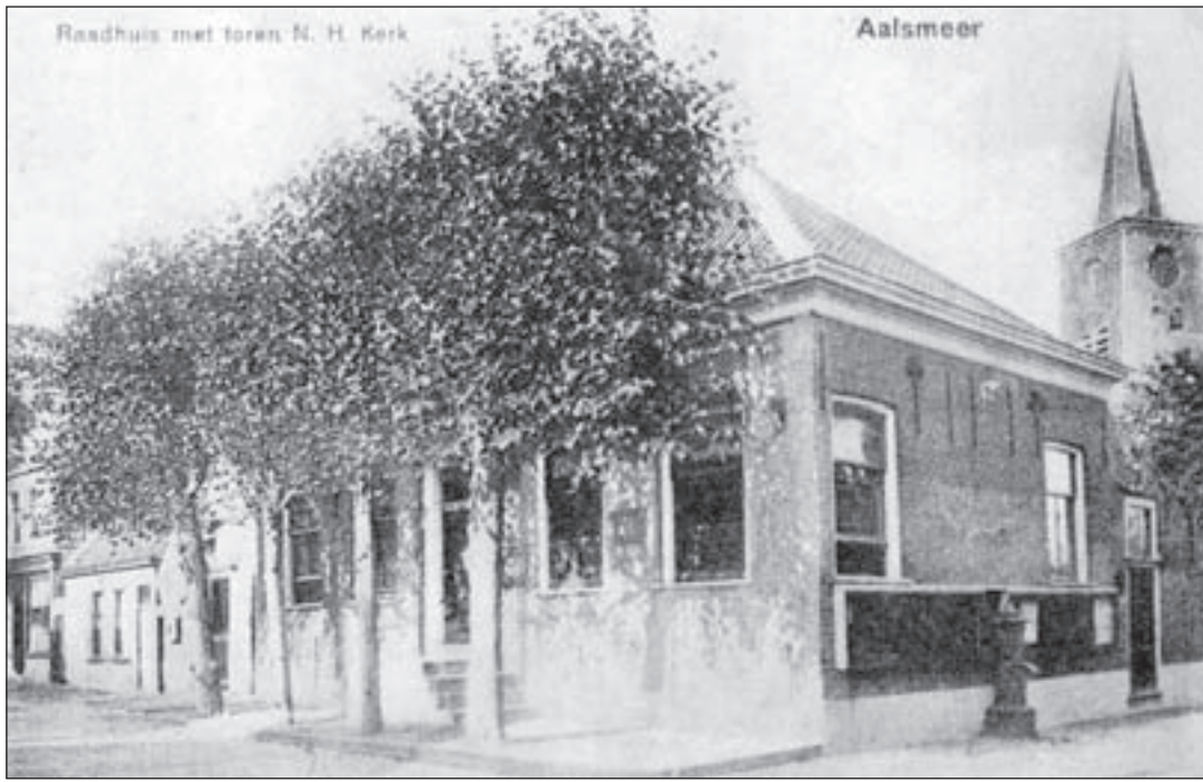
Foto van het gemeentehuis, nu Oude Raadhuis, in de Dorpsstraat met aan de zijkant de dorpspomp.

Coq Scheltens: "Oud model zo goed mogelijk maken"