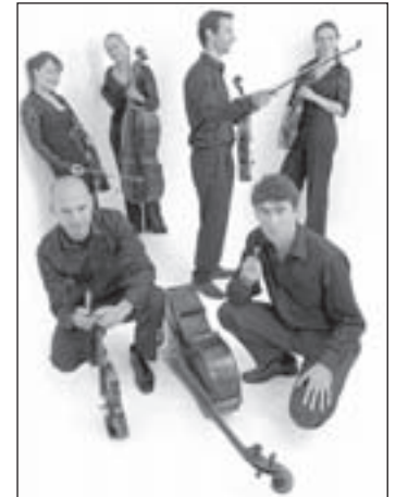
Per abuis is vorige week de foto van het Dehmel ensemble bij een verkeerd artikel geplaatst. Het zestal heeft het publiek afgelopen zondag getraakteerd op een hartstochtelijk Valentijnsconcert.