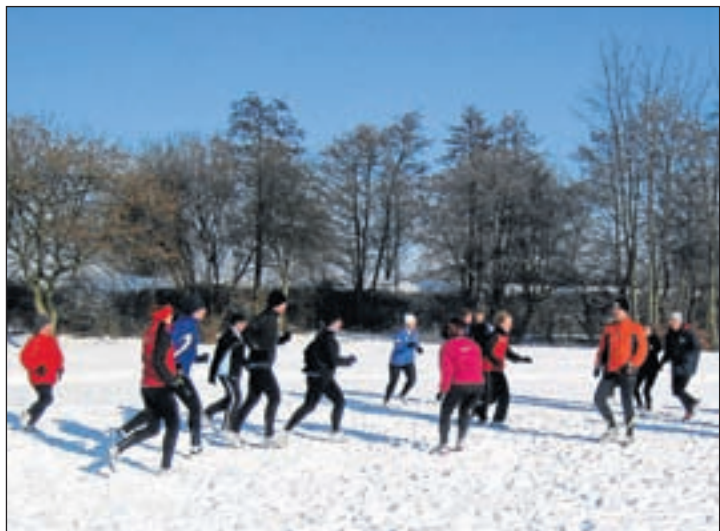
Deelnemers van de 10 groep tijdens de warming-up.

was een stand van 15-10 bereikt. Bij de stand van 28-30 wist Mark een belangrijke strafworp te keren én schoot Aalsmeer er voor de zekerheid nog een in: de overwinning was zeker! Op zaterdag 4 februari, een prachtige schaatsdag, moesten de jongens D1 van FIQAS Aalsmeer naar de Kwakel voor een wedstrijd bij KDO, waar ze moesten aantreden tegen een meidenteam. Dat derde hen niet. De ploegen gingen rusten bij een 10-4 voorsprong voor FIQAS Aalsmeer. Ook na de pauze ging de D1 door met het goede spel: Wessel scoorde de mooiste goal van de wedstrijd (13-5) en uiteindelijk werd het 18-7. Prima gedaan! Een dag later moesten de jongens D3 naar Leidsche Rijn in Vleuten. Het werd een lastige wedstrijd tegen een gemengd team. Hoewel er wel hard werd gewerkt door de mannen van de D3 moesten ze de punten uiteindelijk toch aan Leidsche Rijn laten, dat met 16-9 won.