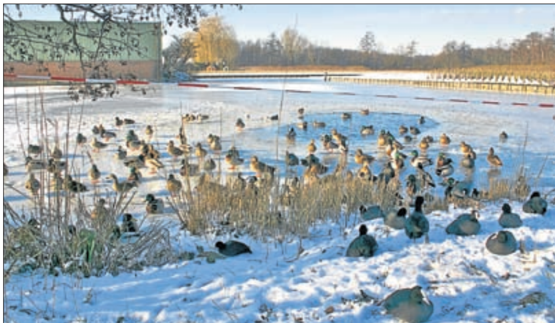
De eenden en vogels hebben het moeilijk op dit moment. Het is moeilijk om aan eten te komen. Denk ook aan hen en hang of leg iets lekkers voor ze in de tuin of op het terras en op dit moment worden eenden heel blij van (oud) brood.