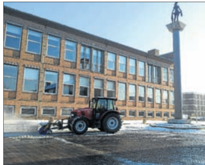
Een borstelwagen veegt het Raadhuisplein schoon voor de markt dinsdag.

strijd om 11.00 uur. Inschrijven kan vanaf 10.30 uur. Om 13.00 uur wordt vervolgens het startschot gegeven voor de schaatswedstrijd voor de groepen zes, zeven en acht. Inschrijven kan vanaf 12.00 uur. Koek en zopie is aanwezig!