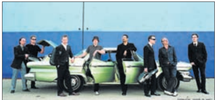
Foto New Cool Collective: Sannah de Zwart . Foto van Andermans Veren: Govert de Roos . Foto Peter van der Hurk: Nol Havens .

Zaterdag New Cool Collective Zaterdagavond 4 februari staat in het teken van New Cool Collective. Vet, energiek en dansbaar, zijn typering voor deze 19-koppige Big Band. De grote groep muzikanten brengt een unieke mix van jazz, dance, latin, salsa en afrobeat naar het theater. De muzikanten van New Cool Collective waren als pioniers in de Nederlandse jazz lang een vreemde eend in de bijt. Tegenwoordig worden zij op handen gedragen