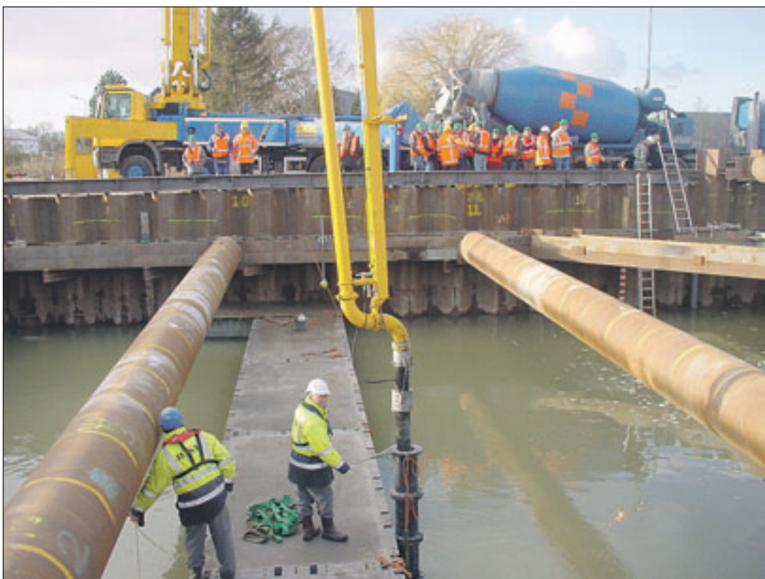
Op uitnodiging van projectbureau N201+ woonden pers en omwonenden, voorzien van een bouwhelm, laarzen en een fluorescerend bezoekersvestje jl. dinsdag de unieke betonstort bij.