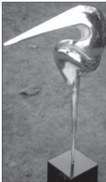
Plastiek van Ruurd Hallema.

De ontvanger wisselt de kunstcheque in voor het kunstwerk dat hem of haar aanspreekt. Sous-Terre is gevestigd op een bijzondere en unieke locatie, in de waterkelders van de historische watertoren van Aalsmeer aan de Westeinderplasen. De galerie en beeldentuin aan de Kudelstaartseweg 1 is iedere zaterdag en zondag van 13.00 tot 17.00 uur geopend, maandag tot en met vrijdag op afspraak: 0297-364400 of info@galerie-sous-terre.nl . Voor meer informatie: www.galerie-sous-terre.nl