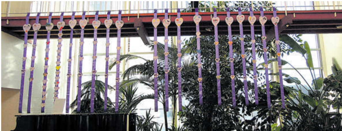
Linten- en hartjesactie voor 'Hart voor Kanker'.