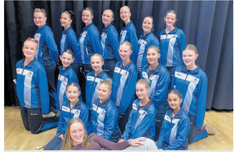
De succesvolle twirlsters van SV Omnia.