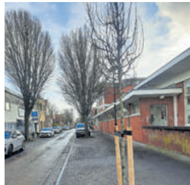
Nieuwe aanplant in de Schoolstraat: Een 'baby' boom ter vergelijking met zijn grote broers en zussen in deze straat.

Een lichtpuntje dan: Op locaties waar nu bomen worden gekapt, worden in principe in het plantseizoen 2026 en 2027 nieuwe bomen aangeplant. De bomen die in 2024 uit veiligheidsoverwegingen zijn weggehaald, zijn de afgelopen weken vervangen. In totaal zijn er ongeveer 70 nieuwe bomen aangeplant, waaronder 1 in de Schoolstraat. Een baby ter vergelijking met zijn broers en zussen in deze straat. Doe je best en wordt ook een 'dikke gast'! Naast het planten van nieuwe bomen wordt door de gemeente ook nog een extra groenimpuls gegeven door het planten van nog eens 160 extra bomen om Aalsmeer en Kudelstaart verder te vergroenen. Met dit extra budget voor nieuwe aanplant wordt het belang van vergroening en klimaatadaptatie onderstreept. De aanplant is gestart en wordt in het eerste kwartaal van 2026 afgerond.