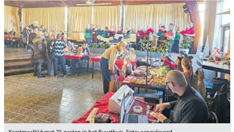
Kerstmaaltijd met 75 gasten in het Buurthuis.

ze deze fantastische band. Deze zondag eert The LSB Experience één van de grootste songwriters aller tijden in hun gloednieuwe liveshow: Songs of Paul McCartney. Voordat de band met deze unieke show de theaters in gaat, komt het zestal optreden in The Shack. In deze show brengt The LSB Experience niet alleen de wereldberoemde nummers die McCartney schreef voor The Beatles, maar ook werk uit zijn solocarrière en zijn periode met Wings. Daarnaast is er aandacht voor liedjes die hij schreef voor en met andere artiesten. Songs of Paul McCartney is een muzikale reis langs zijn indrukwekkende oeuvre, omlijst met verhalen en gebracht door The LSB Experience – nationaal en internationaal gepezen om hun indrukwekkende samenzang en muzikale vakmanschap. Aanvang 16.00 uur, entree 25 euro. Voor sommige optredens is de animo erg groot. Reserveren is uiteraard niet verplicht maar wel mogelijk per mail: info@the-shack.info . Adres: Schipholdijk 253b in Oude Meer.