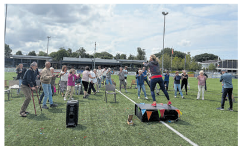
Samen sporten voor 65+ tijdens 'De Derde Helft' bij FC Aalsmeer.

Zo ontstaat een inclusieve groep waarin mensen met en zonder dementie elkaar ontmoeten, samen optrekken en zich welkom voelen. Het doel is thuiswonende mensen met dementie langer laten meedoen, in een veilige en stimulerende omgeving. Door hen samen te brengen met buurtgenoten en vrijwilligers worden sociale netwerken versterkt en wordt eenzaamheid verminderd. Met deze samenwerking zetten Zorggroep Aalsmeer en Participe samen een mooie stap richting een dementievriendelijke samenleving, waarin iedereen de ruimte krijgt om actief, gezien en verbonden te blijven. 'De Derde Helft' is voor alle 65+ers en wordt iedere woensdagmiddag gehouden bij FC Aalsmeer. Inloop vanaf 13.30 uur. Voor vragen of aanmelding kan contact opgenomen worden met Tristan van der Jagt per mail: ontmoetingscentrum@zg-aalsmeer.nl of bel 06-22468574.