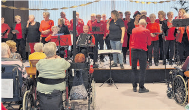
Optreden smartlappenkoor 'Denk aan de Buren' voor bewoners van Zorggroep Aalsmeer.

In de weken voorafgaand aan het festival kunnen inwoners hun verhalen insturen. Dit jaar zoekt de Bibliotheek verhalen met het thema: Een onverwacht bericht. Een onverwachte brief, een appje dat je hart sneller doet kloppen. Het kan iets moois zijn. Of iets moeilijks. Hoe