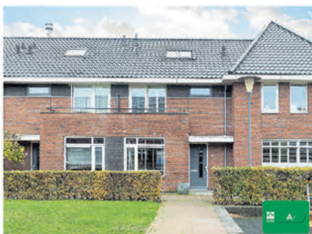
Gemaalstraat 4 Aalsmeer