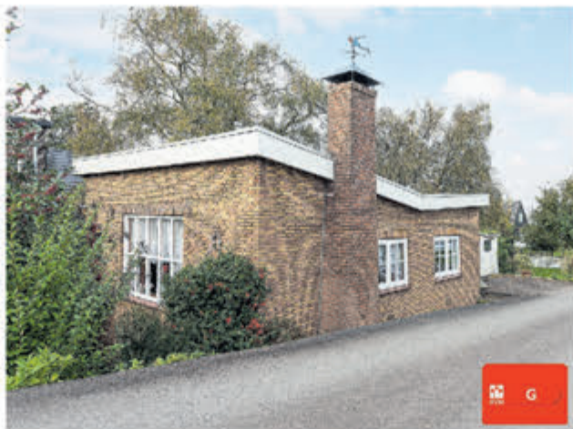
Oosteinderweg 569 Aalsmeer