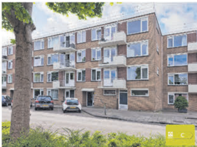
Geraniumstraat 68 Aalsmeer