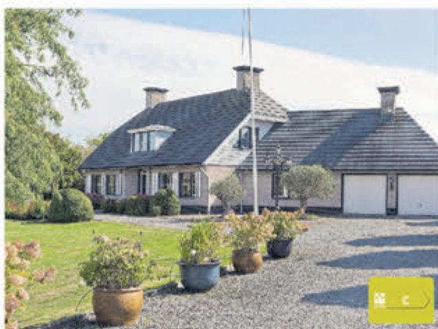
Hoofdweg 77 De Kwakel