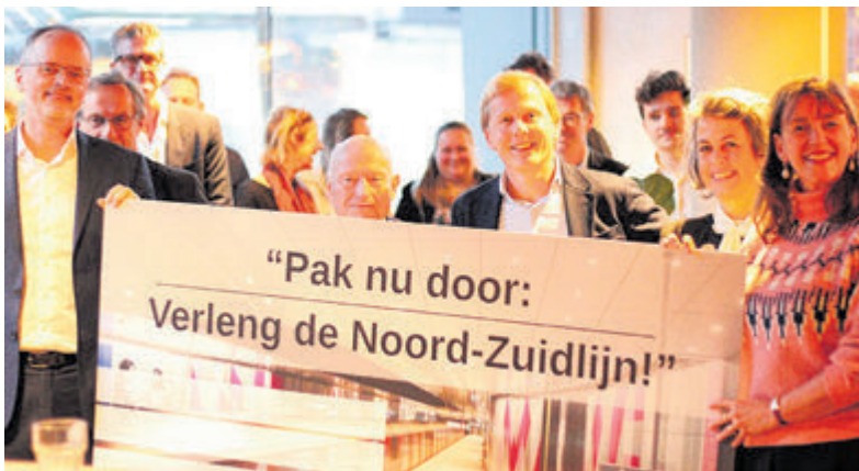
Petitie om snelle doortrekking Noord/Zuid lijn te verwezenlijken.

sloten met een lekkere erwtensoep maaltijd. Daarna was het afgelopen dinsdag tijd voor de jaarlijkse kerstmaaltijd. De maaltijd werd geheel verzorgd en bediend door een grote groep vrijwilligers van het Buurthuis. Dit jaar waren er 75 gasten die gezellig met elkaar aan tafel genoten van soep, een uitgebreid buffet, lekker dessert en uiteraard koffie en thee toe. Het was een avond voor ontmoeting van jong en oud, gezelligheid en met elkaar delen, geheel in de sfeer van kerstmis. In 2026 staan er weer leuke en diverse activiteiten op de agenda van Buurthuis Hornmeer. Het team van het Buurthuis is ook op zoek naar extra vrijwilligers om van alle activiteiten voor het nieuwe jaar weer een succes te maken. Neem contact op met buurthuishornmeer@gmail.com voor een vrijblijvende kennismaking.