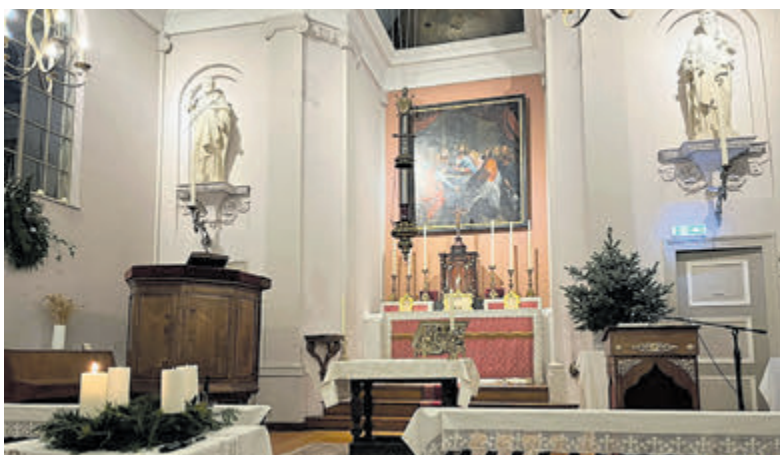
Het interieur met knipscheer orgel van de Oud Katholieke kerk.

Zin om in het gezellige koor van Caritas mee te zingen? Kom dan gerust eens kijken en luisteren. De eerstvolgende repetitieavond is op maandag 12 januari vanaf 20.00 uur in de Ontmoetingskerk Rijsenhout. Iedereen in de leeftijd tot 65 jaar is hartelijk welkom!