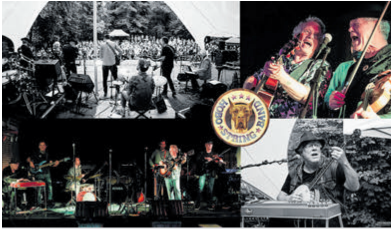
Bacchus da Musica luidt het nieuwe jaar in op zaterdag 3 januari met een optreden van de Hobo String Band.