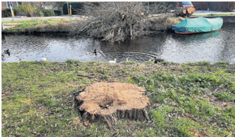
'Dag jongen', boom op Stokkeland bij picknickplek gekapt.

Ook wil de provincie Noord-Holland de verkeersveiligheid en doorstroming op de kruisingen van de N231 met de Bachlaan en Mijnsherenweg verbeteren. Daarnaast moet het fietspad langs de weg verbeterd worden. De provincie werkt hiervoor aan het voorlopig ontwerp samen met de Vervoerregio Amsterdam (VRA) en de gemeente Aalsmeer. Meer informatie over het project is te vinden op www.noord-holland.nl/n231zuid . Weggebruikers en omwonenden met vragen kunnen contact opnemen met het Servicepunt van de provincie via telefoonnummer: 0800-020 0600 (gratis) of per e-mail: servicepunt@noord-holland.nl .