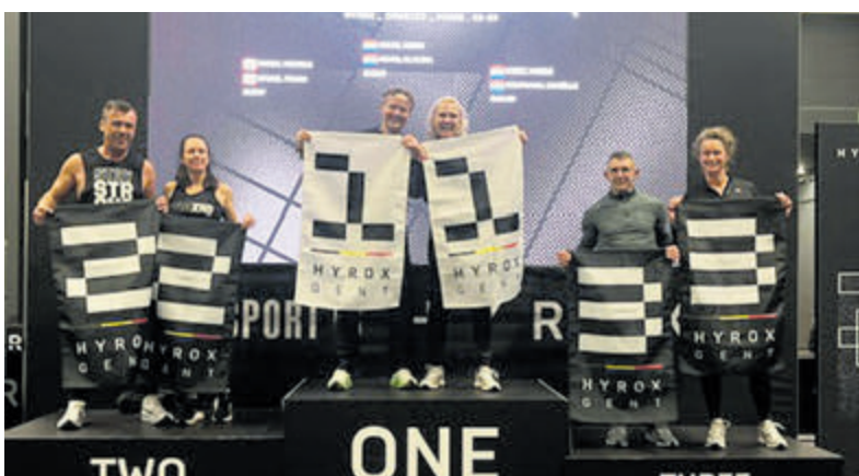
De winnaars van de Hyrox-wedstrijden in Gent.

'Rondje' midgetgolfen In het mooie park aan de Beethovenlaan is het ook in deze milde herfstmaand goed toeven. Elke woensdagmiddag en in het weekend kan een 'rondje' gespeeld worden. Voor de koukleumen staan in de gezellige kantine de koffie en warme chocolademelk klaar!