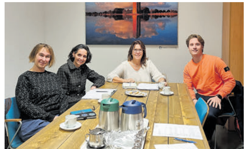
Samenwerking Zorggroep Aalsmeer en Participe Amstelland.