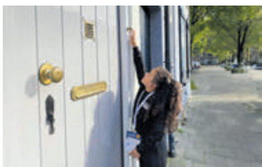
Verkoop loten voor de Grote Clubactie.

Aalsmeer – Een historisch besluit sinds de oprichting van de Grote Clubactie in 1972: het afdrachtpercentage naar verenigingen is verhoogd van 80% naar 85%. Deze verhoging wordt per direct toegepast op de actie van dit jaar. Hierdoor ontvangen elf verenigingen in Aalsmeer het mooie bedrag van 39.002 euro.