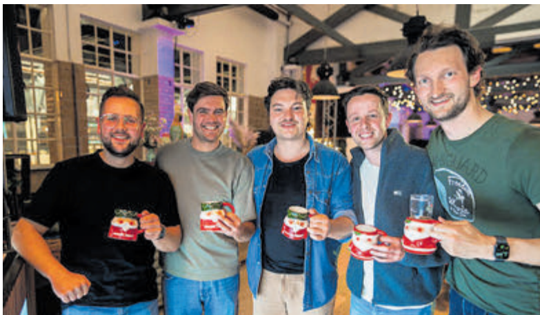
'De 4 braincellen' vielen met z'n vijven in de prijzen bij de Popquiz.