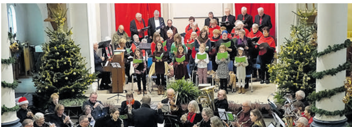
Kerstconcert Cum Ecclesia met medewerking van Flora, de Kudelkwetters en koor Allegro uit Nieuwkoop.

Kudelkwetters en het koor Allegro uit Nieuwkoop hun steentje bij om de bezoekers in kerststemming te brengen. Het concert begint om 15.00 uur, de kerkdeuren staan vanaf 14.30 uur open. De toegang is gratis en na afloop zorgt VZOD op het kerkplein voor warme chocolademelk en glühwein. Weet u van harte welkom!