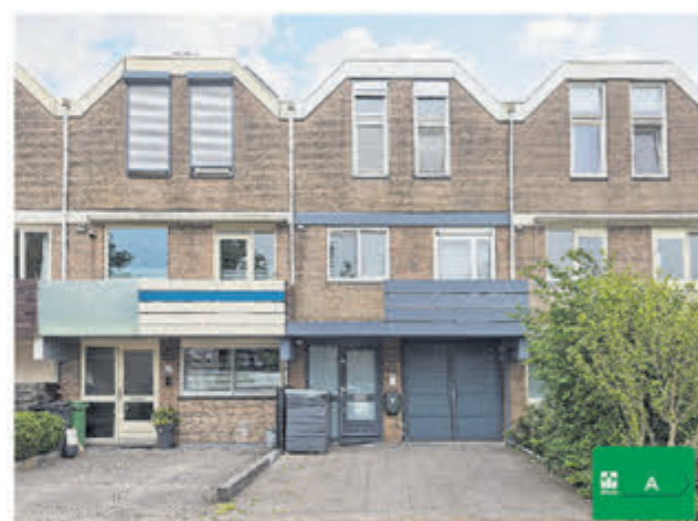
Turfschip 217 Amstelveen