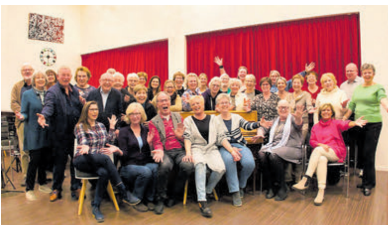
AdHoc koor Amstelveen oefent voor het kerstconcert.