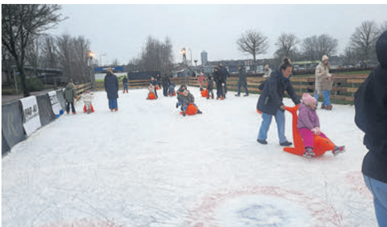
Schaatsen op de baan bij Westeinder Winter Village.