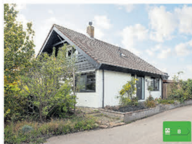
Uiterweg 272 Aalsmeer