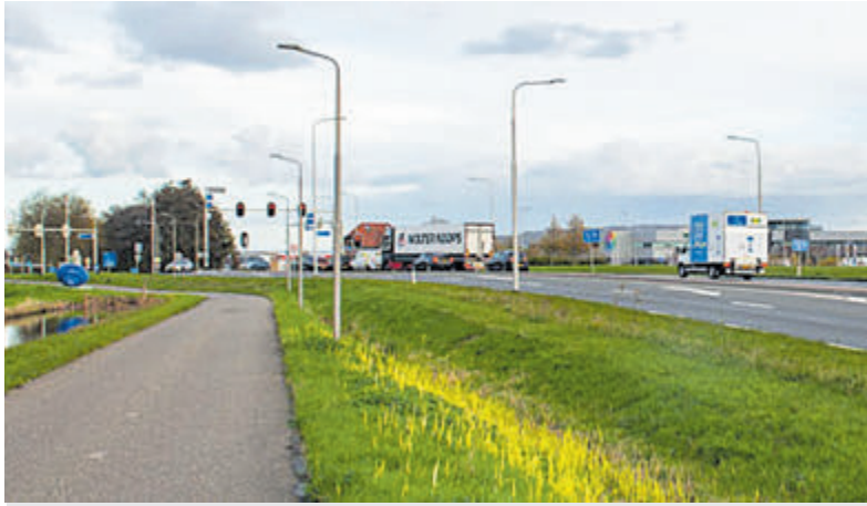
Kruising Legmeerdijk (N231) met de Bachlaan.