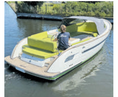
Sloepen en tenders van Antaris, Maril en Maxima tijdens de eindejaarsshow bij Jachthaven Poelgeest.

design. Van het merk Maxima is bij Poelgeest de nieuwe Maxima 920 Cabin te zien. Deze kajuitboot is voorzien van een krachtige Yanmar diesel en is prima geschikt voor dagtochten maar ook uitgerust voor een langer comfortabel verblijf aan boord. Natuurlijk is ook de vertrouwde serie tenders van Maxima te bezichtigen. Voor de voorraad- en demonstratiemodellen zijn er zeer interessante aanbiedingen. De eindejaarsshow wordt gehouden van 10.00 tot 17.00 uur in de showroom van Jachthaven Poelgeest aan de Hugo de Vrieslaan 1 te Oegstgeest. Een voorproefje is alvast te vinden op www.poelgeest.nl .