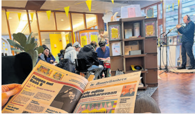
Verhalenkaravaan in Bibliotheek Amstelland (foto aangeleverd).

Bemmelen. Beleef de kracht van muziek en kunst door de samenwerking van twee verschillende koren en de combinatie van zand en zang! Voor dit concert zijn nog toegangskaarten verkrijgbaar à 15 euro, inclusief een consumptie. Voor kinderen tot 13 jaar is er een gereduceerd tarief van 10 euro. En voor de houders van de Aalsmeerpas is de entree gratis. Kaarten zijn te koop bij Slijterij Wittebol (Ophelialaan) en aan de zaal. Ook via de website ( www.davanti.nl ) kunnen kaarten worden besteld.