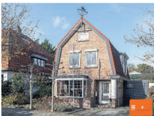
Hadleystraat 13 Aalsmeer