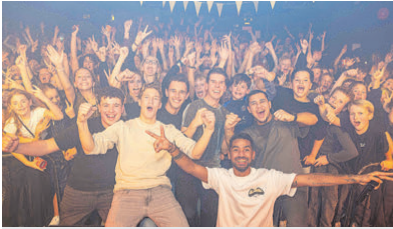
Goede sfeer tijdens het Groep 8 Feest.