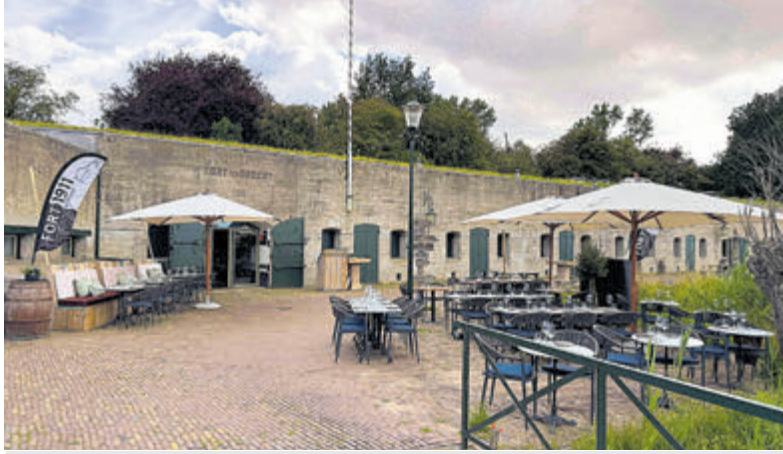
Brasserie Fort 1911 in het Fort aan de Drecht.