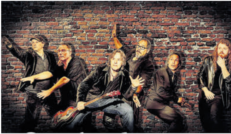
The LSB Experience komt optreden in The Shack.