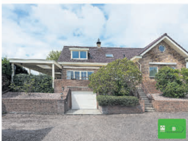
Legmeerdijk 272 A Aalsmeer