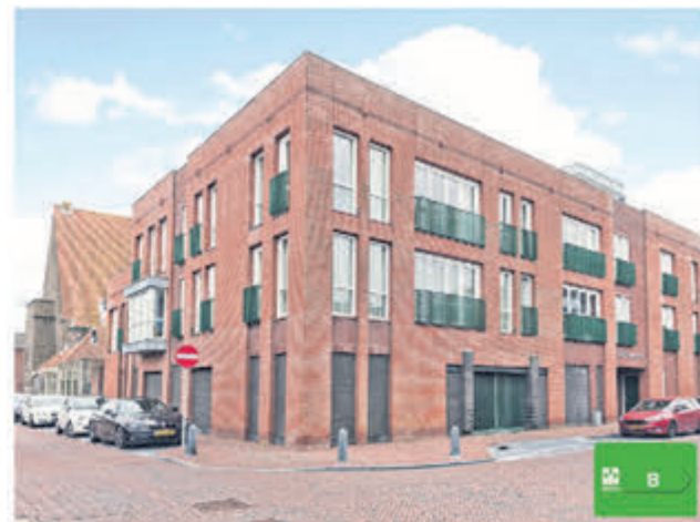
Weteringstraat 2 G Aalsmeer