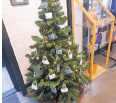
Kunstkijken in kerstsfeer bij Art Centre Aalsmeer.