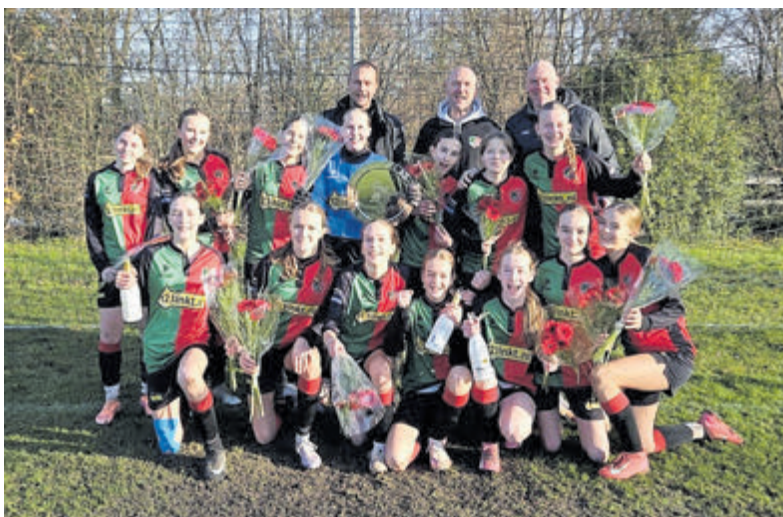
Vreugde bij de MO15-1 van FC Aalsmeer na de ruime zege op Swift en de promotie naar de hoofdklasse.

de junior level A op de eerste plaats uitkwam en kampioen werd. Nikki en Catharina werden kampioen in de duo twirling jeugd beginner categorie. Nikki en Catharina namen deel aan de Duo Twirling in de categorie jeugd beginner. Ook deze twee twirlsters mochten een gouden medaille in ontvangst nemen en zich kampioen noemen. In de Solo dance twirl categorie behaalden Ilse, Catharina en Isa respectievelijk de 8e, 5e en 3e plaats in hun eigen categorie. Demi werd uiteindelijk 5e bij de Adult level B. Catharina werd daarnaast kampioen in de artistic solo jeugd level B categorie, terwijl Fien uitkwam op de 5e plaats van Nederland als junior beginner. Sterre en Isa in de junior level B en A wisten allebei een 2e plaats en dus een zilveren medaille te bemachtigen. Mireille eindigde op de 2e plaats in de adult elite categorie. Het duo Yinthe en Ilse werd kampioen in de categorie duo dance twirl jeugd beginner. Het artistic team met Yinthe, Elisa, Ilse, Nikki, Fleur en Catharina behaalde de eerste plaats en werd ook kampioen. De vereniging en trainsters zijn trots op deze mooie resultaten en gaan zich samen met de twirlsters na de feestdagen richten op het volgende twirlseizoen. Interesse gekregen in Twirlen? Bezoek de website www.svomnia.nl voor meer informatie.