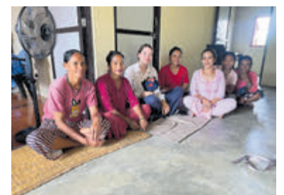
Project voor Tharu vrouwen door Nepal Benefiet Aalsmeer.

momenteel twee aanvullende initiatieven in de regio Tobang: Uitbreiding van het lunchprogramma voor de schoolkinderen van Tobang om meer kinderen dagelijks een voedzame maaltijd te bieden. Inrichting van een school in de buurt van Tobang, zodat kinderen toegang krijgen tot een veilige en goed uitgeruste leeromgeving. Voor de aanschaf van naaimachines, stoffen en trainingsmaterialen is financiële steun nodig. Ook voor de toekomstige projecten in Tobang zijn donaties van harte welkom. Elke bijdrage helpt om vrouwen en kinderen in Nepal een toekomst met meer kansen en waardigheid te geven. Stichting Nepal Benefiet Aalsmeer zet zich al jaren in voor projecten die onderwijs, gezondheidszorg en economische ontwikkeling in Nepal bevorderen. Meer informatie is te vinden op www.nepalbenefietaalsmeer.nl . Via de website kan ook een donatie gegeven worden.