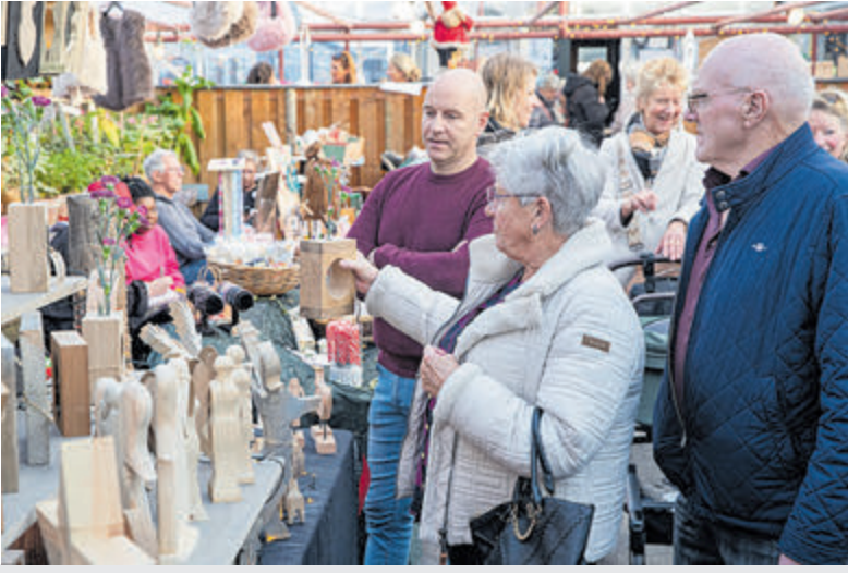
Veel bezoekers en gezelligheid tijdens de kerstmarkt van Lions Ophelia.