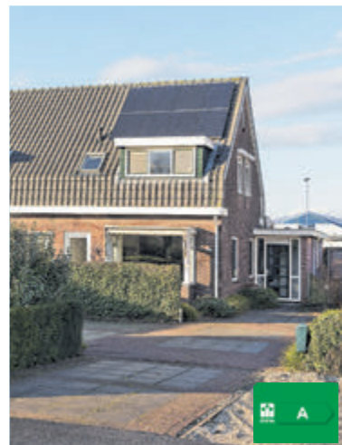
Aalsmeerderweg 487 Aalsmeer