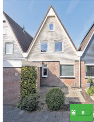
Van Leeuwenhoekstraat 24 Kudelstaart