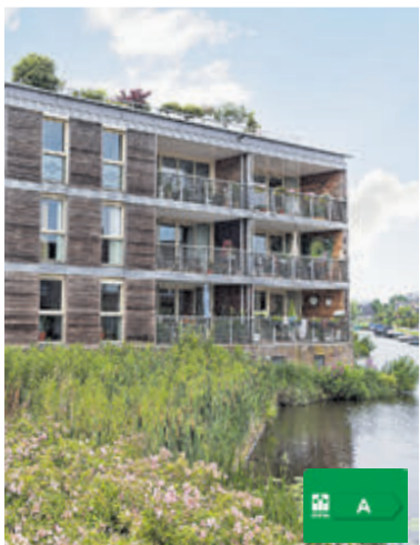
Drie Kolommenplein 93 Aalsmeer