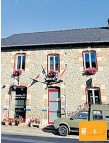
La Bouchère 33 Frankrijk