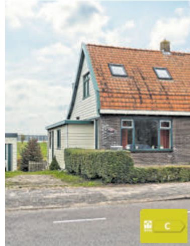
Aalsmeerderdijk 423 Aalsmeerderbrug