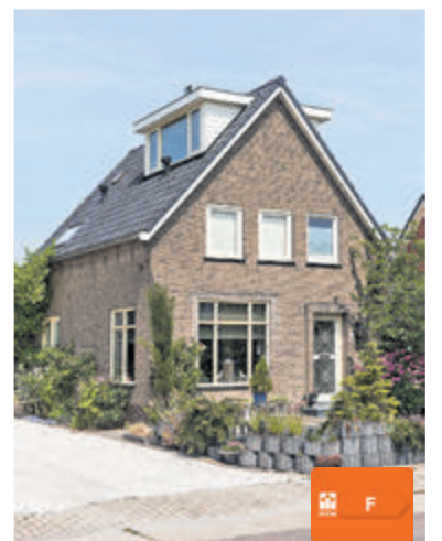
Uiterweg 324 Aalsmeer