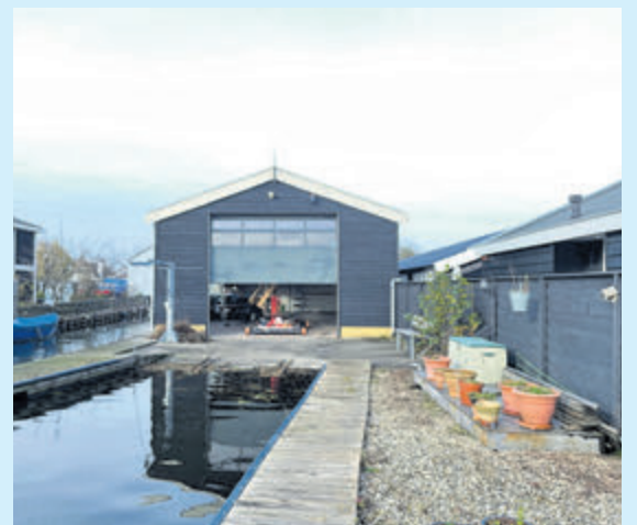
Uiterweg 245 Aalsmeer Loods met boothelling

Huurprijs € 1.350,- p/mnd, excl. Vraagprijs € 250.000,- k.k.