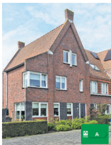
Vlinderweg 190 Aalsmeer