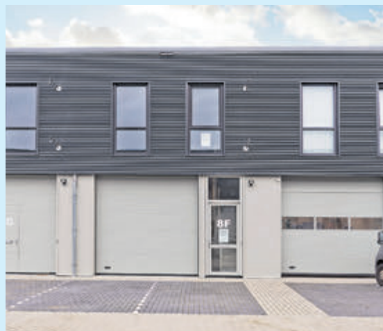
Zuid-Afrikaweg 8F Aalsmeer Bedrijfs-/kantoorruimte

Huurprijs € 1.350,- p/mnd, excl. Vraagprijs € 250.000,- k.k.