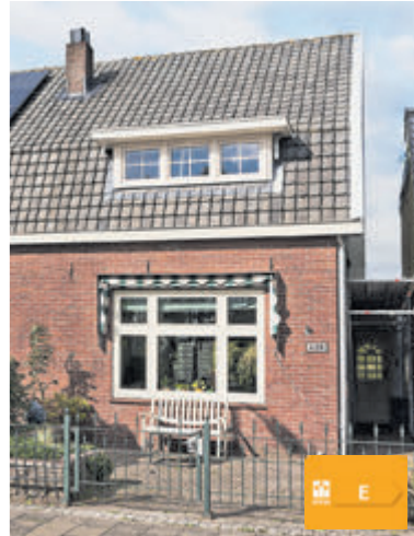
Aalsmeerderdijk 428 Aalsmeerderbrug