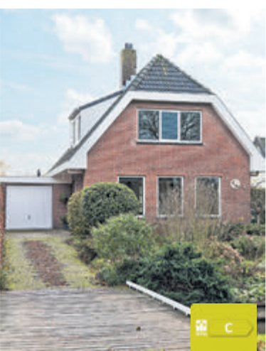
Aalsmeerderweg 54 Aalsmeer