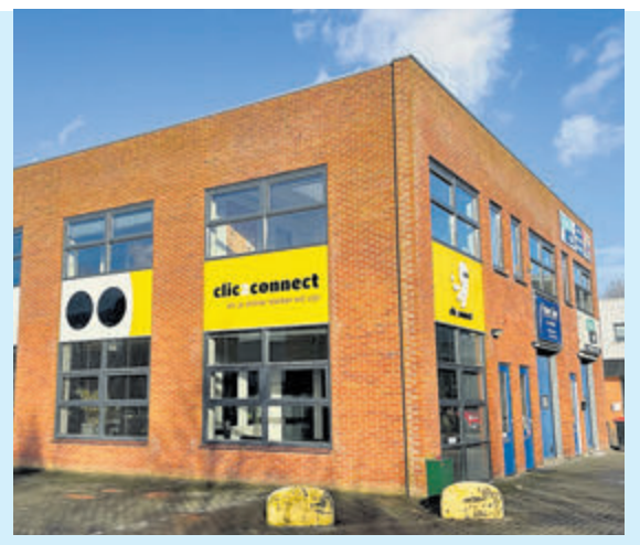
Witteweg 62 Aalsmeer Kantoorruimte Huurprijs € 1.350,- p/mnd, excl.