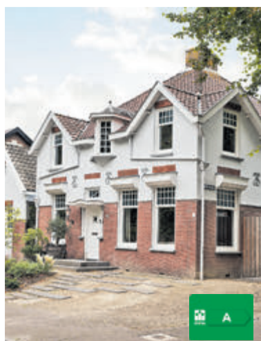
Hoofdweg 683 Hoofddorp