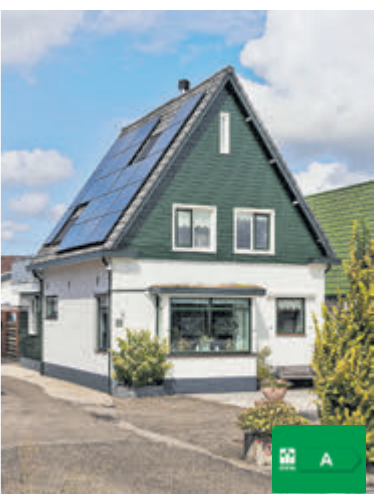
Aalsmeerderweg 281a Aalsmeer