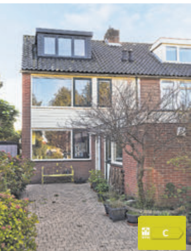
IJsvogelstraat 29 Aalsmeer