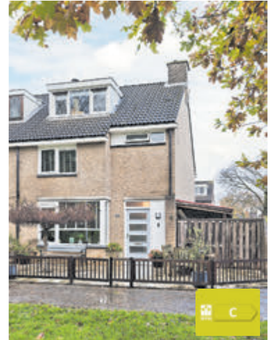
Kamerlingh Onnesweg 108 Kudelstaart