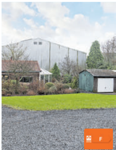
Oosteinderweg 272 a Aalsmeer