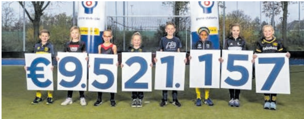
Geweldige opbrengst van de Grote Clubactie 2020.