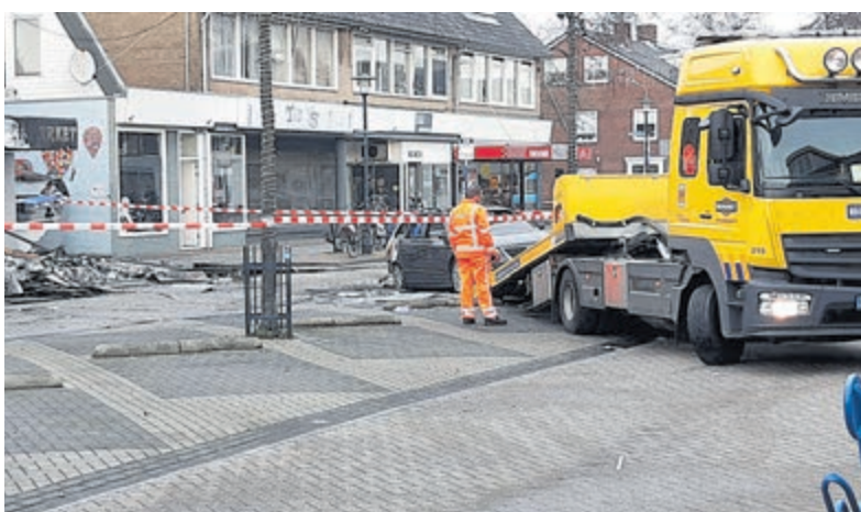
De door de brand zwaar beschadigde auto wordt weggesleept.

De politie wil graag weten wat er precies gebeurd is en komt graag in contact met getuigen en/of betrokkenen. Heeft u iets gezien of gehoord, of beschikt u over beelden? Neem dan contact op met de politie via het nummer 0900-8844. Blijft u liever anoniem, beld dan naar Meld Misdaad Anoniem: 0800-7000. Getuigen kunnen ook gebruik maken van het tipformulier op de website: www.politie.nl