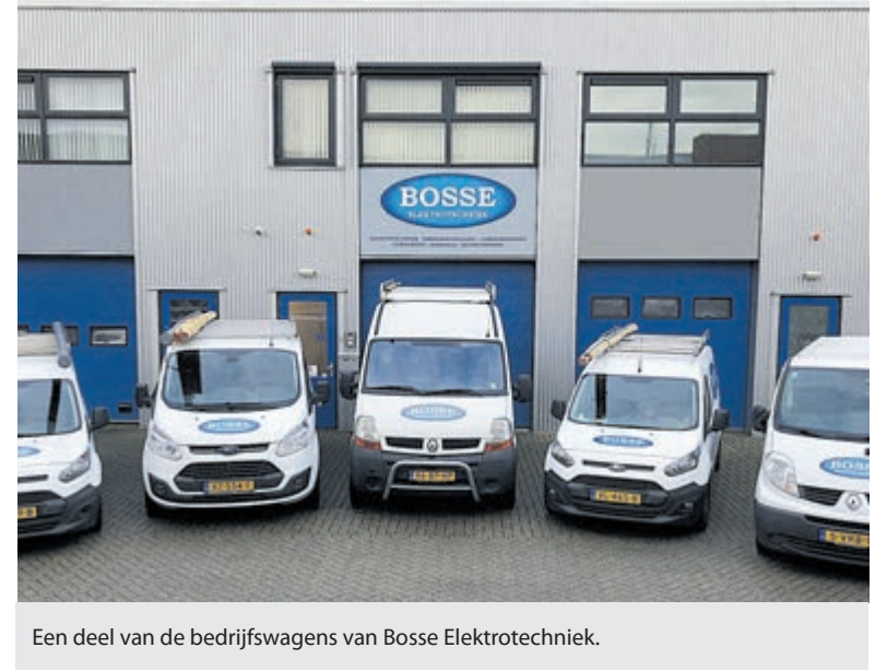
Een deel van de bedrijfswagens van Bosse Elektrotechniek.

kapje dragen wanneer een klant hierom vraagt en overige hygiëne-maatregelen. "Ook al gaat het goed, we blijven voorzichtig. Niemand weet wat de toekomst brengt." Bosse Elektrotechniek heeft net een mooi project afgerond van montage van zeventienhonderdvierentachtig zonnepanelen bij Jachthaven Stenhuis. Om beelden hiervan te bekijken check de Facebookpagina: www.facebook.com/bosseelektrotechniek en lees er volgende week alles over in deze krant.