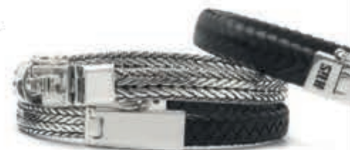
SILK JEWELLERY Voor iedere pols een stoere armband v.a. € 89,-