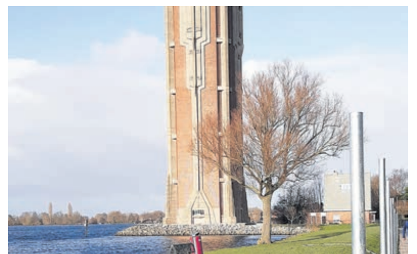
De eenzame boom nabij de Watertoren gaat verdwijnen, net als zes andere bomen en diverse struiken langs de oever van de Westeinderplassen.

Toch een glimp van de ondergaande zon opvangen of de hond uitlaten kan op een gedeelte van het surfstrand nabij de parkeerplaats. En wellicht nog even de 'eenzame boom' gedag gaan zeggen. Deze solitaire wilg nabij de watertoren is qua beeldmarkt, maar verkeert volgens de gemeente niet meer in goede gezondheid. Er komt een nieuwe bijzondere boom voor terug, vermoedelijk een treurwilg. Naast de wilg worden nog zes andere bomen en diverse struiken verwijderd. In het te realiseren Waterfront komen in totaal 17 nieuwe bomen en diverse groenvoorzieningen, waaronder groenweides.