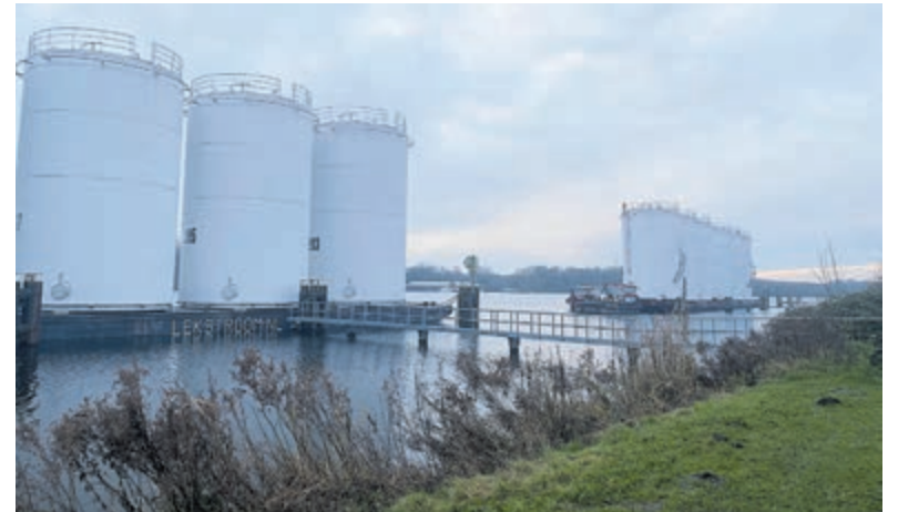
Silo's op weg naar Antwerpen.

eters, vlekkeloos en is geen schade gemaakt. Het transport vertrekt vanuit 't Zand en gaat via de staande mastroute (Ringvaart) naar Amsterdam om tot slot afgeleverd te worden in de haven van Antwerpen. De silo's gaan hier gebruikt worden voor de opslag van plantaardige olie. In totaal gaan 70 silo's naar België vervoerd worden, er volgen dus nog enkele 'ritjes'.