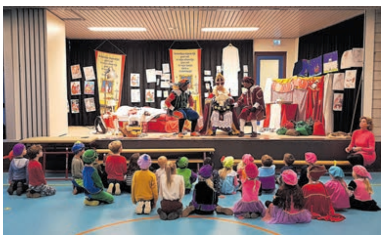
Sinterklaas en de Pietsen op het podium in de speelzaal.