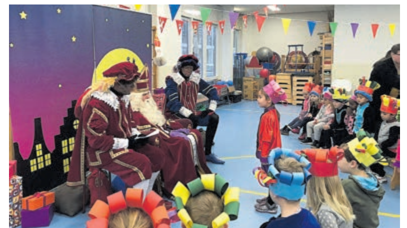
Op bezoek bij Sinterklaas en de Pietsen. Best heel spannend...