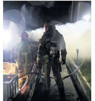
Brandweer in actie bij de brandende boot.

informatie in deze heeft, wordt verzocht contact op te nemen met de politie via 0900-8844 of anoniem via 0800-7000.