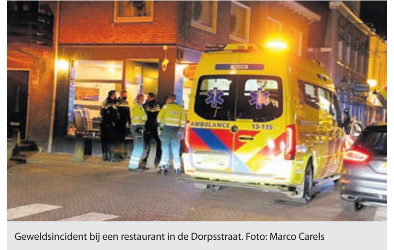
Geweldsincident bij een restaurant in de Dorpsstraat.

De politie heeft de zaak in onderzoek. Mogelijk zijn er getuigen. Zij worden verzocht contact op te nemen met de politie via 0900-8844 of anoniem via 0800-7000.