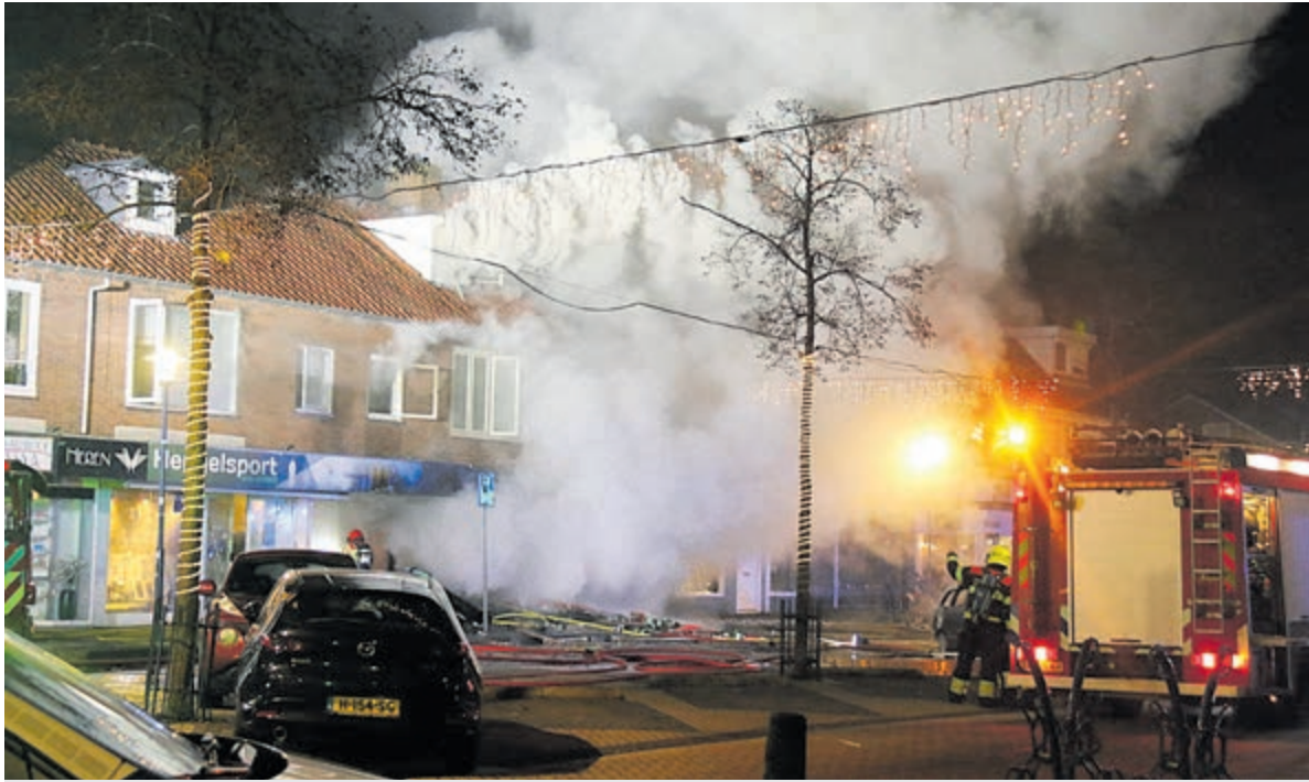
Explosie en brand in Poolse supermarkt in de Ophelialaan.