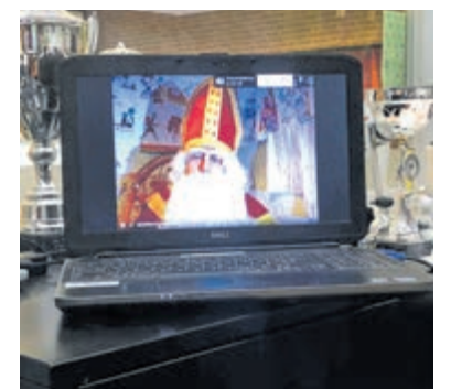
Internetbezoek Sinterklaas met leerlingen van KC De Ruimte.