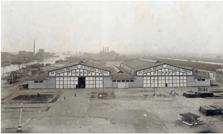
De vroegere Fokker-fabriek in Amsterdam.