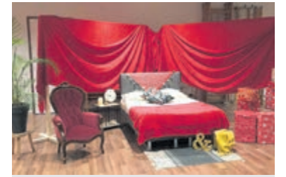
De slaapkamer van Sinterklaas.

sloten. Dit was een heel gezellige afsluiting van een geslaagde dag. Nu is alles weer omgetoverd in een fijne kerstfeest en is het team van IKC Triade alweer druk bezig met de volgende verrassing voor alle kinderen en ouders.