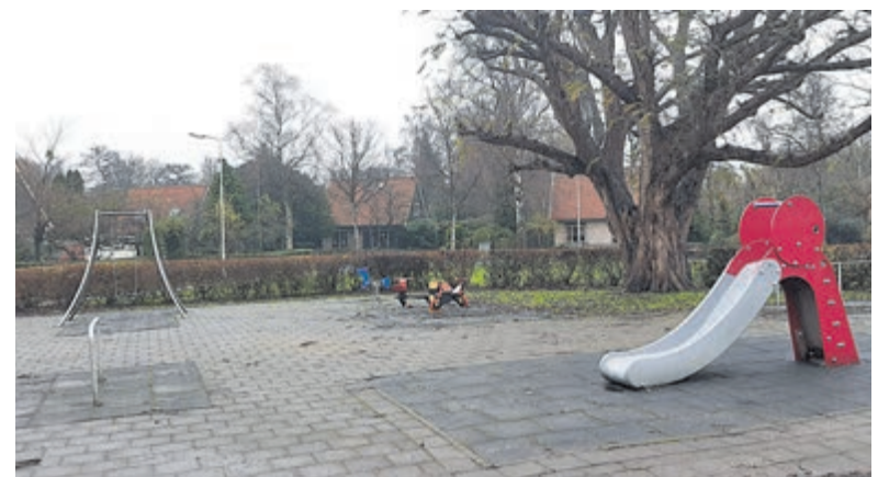
Het ietwat saaie speelterrein in de Berkenlaan gaat omgetoverd worden tot een avontuurlijk speelpark rond de mooie, oude kastanjeboom.

Tijdens de werkzaamheden wordt getracht de overlast tot een minimum te beperken. Er kan enige geluidshinder zijn en de straat zal tijdens het laden en lossen tijdelijk afgesloten zijn.