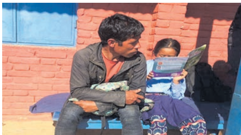
Lezen is essentieel, maar de scholen in Nepal zijn al maanden gesloten vanwege de coronapandemie.