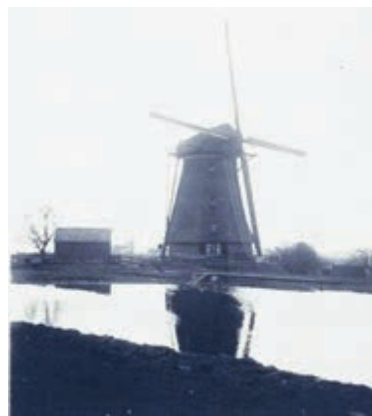
De Stommeermolen staat 100 jaar in Aalsmeer.