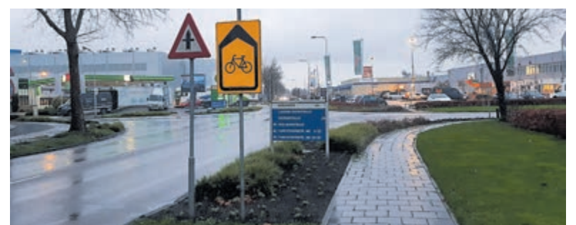
Momenteel maakt meer fietsverkeer gebruik van de Lakenblekerstraat. Dit vanwege de (tijdelijke) sluiting van het bestaande fietspad langs de Burg. Kasteleinweg.