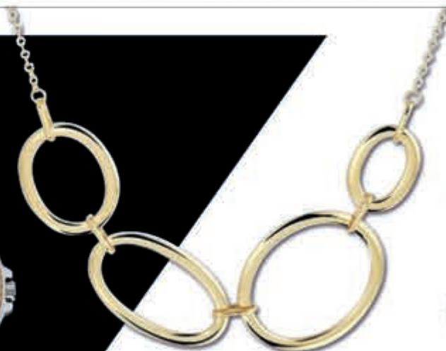
COLLIER 14K goud. Een sieraad om mee thuis te komen v.a. € 1.379,-