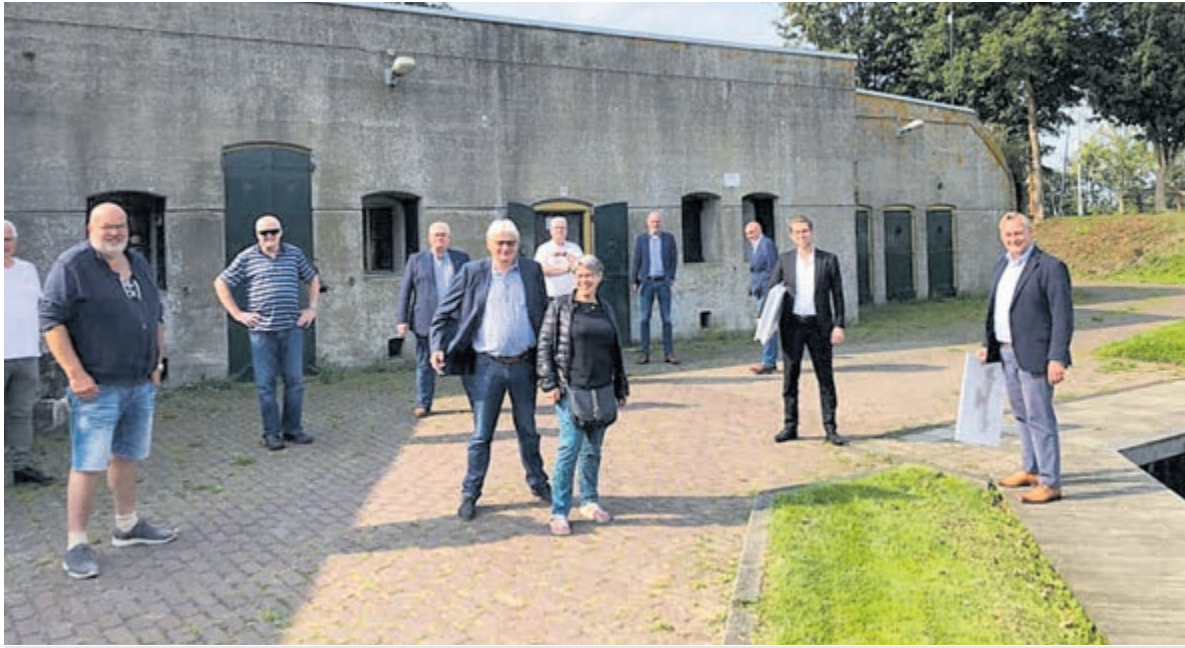
In september heeft de CDA-fractie op bezoek gebracht aan het Fort.