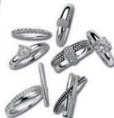
TI-SENTO DAMESRING Mix en match met de zilveren ringen van Ti-Sento v.a. € 39,-