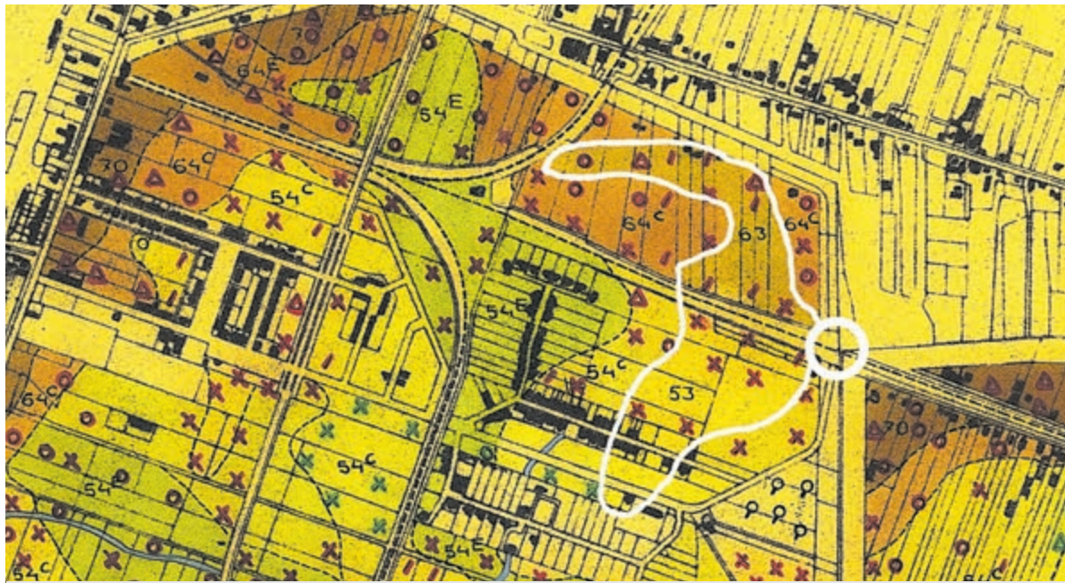
Verschiedende grondsoorten in het noordwesten van de Stommeerpolder.