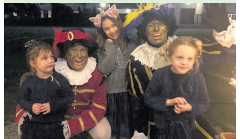
Eén groot feest tijdens het Pieten bezoek.