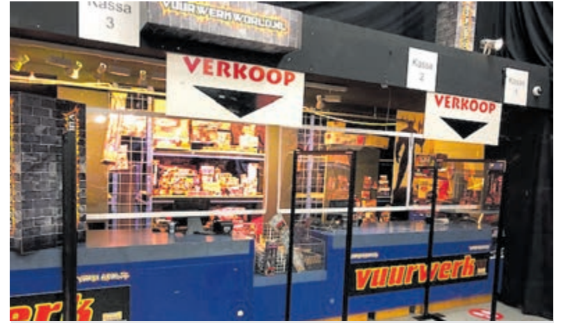
Vuurwerkworld klaar voor verkoop van categorie 1 vuurwerk.