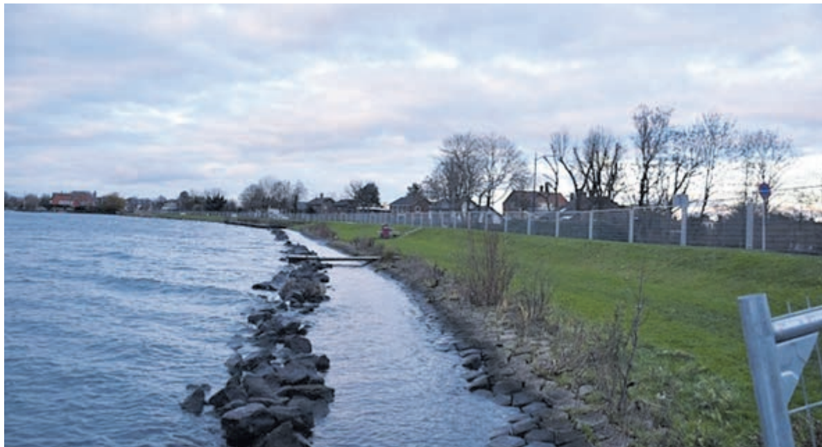
De hekken langs de Poel.