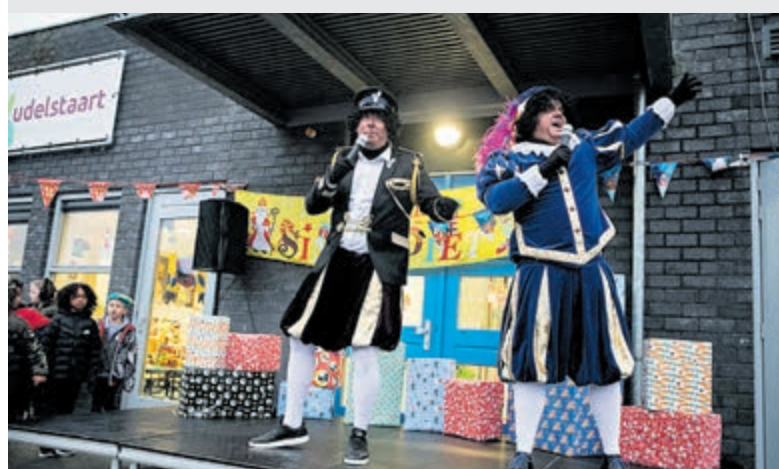
Dansen met de Pietsen op het schoolplein van OBS Kudelstaart dalton i.o.