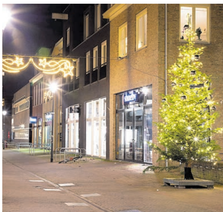
Kerstboom in het Centrum.