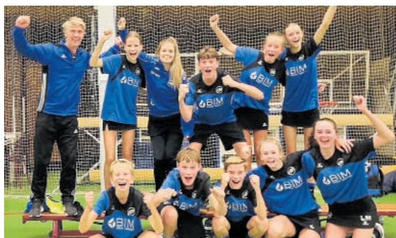
Het B2 jeugdteam van korfbalvereniging VZOD.

recreant, wilden in De Waterlelie, de thuisbasis van Oceanus, laten zien wat ze in hun mars hadden. De toeschouwers werden dan ook getraakteerd op spannende wedstrijden en het was hartverwarmend om te zien dat alle deelnemers, van de eerste tot de laatste, even hartstochtelijk werden aangemoedigd. De wedstrijdspanning zat er goed in, zeker bij de familieleden langs de rand van het bad, en de sfeer was uitstekend! Na het spectaculaire sluitstuk van de middag, de estafette, werden in de kantine van De Waterlelie de uitslagen bekend gemaakt en de nieuwe clubkampioenen beloofd. Als de clubkampioenschappen afgelopen deze zondag iets duidelijk gemaakt hebben, dan is het dat Oceanus beschikt over een ruime selectie aan uitstekende zwemmers en, minstens zo belangrijk, een goede sfeer. Ook zin gekregen om te zwemmen in clubverband? Kom gerust eens lang en train vrijblijvend een aantal keer mee. Koudwatervrees is nergens voor nodig, Oceanus is een warm bad. Informatie: www.KomZwemmenBijOceanus.nl .