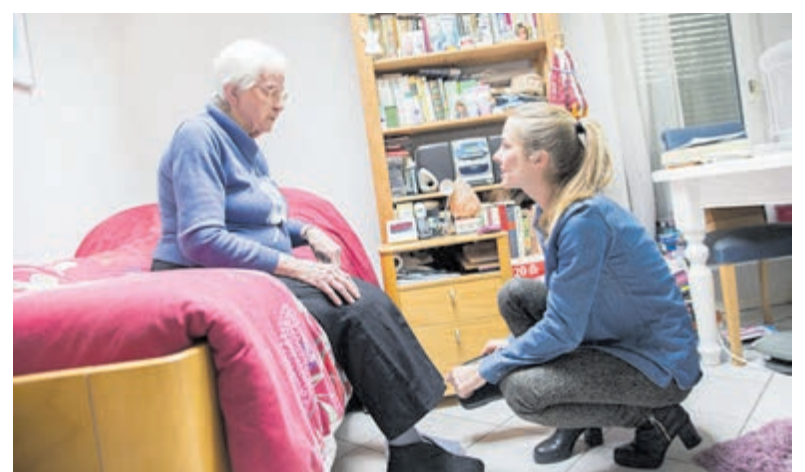
De zorg van mantelzorgers is belangrijk en waardevol.

Verkeer vanaf de Middenweg wordt omgeleid via de Braziliëlaan, Machineweg en Japanlaan naar de Legmeerdijk. Weggebruikers en omwonenden met vragen kunnen contact opnemen met het servicepunt van de provincie via telefoonnummer: 0800-0200600 of per mail: servicepunt@noord-holland.nl .