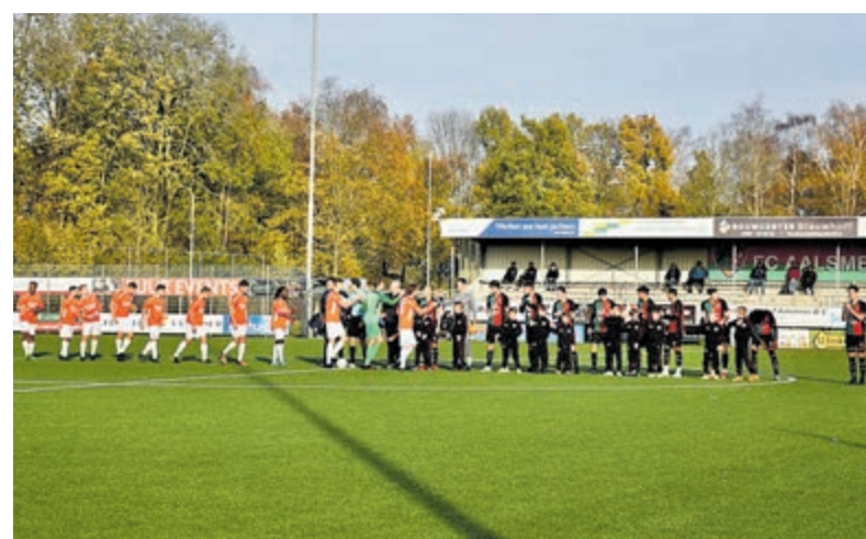
Jong en 'oud' het veld op voor de voetbalwedstrijd FC Aalsmeer tegen Alpha afgelopen zaterdag.

De dag ervoor speelde het eerste zaterdagteam van FC Aalsmeer thuis tegen Alpha. Het ruim aanwezige publiek kreeg een enerverende wedstrijd te zien met mooie kansen en scores bij beide teams. Aalsmeer zaterdag pakte uiteindelijk met 3-2 de winst.