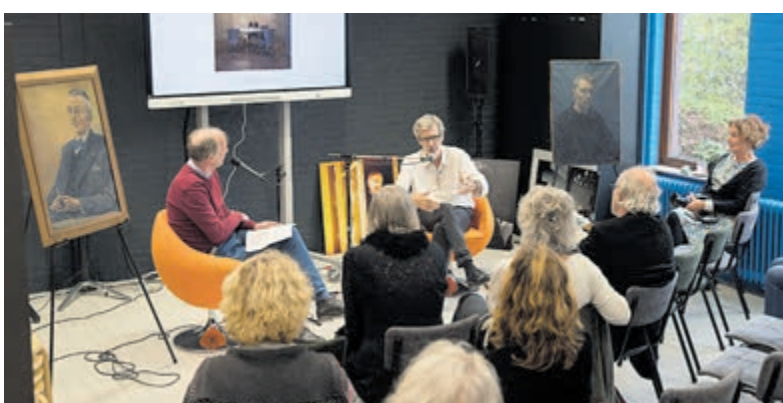
Alle aandacht voor fotograaf Wim van de Hulst.