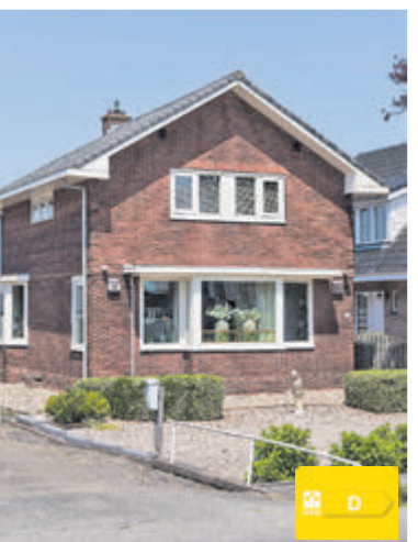
Aalsmeerderweg 181 Aalsmeer Vraagprijs €835.000,- k.k.