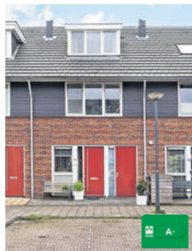
Spinradhof 30 Aalsmeer Vraagprijs € 570.000,- k.k.