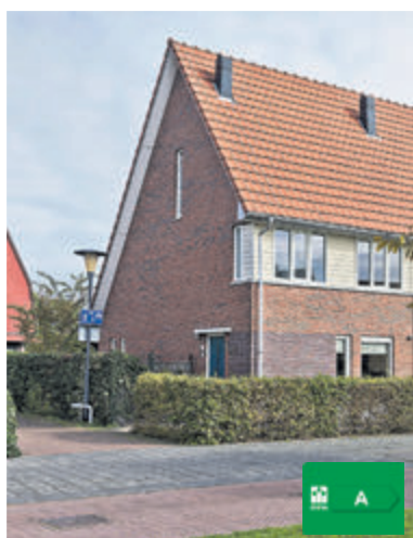
Boomgaard 67 Aalsmeer Vraagprijs € 560.000,- k.k.