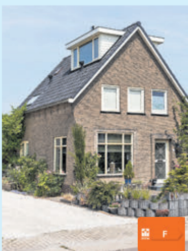
Uiterweg 324 Aalsmeer Vraagprijs € 675.000,- k.k.