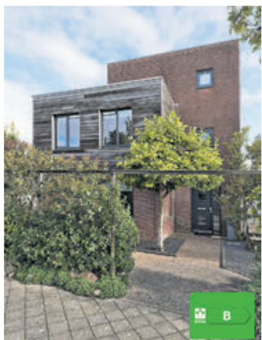
Romeijnstraat 7 Kudelstaart Vraagprijs € 675.000,- k.k.