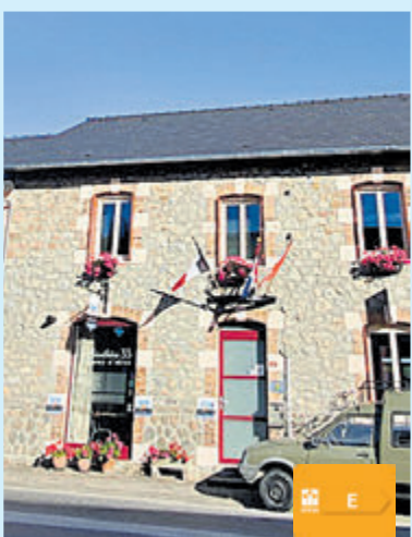
La Bouchère 33 Frankrijk Vraagprijs € 279.000,- k.k.