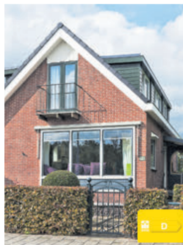
Aalsmeerderdijk 20 Oude Meer Vraagprijs € 650.000,- k.k.