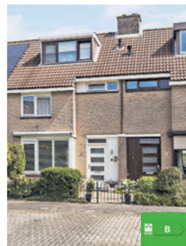
Darwinstraat 9 Aalsmeer Vraagprijs € 465.000,- k.k.