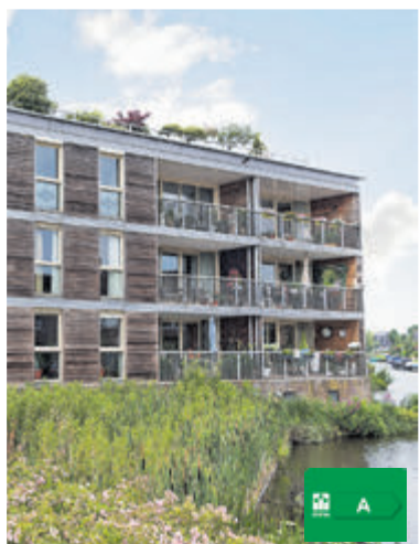
Drie Kolommenplein 93 Aalsmeer Vraagprijs € 675.000,- k.k.