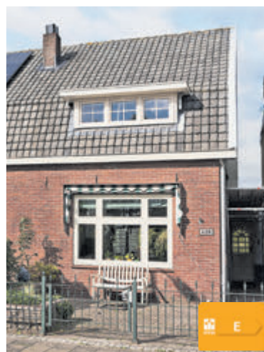
Aalsmeerderdijk 428 Aalsmeerderbrug Vraagprijs € 450.000,- k.k.