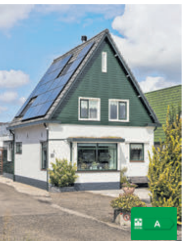
Aalsmeerderweg 281A Aalsmeer Vraagprijs € 695.000,- k.k.