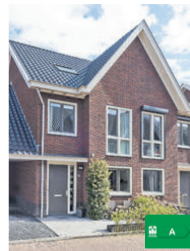
Linksbuitenstraat 15 Kudelstaart Vraagprijs € 660.000,- k.k.