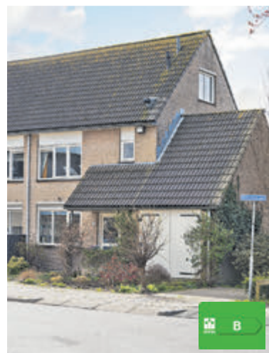
Hendrikstraat 2 Aalsmeer Vraagprijs € 579.000,- k.k.