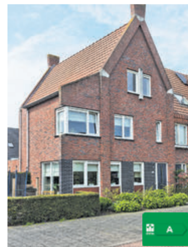
Vlinderweg 190 Aalsmeer Vraagprijs €775.000,- k.k.