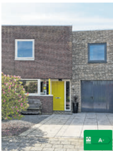
Boegstraat 5 Kudelstaart Vraagprijs € 725.000,- k.k.