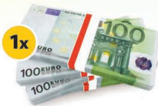
1x Geldprijs t.w.v. €2.500,-