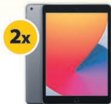
2x APPLE iPad 10.2" 32 GB WiFi- Spacegrijs t.w.v. € 389,-