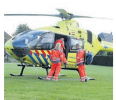
Traumahelikopter ingezet bij ongeval op Mijns herenweg.

Kudelstaart - Op donderdag 2 september is eind van de middag een scooterrijder zwaar gewond geraakt na een ongeval op de Mijns herenweg. De scooterrijder kwam ongelukkig ten val tegen een hek. Mogelijk omdat hij schrok/moest uitwijken voor een vrachtwagen. Twee ambulances en een traumahelikopter kwamen ter plaatse om het slachtoffer te behandelen. De scooterrijder is daarna per ambulance naar het ziekenhuis gebracht. De politie heeft uitgebreid onderzoek op de locatie gedaan.