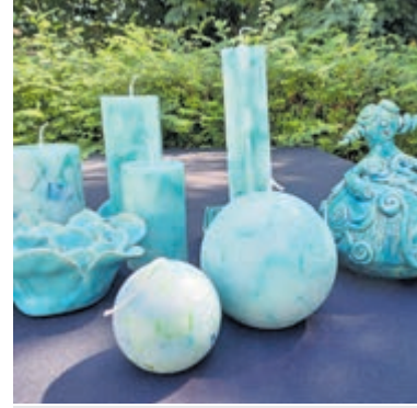
Werk van kunstenaars van Atelier Steengoed.

ties van inwoners. "Ik weet niet hoeveel borden er nog meer bijgezet moeten worden. Het staat toch duidelijk aangegeven." Grappen worden er uiteraard ook gemaakt: "Een Aalsmeerse attractie en: Kan er een toto gemaakt worden?" Allen zijn het er over eens: "Gaat nog wel vaker gebeuren, dit zal niet de laatste keer zijn."