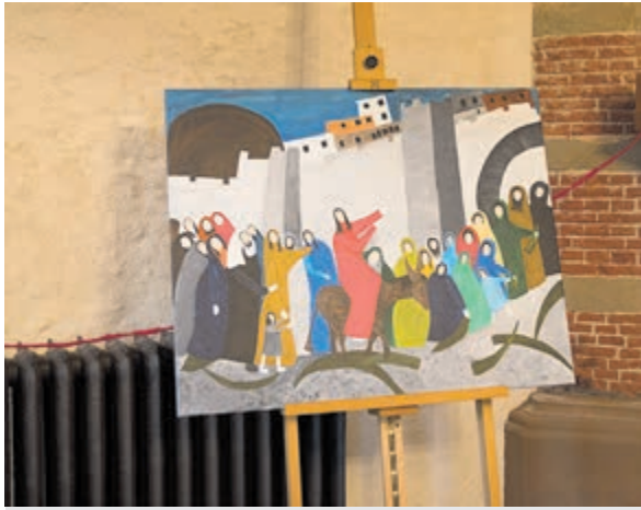
Schilderij van Wim Lodder.