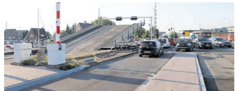
Chaos bij de Aalsmeerderbrug door storting.

spookrijden om hun bestemming te kunnen bereiken. Hierdoor ontstonden gevaarlijke situaties en lange files vanuit de richting Hoofddorp. Na ongeveer een half uur was de storting weer verholpen en konden alle wachters hun weg vervolgen.