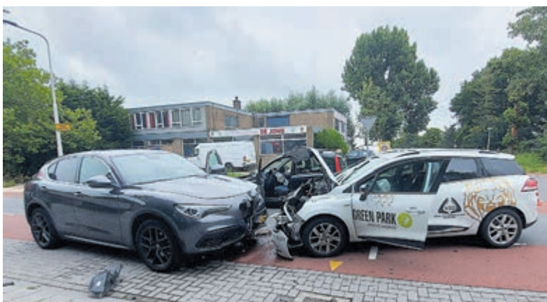
Samir Benganem ontbrak bij Aalsmeer vanwege een gekneusde pols na een auto-ongelukje op de Oosteinderweg twee dagen voor de wedstrijd. Zijn auto raakte hierbij behoorlijk beschadigd.

komer in de Belgisch-Nederlandse competitie, HV Quintus uit Kwintshoeve, op bezoek. Vanaf de aanvang pakte Aalsmeer de leiding en had