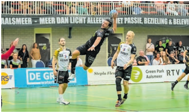
Op weg naar een doelpunt voor Aalsmeer.