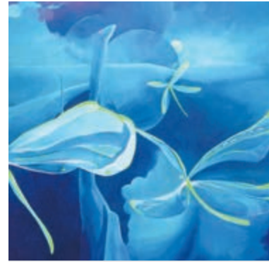
Schilderij van Maaïke van Rijn.

Aalsmeer - De voorbereidingen voor de 23e editie van de KCA Kunstroute Aalsmeer op 18 en 19 september aanstaande zijn in volle gang. Over zo'n anderhalve week kunnen bezoekers zich gedurende een heel weekend op twintig bijzondere locaties laten trakteren op veel gezelligheid en prachtige kunst van ruim negentig kunstenaars en dichters. Tijd dus om alvast een paar van hen in de schijnwerpers te zetten: kunstenaars van Art Centre Aalsmeer (nummer 19) en Atelier Steengoed (nummer 17).