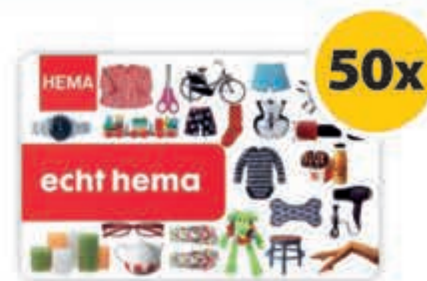
50x HEMA cadeaukaart t.w.v. €15,-

Los de puzzel op door de afgebeelde woorden in de letterbrij te zoeken en deze te omcirkelen. Als alle woorden omcirkeld zijn, blijven er nog enkele letters over die samen de oplossing van de woordzoeker vormen.