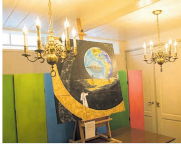
Dorpskerk geschikte tentoonstellingslocatie.