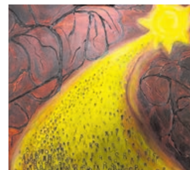
Fragment van 'De Ster van Bethlehem' van Lottie Poortvliet-Sparnaaij.

Een bijzonder onderdeel van de expositie vormen de twee bomen waarin bezoekers een wens of een aanbod van hulp kunnen bevestigen. Een boom om te geven en een boom om te ontvangen. Daarmee wil de organisatie een brug slaan tussen mensen onderling, zodat de rode draad en de boodschap van de expositie niet ophoudt bij het verlaten van het gebouw. Er wordt geen entree geheven, Passie door Kunst in de Dorpskerk aan de Kanaalstraat kan tussen zaterdag 4 en zaterdag 11 september gratis worden bezocht.