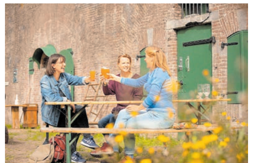
Nazomeren op een terras bij een fort.

Let op: vanwege corona moet je in de meeste gevallen vooraf reserveren. Plan je bezoek dus op tijd.