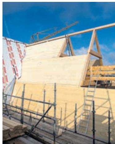
St. Urbanuskerk heeft weer een dak.

dakspanten van 14 centimeter dikke houten platen. De dakplaten variëren in grootte van 6 tot 37 vierkante meter. De spanten en de platen zijn gemaakt in Oostenrijk. In de afgelopen maanden zijn deze met vijf grote vrachtwagens naar Bovenkerk vervoerd. Daar zijn alle onderdelen in drie fases als een grote driedimensionale puzzel in elkaar gezet. Hierop wordt een isolatielaag aangebracht en dan volgen de dakleien en het loodwerk. Het dak van het schip is reeds klaar. Tegelijkertijd met het dak is er veel vooruitgang geboekt aan terugbouwen van de bakstenen gewelven. Ook hier is begonnen met het schip van de kerk. Vrijwilligers laten deze gewelven graag zien op Open Monumentendag. Intussen loopt de actie 'Maak de Urbanus Blij met een Lei' door. Voor een bedrag van minimaal 10 euro kan er online een lei worden gesignd met een persoonlijke tekst. Voor kunstenaars is er een speciale actie 'Kunst gaat