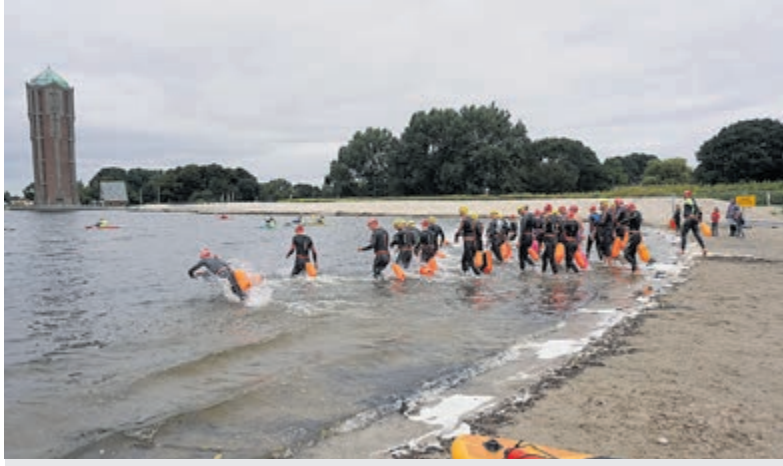
De starts van de 6 en 3 kilometer en 1500 meter bij het Surfeiland.