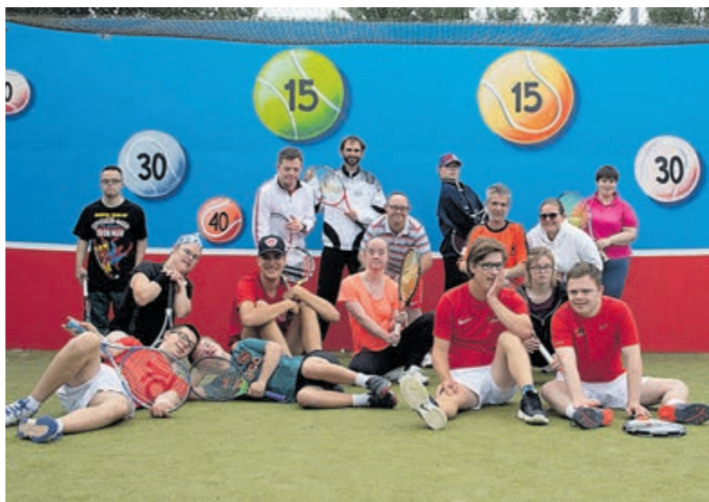
De deelnemers aan het G-tennis buddytoernooi.

technisch goed te leren dansen. Nieuwsgierig geworden? Neem dan een kijkje op de website van deze dansschool en schrijf u nu in! Elke maand worden er vrije dansavonden aangeboden voor zowel leerlingen als mensen van buitenaf die wel in zijn voor een avondje uit. Het is daarbij wel van belang om via mail of telefonisch aan te geven dat u komt dansen, want er is een maximum aantal plaatsen beschikbaar voor deze avonden (zie advertentie elders in deze krant). De volgende dansavonden zijn op 9 oktober en 6 november. Het jaar wordt op 18 december weer afgesloten met een spetterend kerstbal.