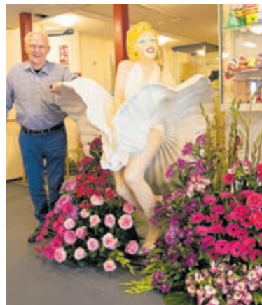
Panc op de foto met Marilyn Monroe.

feestweek genieten van meerdere optredens, onder andere van de Aalsmeers Harmonie en zangeres Tonia. Een dansje kan gemaakt worden tijdens de cursus zittansens. Bij de koffie en thee mag iets lekkers natuurlijk niet ontbreken. De bewoners genieten van alle leuke activiteiten die worden aangeboden.