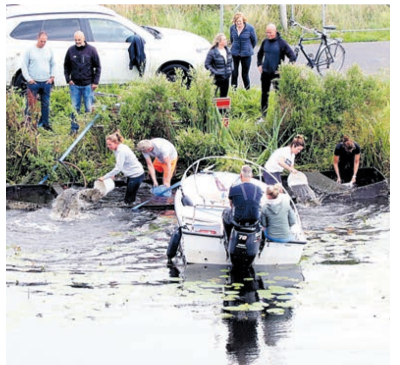
Aalsmeer - Het was een hele klus. De praam na ruim een jaar weer boven water halen om vaarklaar te maken voor de Pramenrace. Afgelopen zaterdag startte een groep met deze klus. De mannen namen de eerste zware werkzaamheden voor rekening, maar daarna was het de beurt aan de dames om te gaan hopen. Hoeveel emmertjes water er geschept zijn, is niet bekend. Wel dat het gelukt is en de praam nu ligt te drogen om volgende week zaterdag 11 september trots deel uit te kunnen maken van de tocht der tochten!

Bij alleen een nieuwe naam bleef het niet, want er hoort natuurlijk ook een nieuwe website en logo bij. Enthousiast zijn de experts van Debo Projects aan de slag gegaan met alles wat de ondernemers belangrijk vinden. Het resultaat is een frisse en moderne huisstijl met mooie kleuren. In het logo komen de ondernemers terug: winkels, horeca, dienstverlening en zorg. Van een kledingwinkel of bakker, een restaurant of hotel tot een kapsalon of notaris en een tandarts of apotheek. En allemaal zijn ze met elkaar verbonden en staat bij iedereen de klant op de eerste plaats in Aalsmeer Centrum! Ook de website is in een nieuw jasje gestoken. De ondernemers staan centraal op aalsmeercentrum.nl , het laatste nieuws en alle activiteiten zijn terug te vinden op