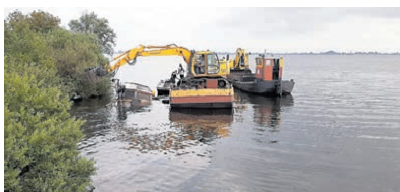
Berging van de gezonken kajuitboot door Otto.