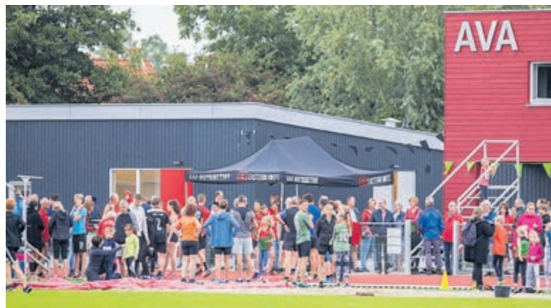
Sportieve vaders lopen hard tijdens de Zweedse estafette.

toeschouwers, die ook een kijkje kwamen nemen in AVA's nieuwe clubgebouw, dat eind 2020 vanwege corona digitaal werd geopend en nu echt gebruikt kan worden. De volledige uitslagen en meer foto's van de clubkampioenschappen zijn te vinden op www.avaalsmeer.nl .