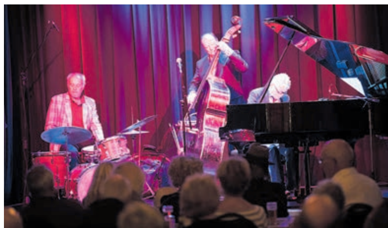
Opening seizoen met jazzweekend in Bacchus.

informatie over de bijzondere boomsoorten wordt op bordjes vermeld. Al met al een uitgelezen gelegenheid om tijdens een van de middagen in september naar de Gedichtentuin te komen. De openingsdagen nog even op een rijtje: zaterdagen 4, 11 en 18 september en de zondagen 5, 12 en 19 september, alle dagen van 12.00 tot 17.00 uur.