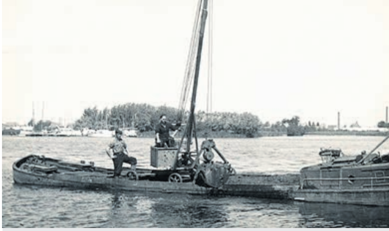
Foto van Oud Aalsmeer over waterrijk Aalsmeer.