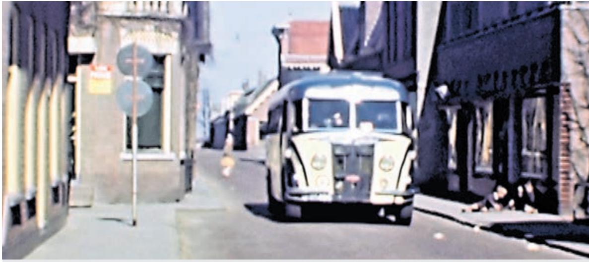
Toen er nog bussen van Maarse & Kroon door de Zijdstaat reden.