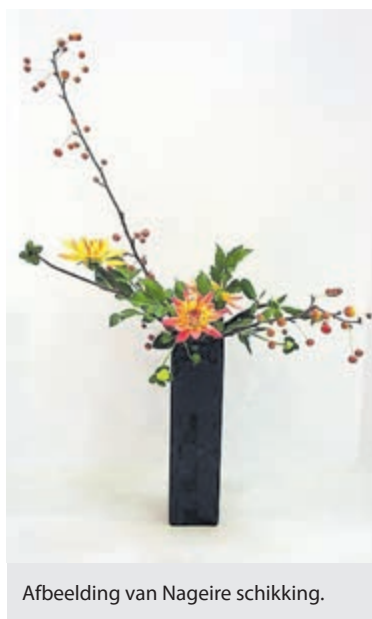
Afbeelding van Nageire schikking.

De Vlaamse kunstschilder Pieter Wagemans (1948) geeft zaterdag 21 augustus tweemaal een lezing in het museum. Wagemans mag gerust een van de topschilders op het gebied van stilleven en portretten worden genoemd. Het weergeven van bloemen combineert hij veelvuldig met mooie stoffen, zilveren gebruiksvoorwerpen en Oosterse modellen. Zo ontstaan mysterieuze en sprookjesachtige composities, tot in detail