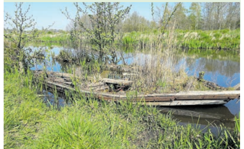
'Groene' boot bij de Molenvliet.

Ook meedoen aan de fotowedstrijd? Inzenden is mogelijk tot en met 29 augustus. Kijk voor de spelregels en prijzen op www.cultuurpuntaalsmeer.nl . De Elementen Aalsmeer is ook te volgen op Facebook en Instagram.