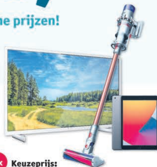
1x Keuzeprijs: Philips TV 43PFS6855/12 of Dyson V10 Absolute Oranje of Apple iPad 2020 – 32 GB t.w.v. € 369,- t.w.v. € 499,- t.w.v. € 389,-