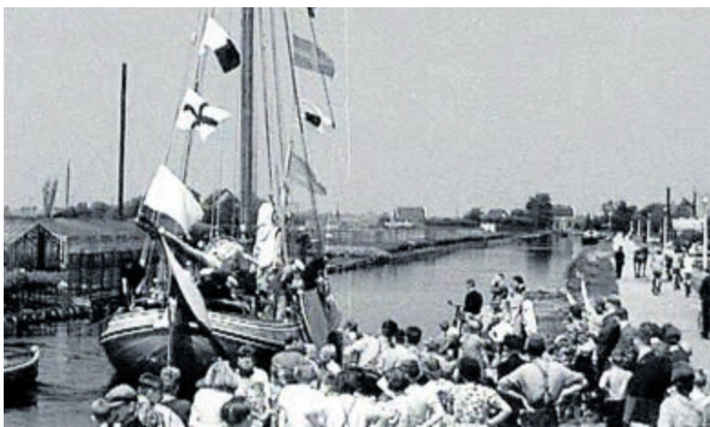
Bruidspaar per 'trekschuit' vanaf de Pontweg naar het oude Raadhuis in 1941.

Tot slot: Of er tijdens de Feestweek, dus ook op het Nostalgische Filmfestival, nog coronamaatregelen gelden, is op dit moment niet bekend. Een dezer dagen neemt het kabinet een besluit over wat wel en niet mogelijk is met betrekking tot evenementen ná 1 september. Het is niet ondenkbaar, dat bezoekers een vaccinatie- of testbewijs moeten tonen. Volgende week meer hierover.