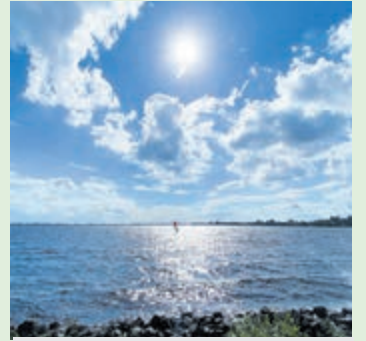
Surfer op de Westeinder.

Aalsmeer - Kunstproject De Elementen is deze zomer op meerdere manieren in Aalsmeer te volgen. Onderdeel is een fotowedstrijd met als thema de vier klassieke elementen: aarde, lucht, vuur en water. In deze rubriek worden wekelijks één of twee inzendingen geplaatst. Truce Waaijman fotografeerde een opmerkelijk tafereel aan de Molenvliet: een boot die onder invloed van de elementen is overgenomen door de natuur. Paul Lechner richtte zijn blik op de onmetelijke Westeinderplassen en zag daar een windsurfer in zijn element, gevangen in het zonlicht.