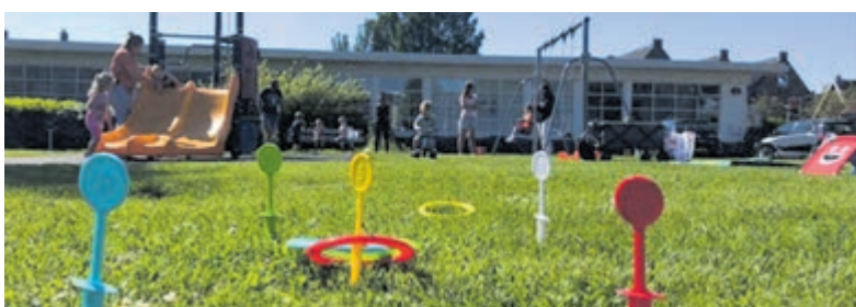
Esther Sparnaaij in gesprek met Marit de Ridder over speeltuin in de Clematisstraat.

daarmee komt het begin van de bouw in zicht. Nog 25.000 euro is nodig voor de speeltuin. Er is een loterij georganiseerd waarmee er prijzen bij lokale ondernemers gewonnen kunnen worden. De verkoop loopt tot en met 4 september. Wil jij dit project steunen en lootjes kopen? Luister naar de