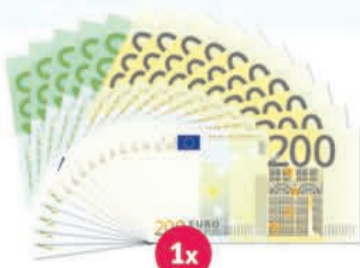
1x Hoofdprijs € 2.500,-