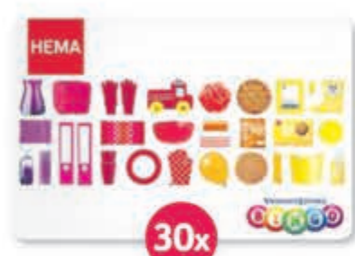
30x Hema Cadeaukaart t.w.v. € 25,-

Of één van de andere fantastische prijzen!