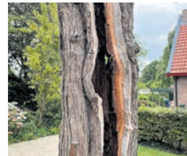
Gespleten boom in Wilgenlaan.

Het kan dus wel, behouden en kortwieken. Ook zo benieuwd wat het uiteindelijke resultaat zal zijn?!