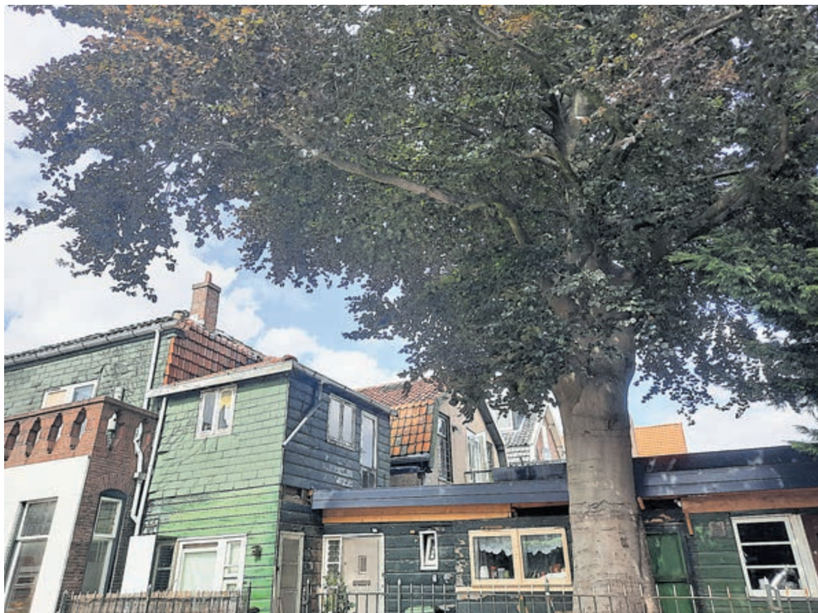
De rode beuk in de Schoolstraat. Samen met het huis vormt de boom al zo'n 100 jaar een karakteristiek plekje op het hoekje met de Dorpsstraat. Helaas denken de nieuwe eigenaren hier anders over. Er is een kapvergunning aangevraagd.