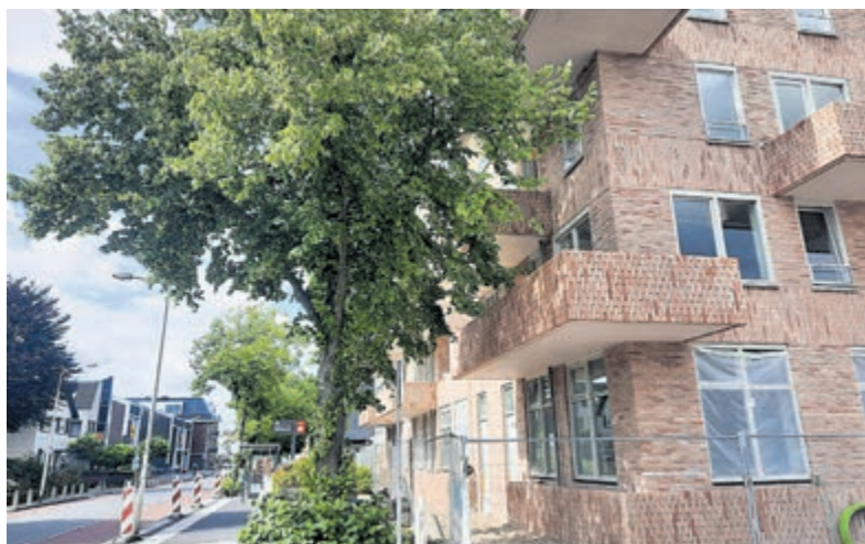
Boom Stationsweg pal naast de nieuwbouw: Geprobeerd wordt de boom te sparen.

Boom Stationsweg Mazzel dat ie wel op gemeentegrond staat heeft de boom bij de nieuwbouw aan de Stationsweg. De nieuwe bewoners krijgen uitzicht op