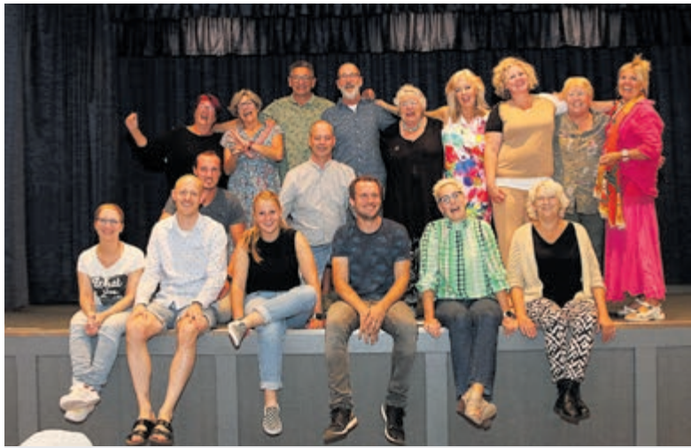
Het team van Toneelvereniging Kudelstaart

De naam van deze revue is 'Waar de wind ons brengt'. De sketches gaan dit keer half Europa door! Het publiek wordt meegenomen van de Zaanse Schans tot aan Schotland, beland met elkaar in de skilift, zingt Franse chansons en ziet een doldwaze bonte avond op de camping. En herinnert u zich de komische type-