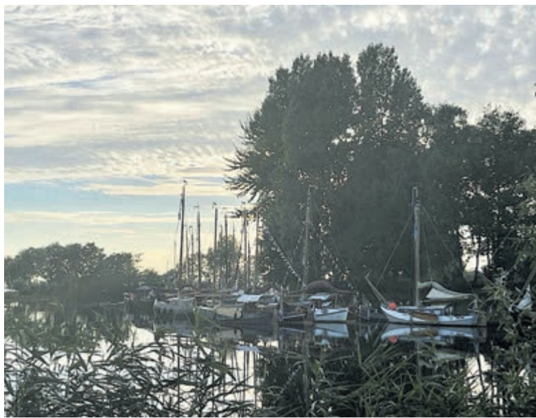
Rond- en platbodemjachten bij Fort Kudelstaart.

De rond- en platbodemjachten komen dit jaar nog weer terug in het