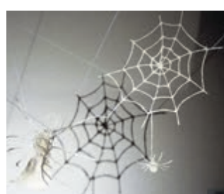
Spinnenweb van handgeschept papier door Lenie Voortman.

Beide tentoonstellingen lopen tot en met 29 september en zijn vanaf heden elke vrijdag, zaterdag en zondag te bezoeken van 11.00 tot 17.00 uur. De entree is 5,50 euro, kinderen tot en met 14 jaar gratis en Museumkaarthouders krijgen 50% korting. Groepen kunnen op afspraak een rondleiding boeken, ook doordeweeks of 's avonds. Meer informatie: www.flowerartmuseum.nl . Het museum bevindt zich aan de Kudelstaartweg 1, tegenover de watertoren.