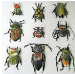
Kevers van straataval van Sandra Westgeest.

De andere tentoonstelling, 'Bees, bugs & butterflies', toont de creatieve uitspattingen van elf verschillende kunstenaars. Deze tentoonstelling is meer dan alleen mooie plaatjes en objecten, maar is ook een boodschap. Door insecten letterlijk in de schijnwerper te zetten vragen de kunstenaars aandacht voor de 'kleine helden' van de natuur, die on-