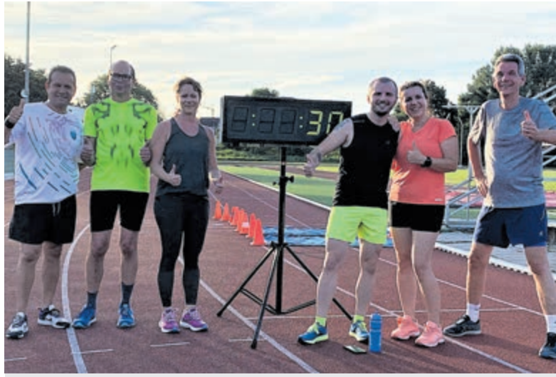
Groep van HilverdaFlorist deed enthousiast mee aan de Baanloop.

Veel tijd om na te dromen over de mooie dag heeft Nils niet. In de drie volgende overgangsronden rijdt hij met een stekende zon op zijn rug over een irritant golvende parcours vol druipend asfalt. Klussen voor kopman Romain Bardet en op tijd aan de streep komen, is dan het enige wat telt. Maar in de eerste Pyreneeënrit van afgelopen dinsdag sluipt hij ook verrassend mee in de vlucht van de dag. Pas na 145 kilometer op de top van de eerste klim zien de favorieten van de Tour hem terug. Nils heeft dan al als winnaar van de tussensprint heel sneaky punten en prijzengeld afgesnoept van Wout van Aert. Het is zijn eerste 'overwinning' in de Tour de France. Voor wat het waard is natuurlijk. Wout van Aert is in zijn groene trui niet echt gelukkig met de actie van het brutaaltje uit Rijsenhout, maar de tv-commentatoren genieten van zijn anarchistische move. Nils komt heel knap als 57ste aan de streep in Foix in een groepje met Mollema en Van Baarle. Weer een rit gestript. Zo gaat-ie goed. Of zijn de laatste bergen te hoog voor Nils Eekhoff?