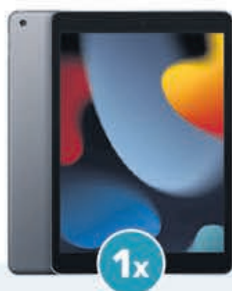
Apple iPad t.w.v. € 389,-

Of één van de andere fantastische prijzen!