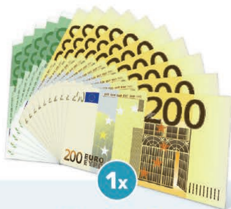
Hoofdprijs € 2.500,-