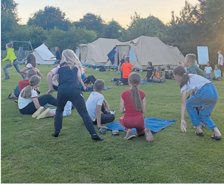
Levend bingo als avondprogramma tijdens het Bindingkamp in Stadskanaal.