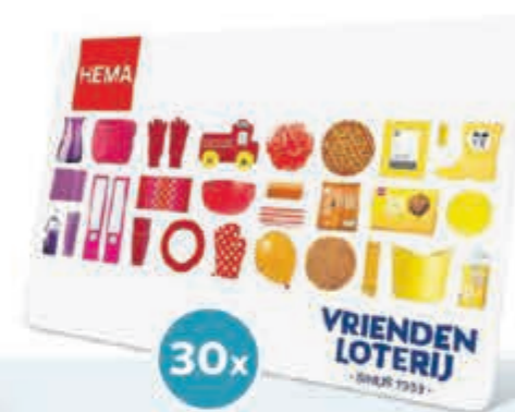
Hema Cadeaukaart t.w.v. € 25,-