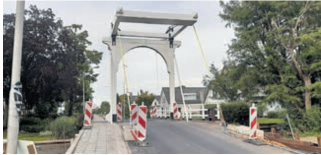
Afrondende werkzaamheden bij replica Aardbeienbrug op de Uiterweg.