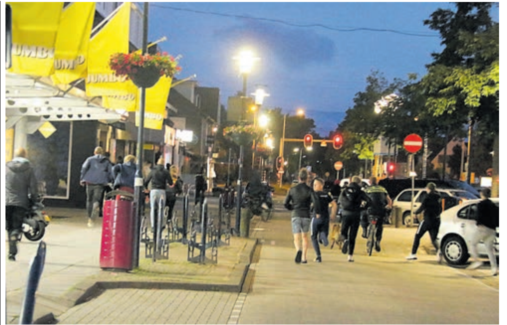
Veel jongeren op straat tijdens de achtervolging en uiteindelijke aanhouding vorige week maandag in de Ophelialaan.

Tijdens de nachtperiode gelden er op Schiphol hogere start- en landingstarieven, zeker voor de meest lawaaïge toestellen. Naast minder vluchten tussen 23.00 uur 's avonds en 07.00 uur 's ochtends, werken Schiphol en Lucht- verkeersleiding Nederland (LVNL) samen aan optimalisatie van het baangebruik en de nachtelijke vliegroutes en -procedures, om de hinder te beperken. Zo zijn er 's nachts maar één startbaan en één landingsbaan in gebruik. Dit zijn meestal de Polderbaan en Kaagbaan. Naar de banen die open zijn, gelden vaste vertrek- en naderingsroutes die de vliegtuigen zoveel mogelijk om woonkernen heen leiden. Ook maken vliegtuigen gebruik van gelijkmatig dalend naderen, waarbij er minder motorvermogen gebruikt wordt. Bovendien zijn er negen nieuwe maatregelen voor hinderbeperking in de nacht opgenomen in het uitvoeringsplan hinderreductie van LVNL en Schiphol. Lees meer over de hinderbeperkende maatregelen in de nacht op www.minderhinderschiphol.nl .