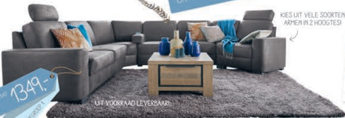
Elementenbank Modo in Microleder Bull, H86x837x2x292cm zoals afgebeeld excl. luxe opties 1899,-. Bijpassende hoofdsteun vanaf 85,-. Bijzettafel Robusto in Acaciahout kleur Vintage Grey, B73xL73cm 249,-.

KIES UIT VELE SOORTEN ARMEN IN 2 HOOGTES!