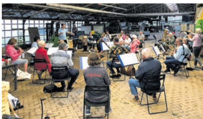
Erste gezamenlijke repetitie Aalsmeers Harmonie na 4 maanden.

Aalsmeer - Na maanden van fysieke afwezigheid zijn de leden van Aalsmeers Harmonie tijdens een repetitieavond op 7 juli weer bij elkaar gekomen. Niet zoals gebruikelijk in hun repetitielokaal in 't Baken, maar bij één van de leden thuis op de kwekerij.