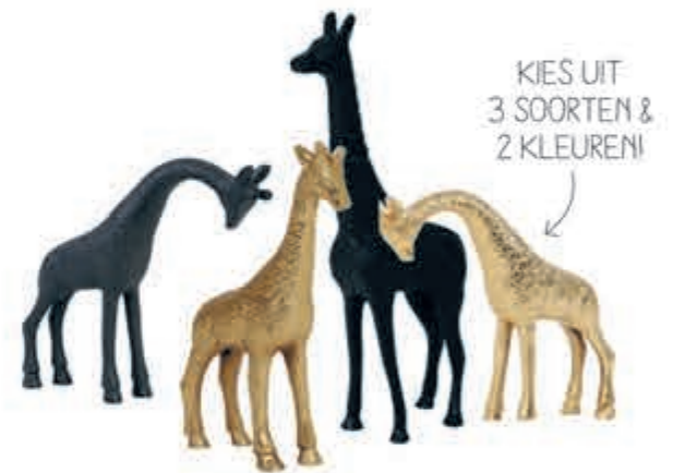
Ornament Jirafa in 3 soorten & 2 kleuren. Per stuk vanaf 24,95.

ROBUSTO IS EEN COMPLEET WOONPROGRAMMA IN ACACIAHOUT IN DE KLEUR VINTAGE GREY. UIT VOORRAAD LEVERBAAR!