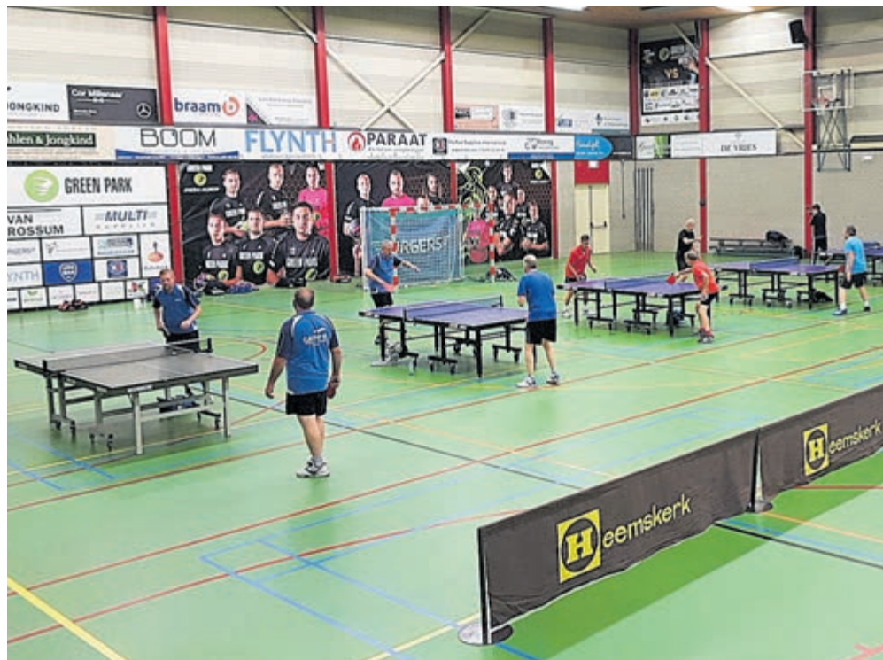
Sporthal Bloemhof biedt royaal ruimte aan de spelers met 6 tafels op grote afstand van elkaar.

De (vrije) tafeltennisavond is iedere woensdag van 20.00 tot 22.00 uur in sporthal De Bloemhof aan de Hornweg.