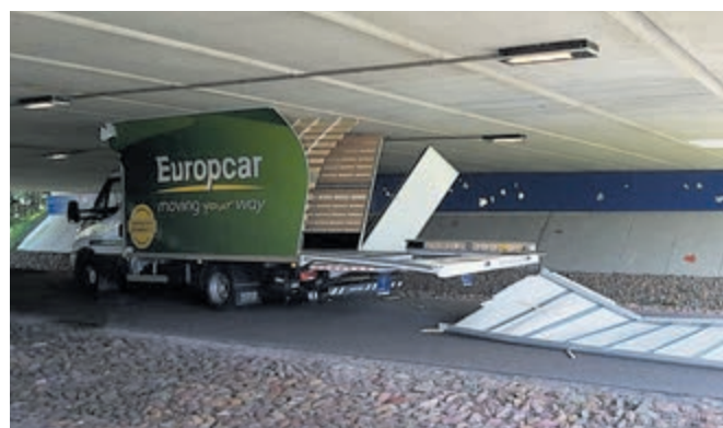
Behoorlijke schade aan de klem gereden vrachtwagen.

gehaald, echter de koeling was een blokje te hoog. Dit ongeval gebeurde rond drie uur in de middag en was vrij snel opgelost. Banden leeg laten lopen en bestelbus los trekken. Een uur later bleek meer tijd nodig om de klemrijder te 'bevrijden' uit het viaduct, dat hard op weg is een nummer één notering te krijgen in de lijst met meeste ongevallen. Veelal zonder letsel, maar de schade is meestal groot. De chauffeur van het vrachtwagentje dat rond vier uur de hoogte van het viaduct of van zijn wagen verkeerd inschatte, is misschien afgeleid door de versmaling, heeft zeker de borden niet opgemerkt en had waarschijnlijk een behoorlijke snelheid. De vrachtwagen is ver het viaduct ingekomen... De schade aan de laadbak is enorm. Tja, en dat op een 'gewone' maandag, maar wel de 13e juli!