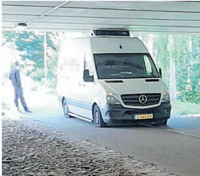
Vergeten dat de bestelbus voorzien was van een koelinstallatie.

Bij alle wegwerkzaamheden kunnen onvoorziene omstandigheden roet in het eten gooien waardoor het werk moet worden uitgesteld naar een later moment. Bijvoorbeeld als het lange tijd voortdurend hard regent. Asfalteren is dan niet verstandig omdat de kwaliteit van het resultaat onvoldoende zal zijn.