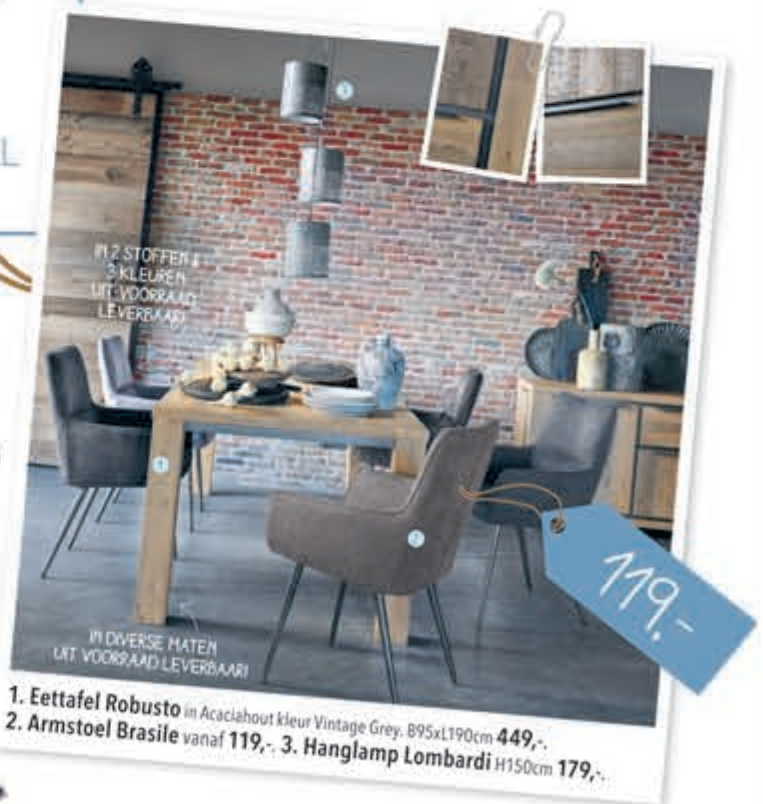
1. Eettafel Robusto in Acaciahout kleur Vintage Grey, B95xL190cm 449,-. 2. Armstoel Brasile vanaf 119,-. 3. Hanglamp Lombardi H150cm 179,-.