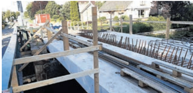
Betonnen brugdek van Barendeburg geplaatst.

Om weer over de Barendeburg te mogen en kunnen rijden, is nog even geduld nodig. De renovatie verloopt gestaag en volgens planning. Afgelopen donderdag 9 juli is het nieuwe betonnen brugdek geplaatst. Dankzij deze verzorging staat niets meer in de weg om de hamei na jaren en jaren te herplaatsen. De nieuwe brug kan nu deze bovenbouw dragen. Er gaan geruchten dat er in deze een 'kink in de kabel' is gekomen waardoor de karakteristieke uitstraling van de Barendeburg nog even op zich laat wachten, maar beloofd is beloofd, aldus de gemeente: De hamei komt terug op de brug. Vooralsnog zijn de werkzaamheden nog in volle gang en wacht het naastgelegen voetgangersbruggetje op een opknappbeurt. De planning is afronding medio augustus.