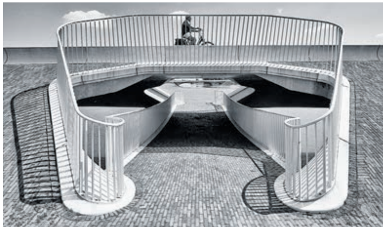
Eerste plaats categorie zwart-wit: Adrie Kraan met 'Fietsbrug'.