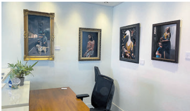
Een deel van de expositie bij Eveleens Makelaars.