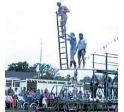
Het Oosterbad eind jaren tachtig.