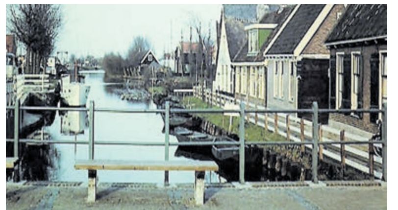
Oud Aalsmeer anno jaren vijftig. Links de Van Cleeffkade, rechts het Molenpad waar nu het Raadhuis(plein) is.