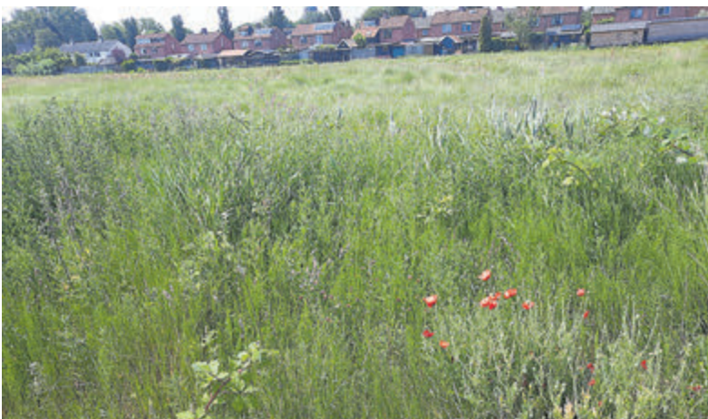
Het nog braakliggende terrein achter de Brandweerkazerne aan de Zwarteweg. Hier wil de gemeente circa 135 appartementen en 20 woningen bouwen.

zaterdag als zondag ook een geluksmoment, want het was tropisch warm. Toch kijken zowel alle deelnemers als bezoekers terug op een bijzonder Geluksweekend. Reken er maar op dat volgend jaar weer een Geluksroute georganiseerd gaat worden in Aalsmeer.