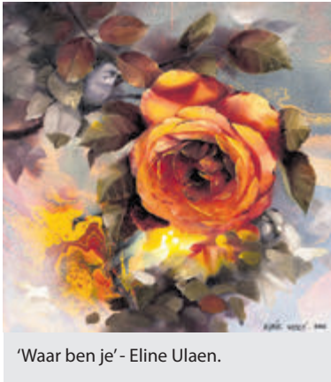
'Waar ben je' - Eline Ulaen.