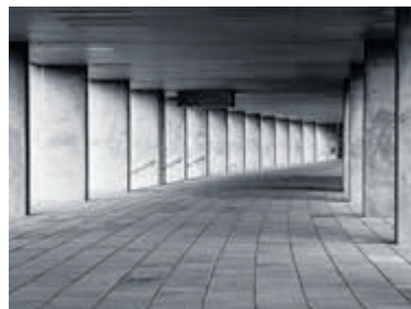
Eerste plaats categorie zwart-wit: 'Viaduct Rotterdam' van Margot Aartman.

Alle ingezonden foto's zullen tentoongesteld worden in de bibliotheek in de Marktstraat 19. Deze expositie zal worden geopend op 24 juni en is te bezichtigen tot eind augustus. De prijsuitreiking was tevens de afsluiting van het seizoen. Op 4 september start de fotogroep met het nieuwe seizoen in een nieuwe locatie: Cultuurpunt Aalsmeer in De Oude Veiling. Een interessante agenda is samengesteld voor dit seizoen met een aantal uitdagende fotografische opdrachten, boeiende lezingen en leuke fototrips. Belangstelling? Kijk voor meer informatie op www.fotogroepaalsmeer.nl .