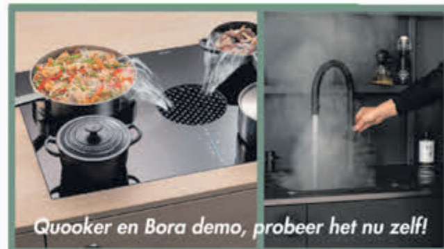
Quooker en Bora demo, probeer het nu zelf!