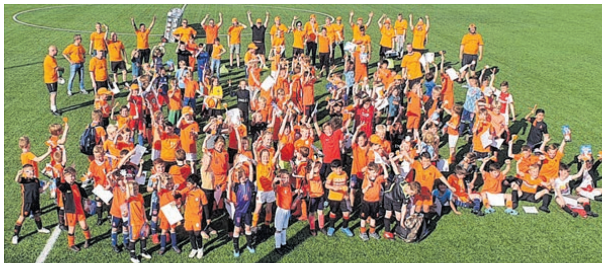
Voetballers op het Oranjefestival.

Buitenspeeldag is voor jeugd van de basisschool uit de groepen 3 tot en met 8. Inschrijven kan alleen via www.noordhollandactief.nl . Voor informatie kan een mail gestuurd worden naar René Romeijn: rromeijn@teamsport-service.nl of neem telefonisch contact op via 06-53129683.