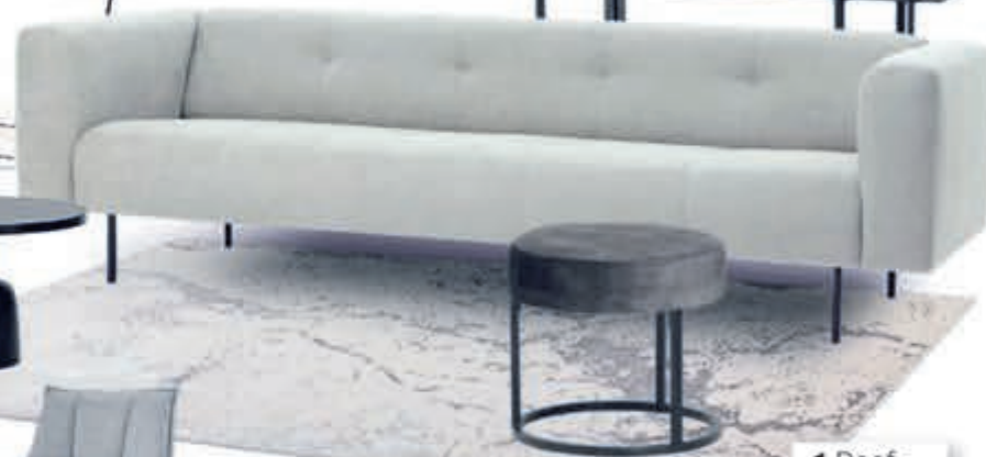
▲ Vloerkleed SOLAR v.a. 119,-