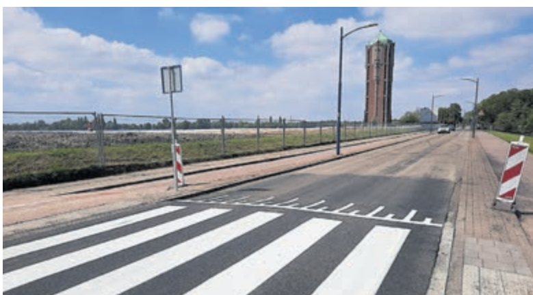
Op de Kudelstaartseweg zijn twee zebrapaden aangelegd.

De trailerhelling aan de Stomerweg is tot en met 15 september gesloten voor particulieren. De helling is in die periode exclusief voor gebruik door de brandweer van Aalsmeer. Het in het water leggen of uit het water halen van boten zorgde in het verleden in het drukke vaarseizoen regelmatig voor gevaarlijke situaties. Het Waterfront is mede tot stand gekomen met (financiële) bijdragen van de Stichting Leefomgeving Schiphol en het Hoogheemraadschap van Rijnland.