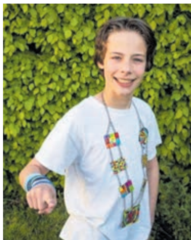
Kinderburgemeester Julius zoekt jou!

Kinderen die in Aalsmeer of Kudelstaart wonen en volgend schooljaar, dus schooljaar 2021-2022, in groep 7 of 8 zitten, kunnen zich kandidaat stellen voor de functie van kinderburgemeester. Maak een filmpje van maximaal een minuut en vertel wat jij belangrijk vindt voor kinderen in Aalsmeer en waarom jij kinderburgemeester zou moeten worden. Vermeld daarbij je naam, je leeftijd, op welke basisschool en in welke klas