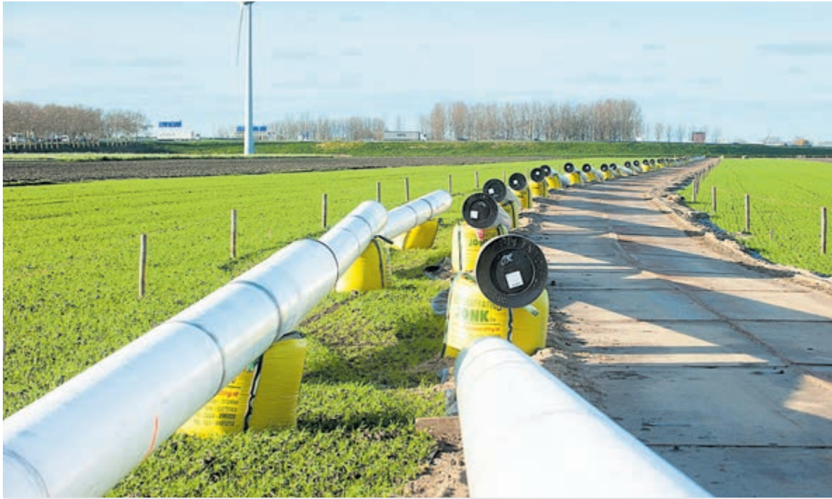
Aanleg leiding in glastuinbouwgebied PrimA4a.