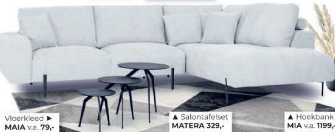
Vloerkleed ► MAIA v.a. 79,-