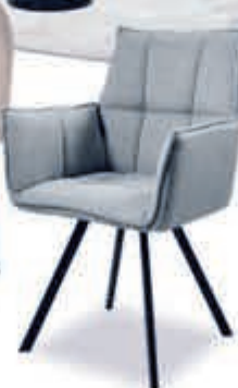
▲ Eetstoel MARIO 99,-