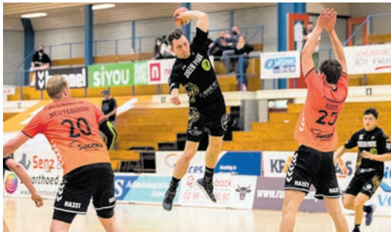
Een fraaie aanval van Greenpark Aalsmeer in Volendam.