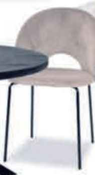
▲ Eetstoel PIA 99,-