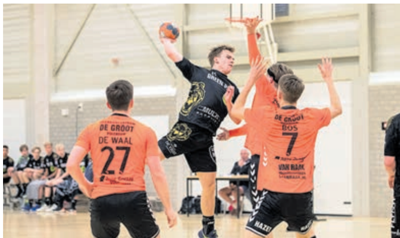
Geen winst voor Heren 2 van Greenpark Aalsmeer.

was een geduchte tegenstander, maar uiteindelijk pakte Aalsmeer de winst met 23 punten tegen 20 voor Volendam. Aalsmeer liet zich in de eerste minuten enigszins overrompelen door Volendam en kwam op een 5-2 achterstand. Het ietwat slordige spel werd gecorrigeerd en al snel wist Greenpark op gelijke hoogte te komen. Het bleef lang een gelijk opgaande strijd en de rust werd ingegaan met één puntje meer