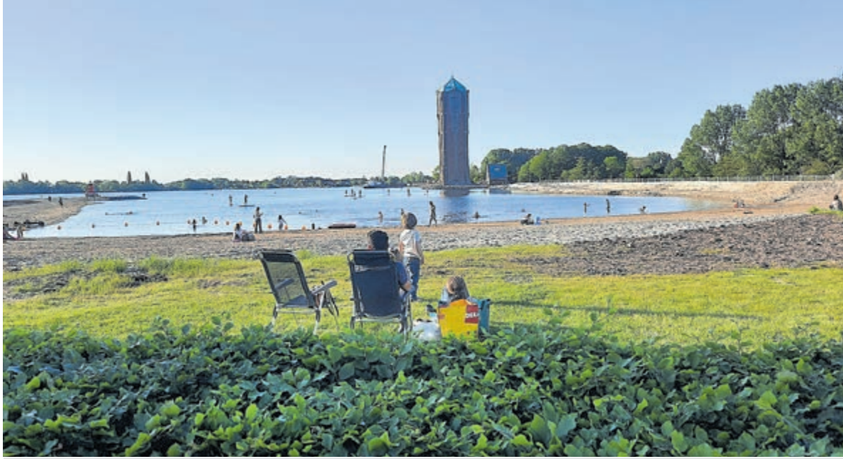
Gelijk vanaf de opening op 1 juni was het gezellig druk op het Surfeiland.