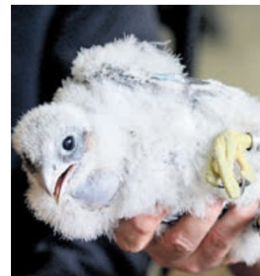
Het ringen van de twee jonge slechtvalken.

gefilmd. De beelden zullen gebruikt worden in een natuurdocumentaire, die momenteel in opdracht van de gemeente Aalsmeer gemaakt wordt.