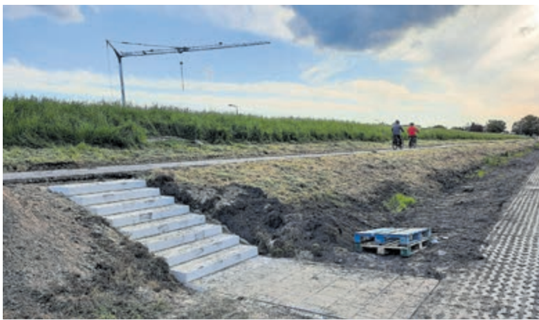
Parkeerplaatsen langs de Bachlaan met trappetjes naar wandel-/fietspad.

Aalsmeer - Een flink deel van het Waterfront, ten zuiden van de watertoren (Surfeiland en verlengde landtong), is open voor het zomerseizoen. Net op tijd voor het stralende weer van deze week zijn de hekken weggehaald. Om iedereen zoveel mogelijk te laten genieten, is een aantal maatregelen getroffen. Geen parkeeroverlast, geen lawaai en geen rotzooi op het strand: Als iedereen een beetje z'n best doet, wordt het een mooie zomer! Lekker wandelen langs de waterlijn, liggen op het strand, of zwemmen en spelen in het water. Het nieuwe Waterfront nodigt uit om bij mooi weer met veel mensen te genieten van de Westeinderplassen. De gemeente roept daarom iedereen op om zoveel mogelijk op de fiets of te voet richting het Waterfront te komen. Er zijn veel fietsenstallingen en er is een voorziening voor het opladen van elektrische fietsen.