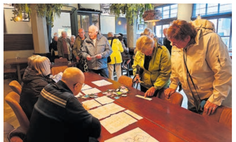
Loopbriefjes ophalen voor de Bridge Kroegentocht.