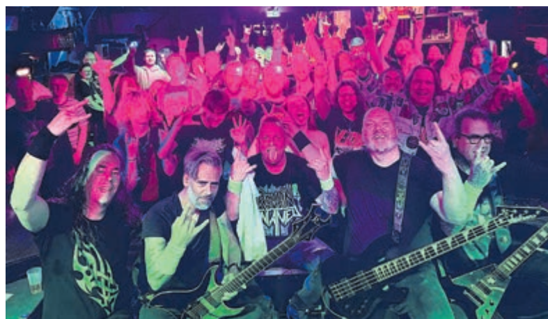
De metalband Remain Untamed.