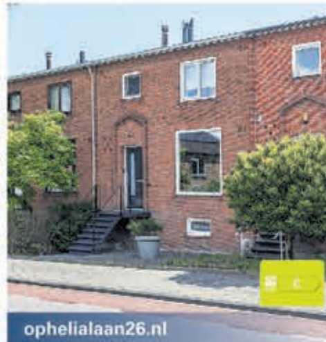
ophelialaan26.nl Ophelialaan 26 Aalsmeer Vraagprijs € 595.000,- k.k.