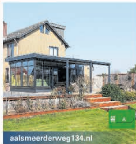
aalsmeerderweg134.nl Aalsmeerderweg 134 Aalsmeer Vraagprijs € 975.000,- k.k.

Binnenkort te koop: geschakeld woonhuis met grote schuur nabij centrum Aalsmeer