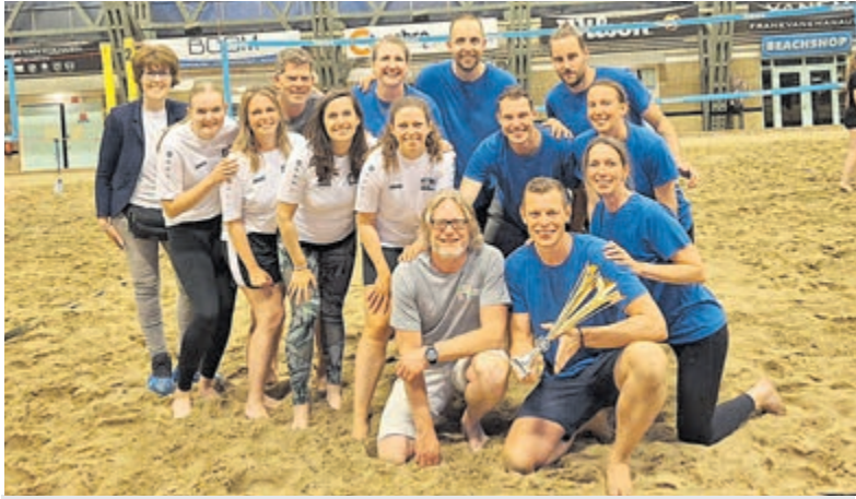
Het winnende team van KC de Ruimte viert de overwinning na een zinderende finale in The Beach.