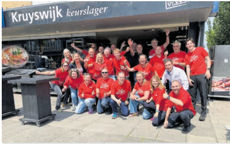
Team Hollander klaar voor vertrek.