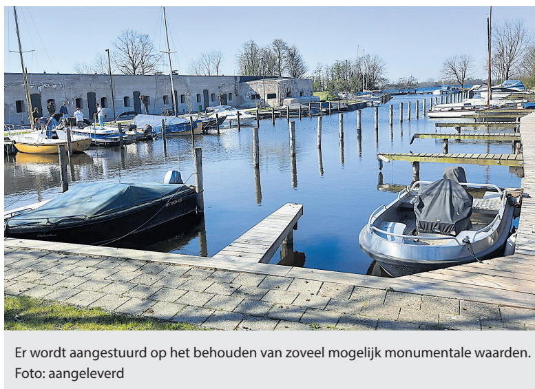
Er wordt aangestuurd op het behouden van zoveel mogelijk monumentale waarden.

Bij de verkoop wordt een eenmalig bedrag van 981.000 euro beschikbaar gesteld voor het wegwerken van het achterstallig onderhoud en het terugbrengen van het zandpakket op het dak. Over de uitvoe-