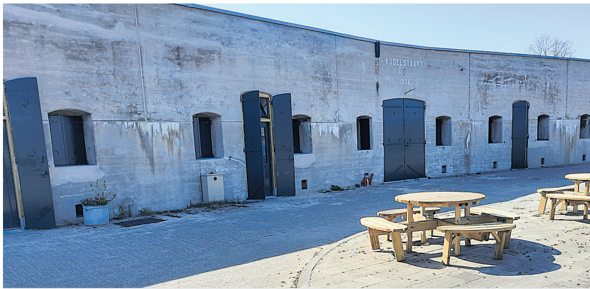
De meerderheid van de fracties heeft ingestemd met de verkoop van Fort Kudelstaart.