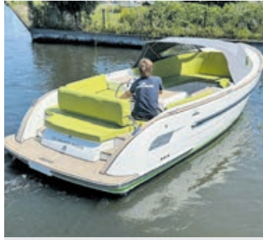
De Antaris Sixty 7, te zien bij Jachthaven Poelgeest.

combineren het klassieke sloepmodel met alle moderne gemakken voor heerlijke vaartochten. Zo zijn deze topmodellen onder andere voorzien van boegschroef, koelkast, toilet en ideale doorloop naar het zwempleateau. De boten van Antaris en Maril onderscheiden zich al jaren door sublieme vaareigenschappen, verfijnde afwerking en design. Van het merk Maxima is de uitgebreide collectie outboard tenders te bewonderen. Nieuw dit jaar is het optionele doorgestoken roer dat de vaareigenschappen aanzienlijk verbeterd. Een innovatie van Poelgeest die nu ook door de importeur is overgenomen. Naast scherpe aanbieding voor diverse nieuwe boten is er een leuk