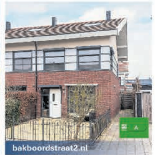
bakboordstraat2.nl Bakboordstraat 2 Kudelstaart Vraagprijs € 535.000,- k.k.