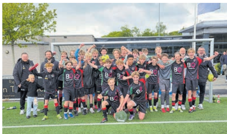
De kampioenen JO14 van voetbalvereniging FC Aalsmeer.