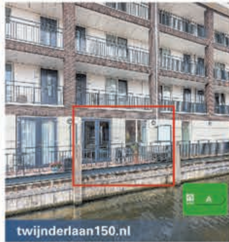
twijnderlaan150.nl Twijnderlaan 150 Aalsmeer Vraagprijs € 410.000,- k.k.