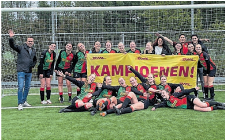
De meiden MO20-1 en staf vieren het behaalde kampioenschap.