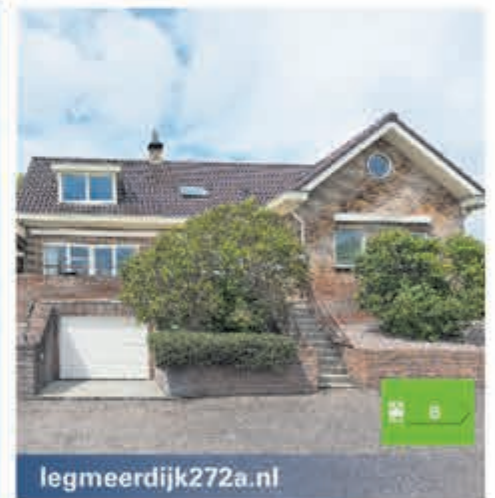
legmeerdijk272a.nl Legmeerdijk 272a Aalsmeer Vraagprijs € 1.195.000,- k.k.