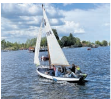
Scouting Tiflo present tijdens de wedstrijden om de 'Kaagcup'.

Aalsmeer - Elk Hemelvaartweekend strijden bijna 300 zeilboten tegen elkaar om de 'Kaagcup'. Twee dagen waarop er door de deelnemers wedstrijden gezeild worden op de Kagerplassen. De meeste deelnemers komen uit de regio Zuid-Holland maar ook Scoutinggroepen uit de rest van het land weten de Kaag te vinden.