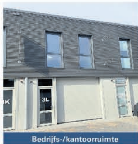
Bedrijfs-/kantoorruimte Zuid-Afrikaweg 3L Aalsmeer Huurprijs € 1.350,- per maand Per direct beschikbaar