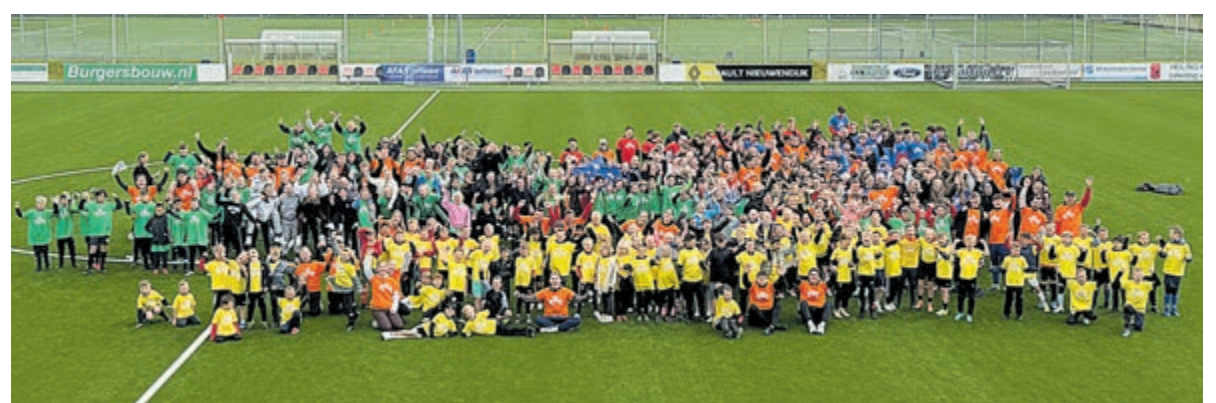
Deelnemers en begeleiders voetbalkamp bij RKDES.

gezorgd: er gingen dit weekend 175 broden en 95 kilo aan patat doorheen. Een bedankje aan de smeerploeg die hebben gesmeerd, en natuurlijk ook aan de ouders die hebben gereden en uiteraard niet te vergeten, de bakploeg! RKDES is heel blij met alle sponsoring die wordt gegeven! Maar natuurlijk ook met alle hulp van de 80 leiders, 23 rode draken (spelbegeleiders) en 9 kampstaf leden. Super bedankt iedereen! Er wordt teruggekeken op een fantastisch voetbalkamp.