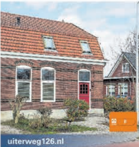
uiterweg126.nl Uiterweg 126 Aalsmeer Vraagprijs € 585.000,- k.k.