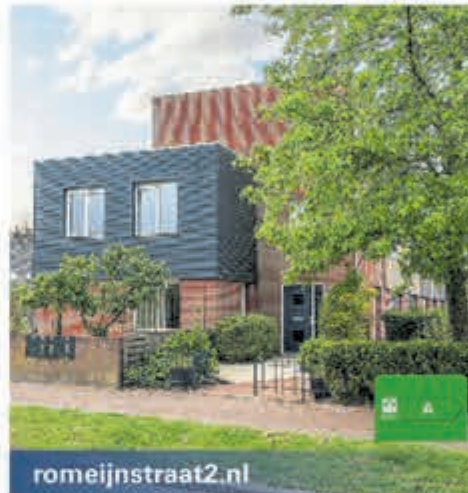
romeijnstraat2.nl Romeijnstraat 2 Kudelstaart Vraagprijs € 665.000,- k.k.