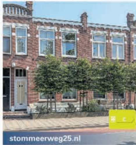
stommeerweg25.nl Stommeerweg 25 Aalsmeer Vraagprijs € 465.000,- k.k.