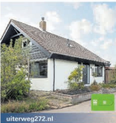
uiterweg272.nl Uiterweg 272 Aalsmeer Vraagprijs € 1.850.000,- k.k.