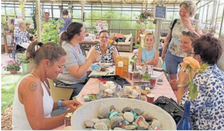
Gezelligheid troef tijdens de voorbereiding van de Geluksroute.