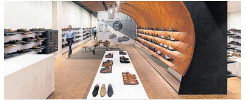
Schoenen van Zwartjes zijn van duurzame kwaliteit en tijdloos.

voorwerp bij het hotel en hierop was massaal gereageerd door de politie. Begrijpelijk natuurlijk gezien de situaties rond asielzoekers en statushouders elders in het land. Het bleek gelukkig loos alarm. Alle linten werden weer verwijderd en de politie verliet het Centrum. Er wordt nog wel nader onderzoek gedaan naar dit 'incident'.