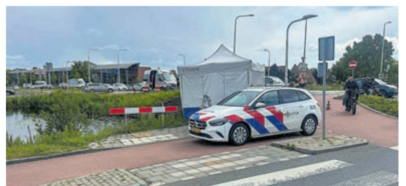
Onderzoek door de hulpdiensten na vondst van een overleden persoon in het water tussen de Stommeerkade en Oosteinderweg.

verdrongen persoon is een 35-jarige man uit Slowakije. Hij was als vermist opgegeven. De politie gaat er vanuit dat de doodsoorzaak een ongeval is geweest. Er wordt niet gedacht aan een misdrijf. Inwoners die getuigen zijn geweest of meer informatie hebben, worden gevraagd contact op te nemen met de politie via 0900-8844.