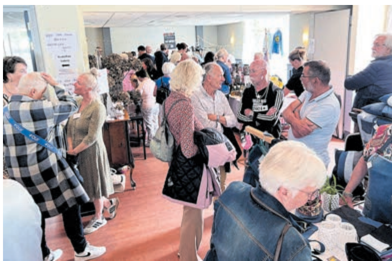
Gezelligheid troef tijdens de eerste KudelFair in 't Dorpshuis.

geleidster of leren een tof scrapboek wordt gemaakt. Ruim veertig kleine of grote creatievelingen in diensten, ambacht, eten en/of drinken laten graag zien waar ze goed in zijn en wat hun passie is. Alle ruimtes in het Dorpshuis gaan zich vullen met onder andere sieraden, kaas, paling, worst, houtwerk, kunst, kaarten, zalm, koekjes, gelukspoppetjes en nog heel veel meer! De geur van zeep en chocolade, de glans van keramiek en vazen en de kleuren van stoffen en schilderijen; bij de kramen/(sta)tafels kan kennis gemaakt worden met echte lokale producten. De kraampjes gaan buiten door en hier komen enkele verrassende foodtrucks te staan, onder andere met ijs, suikerspinnen en hartige hapjes. De kinderen kunnen ondertussen lekker buiten of binnen spelen met de spellen, het springkussen of als ze dat leuk vinden; geschminkt worden. Net als vorig jaar wordt ook weer een loterij gehouden waar vele prijzen, voor een deel gedoneerd door de lokale creatievelingen en ondernemers, te winnen zijn. De toegang is gratis. Dorpshuis 't Podium aan de Kudelstaartseweg opent zondag 7 juni om 11.00 uur haar deuren en bezoekers zijn welkom tot 16.00 uur.