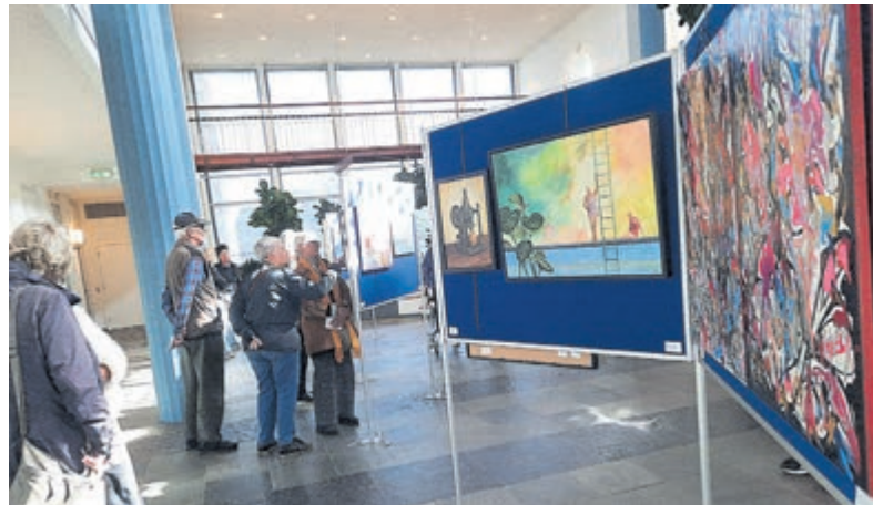
Zowel de makers als kijkers waren vertegenwoordigd tijdens de feestelijke opening van de manifestatie Amazing Amateurs.