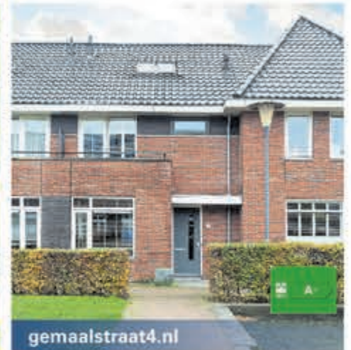
gemaalstraat4.nl Gemaalstraat 4 Aalsmeer Vraagprijs € 685.000,- k.k.

Binnenkort te koop: vrijstaand woonhuis met mogelijkheden aan de Aalsmeerderweg