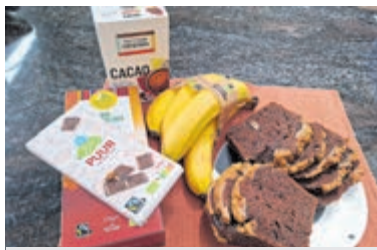
Fairtrade producten.

team Fairtrade Gemeente Aalsmeer en met de plaatselijke wereldwinkel. De titel Fairtrade Kerk wordt steeds voor drie jaar verlengd, mits de kerk aan bepaalde criteria voldoet, daarna dient het opnieuw te worden aangevraagd. Deze week vernam de Doopsgezinde Gemeente dat de titel weer voor 3 jaar verlengd is, tot en met 2028. Het is best jammer dat er niet meer Fairtrade Kerken in Aalsmeer zijn, het is niet ingewikkeld om de titel aan te vragen. Op internet is alle informatie te vinden en anders wil de fairtrade commissie van de Doopsgezinde Gemeente wel helpen. Want uiteindelijk gaat het