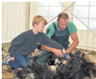
Schaapscheerfeest bij kinderboerderij Boerenvreugd.

zowel dinsdag als woensdag routes door nieuwe(re) buurten gelopen. Vandaag, donderdag 21 mei, is alweer de laatste dag. De start en finish is dit keer vanaf de parkeerplaatsen van de scholen in de Zonnedauwlaan in Kudelstaart. De deelnemers aan de 10 kilometer starten om 18.00 uur en de (grootste) groep die 5 kilometer gaat wandelen mag gaan stappen vanaf 18.30 uur. De deelnemers hopen na afloop op een feestelijk onthaal door vrienden, familie, burens, etc. Maar na de 'huldiging' mogen de beentjes omhoog en mag bijgekomen worden van vier dagen wandelen, gezelligheid, saamhorigheid en niet te vergeten: veel kletsen en (gezond) snoepen!