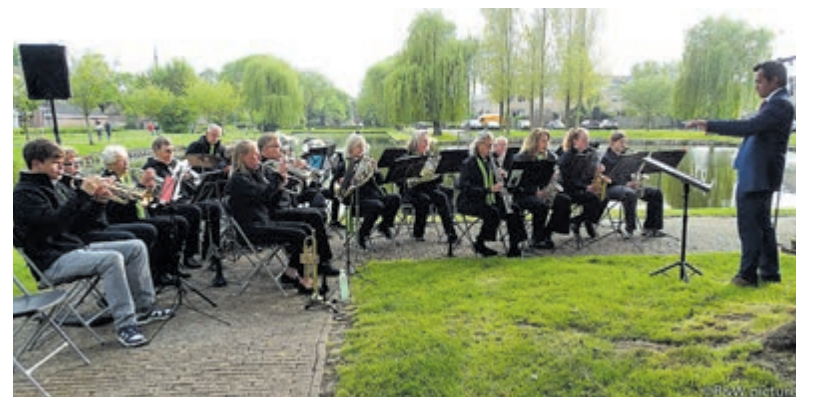
Muziekvereniging Flora tijdens een buitenconcert.

classes voor componisten uit de film- en gamemuziek en organiseert hij filmmuziek concerten voor zowel amateur- als professionele orkesten. Tijdens deze middag kan onder andere geluisterd worden naar een African Symphonie, een selectie uit 'Ja Zuster Nee Zuster' en 'Baron van Dedem'. Het concert wordt gegeven in het clubgebouw aan de Wim Kandreef 1 in Kudelstaart waar de deuren vanaf 15.00 uur open gaan. De muzikanten betreden vervolgens om 15.30 uur het podium. De toegang is gratis. Voor meer informatie kan een kijkje genomen worden op de site van Flora: www.muziekverenigingflora.com .