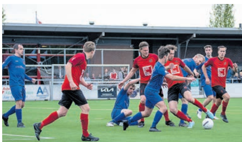
Voetbalwedstrijd RKDES tegen SCW.

ploegen bleven hard werken, de strijd was voelbaar bij ook het vele publiek langs het veld. Een kwartier voor tijd was het opnieuw Mano die nu RKDES op winst knalde: 2-1. En dit werd tevens de eindstand. In feeststemming vertrokken de voetballers en hun aanhang terug naar Kudelstaart. Aanstane zaterdag 23 mei is het eerste elftal vrij, het einde van de competitie nadert, maar voetbal kijken aan de Wim Kandreef is mogelijk van 9.00 tot 14.30 uur, maar liefst negen jeugdteams van RKDES spelen thuis. Een aanrader: RKDES 023-1 tegen Legmeervogels 023-1 om 14.30 uur Meer info: www.rkdes.nl .