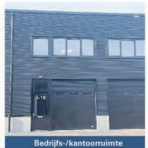
Bedrijfs-/kantoorruimte Burg. Hoffscholteweg 3-018 Aalsmeer Huurprijs € 1.450,- per maand Per direct beschikbaar