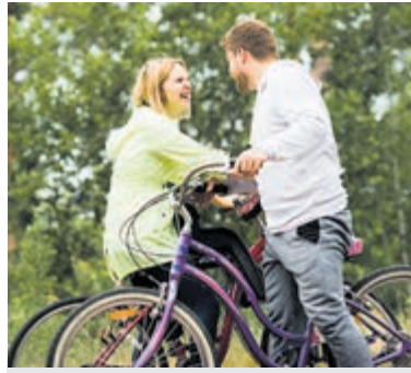
Foto ter illustratie in verband met de privacy van de cliënte en de begeleider (gemeente Aalsmeer).

"Jongeren komen bij ons terecht via verschillende routes, bijvoorbeeld via het Sociaal Loket, het Sociaal team,