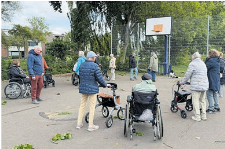
Deelnemers rollator wandelclub op pad.

Rijsenhout Dorpshuis Rijsenhout Werf 2 Plus Werf 15