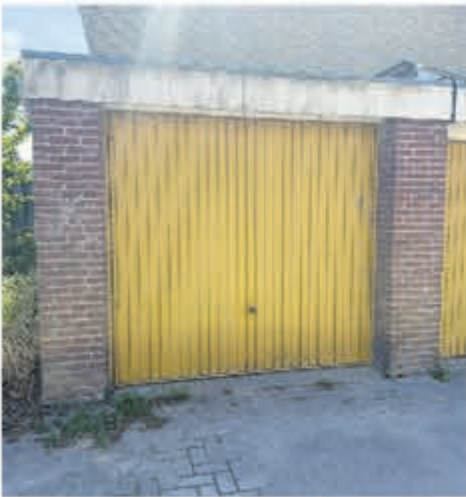
Haydnstraat 1A Aalsmeer Huurprijs € 175,- per maand Garage/berging