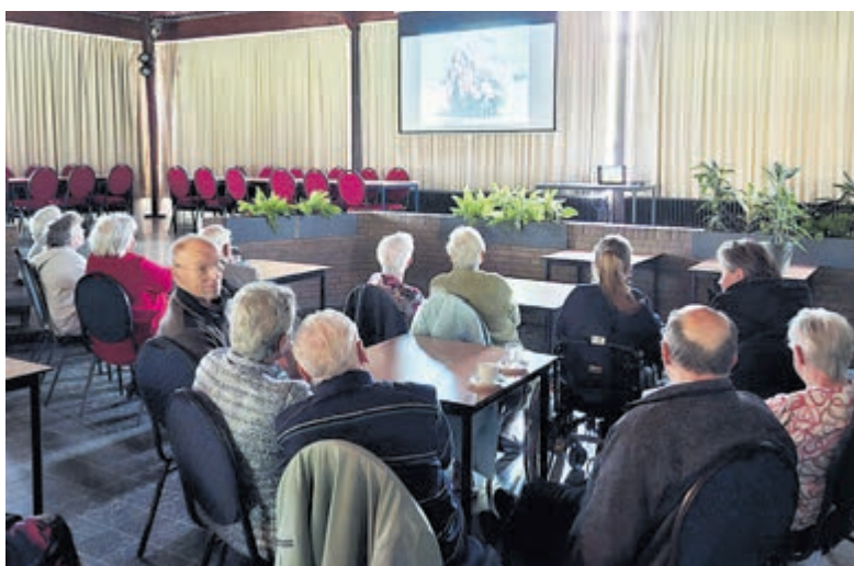
Boeiende reis door nostalgisch Aalsmeer in Buurthuis.

het Buurthuis Hornmeer. Voor veel bezoekers was het prachtig om te zien hoe deze plek door de jaren heen is uitgegroeid tot het hart van de buurt. Ook kwamen bijzondere verhalen voorbij over onder meer de korte en lange Zijdstraat, waar veel aanwezigen nog nooit van hadden gehoord. Daarnaast passeerden de kolenhaven bij de Nieuwe Meer, de oude Stommeerkade en De Drie Kolommen de revue. Juist deze onbekende stukjes geschiedenis maakten de middag extra interessant. Het publiek luisterde aandachtig en reageerde enthousiast op de vele beelden en verhalen. Regelmatig werd er gelachen, gewezen naar bekende gezichten of druk nagepraat over hoe het vroeger was. Het was een gezellige, nostalgische zondagmiddag.