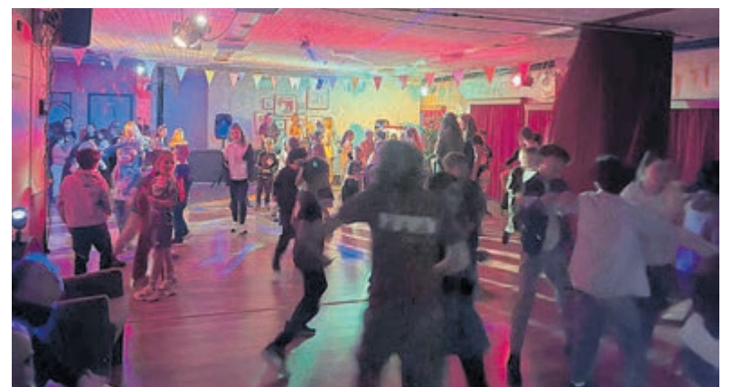
Disco- en bingofeest voor kinderen in het Middelpunt.

geen voorrang dreigde te krijgen. Het was een dagje met veel plezier maar het was wel hard werken in de boot met harde wind en de daarbij belemmerende regenbuiten tussendoor! De uitslagen van de wedstrijden van vrijdag bepaalden de veld indelingen voor zaterdag. Vol goede moed stonden de leden van Tiflo zaterdagmorgen op. Er wordt deze dag altijd 1 langere route gezeild, afhankelijk van de wind bepaalt de wedstrijdleiding welke dit zal zijn. Het werd de route met de beruchte 'boei P' en dus een pittige klus. 's Avonds vond op het Boterhuis eiland de prijsuitreiking plaats. Helaas geen prijzen dit jaar voor Tiflo, maar wel hele mooie resultaten waar de leden trots op mogen zijn! De jongens en meisjes kijken allemaal terug op een heel gezellig weekend! Op zondag gingen zij weer door weer en wind terug richting Aalsmeer. Lijkt zeilen en andere gezellige opkomsten meemaken met leeftijdsgenoten jou ook leuk? Meer info op de website van de scoutinggroep: www.tiflo.nl .