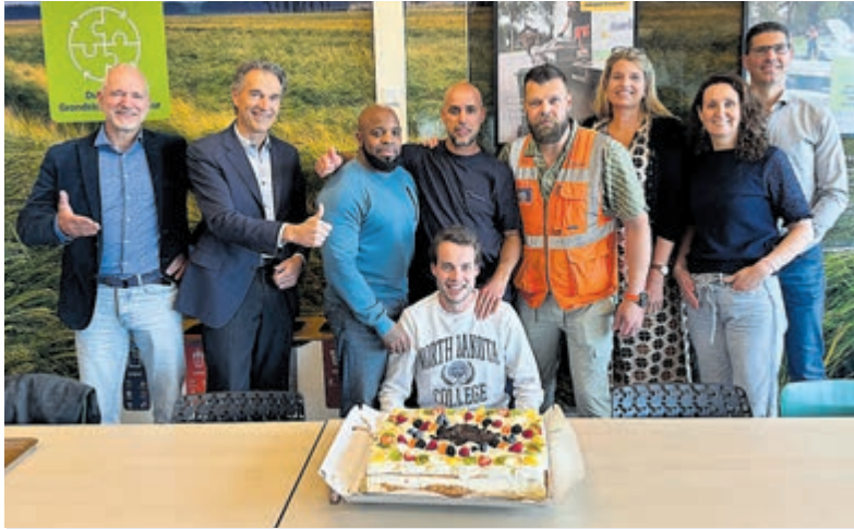
Wethouder Spaargaren trakteert Meerlanden medewerkers op taart als dank voor de snelle inzet voor papierinzameling in Kudelstaart.