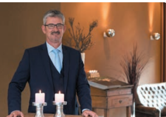
Ton Wollaars Uitvaartverzorgers

In een emotionele periode van afscheid nemen, help ik u bij het organiseren van een mooie uitvaart voor uw dierbare.