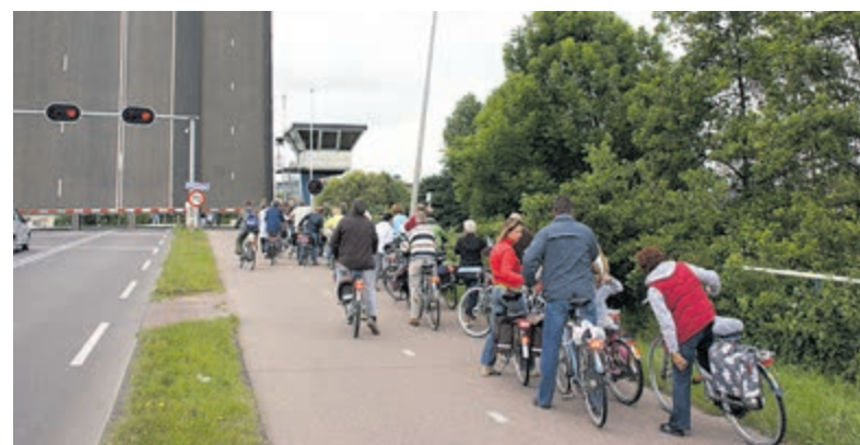
Wachten voor de open Aalsmeerderbrug.

dat zeer. De routebeschrijving voor de 43e fietstocht blijft noodgedwongen weer een jaar op de plank liggen. Toch vraagt de Stichting Dorpentocht om de datum 5 juni 2022 straks in de nieuwe agenda te omcirkelen en wenst iedereen een mooie zomer met toch veel individueel fietsplezier.