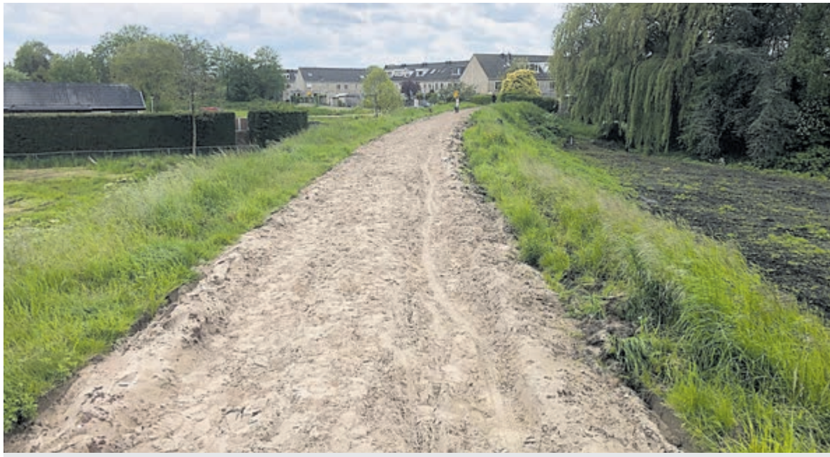
Het Spoorlijnpad, deels opgeheven en al omgetoverd tot zandpad.