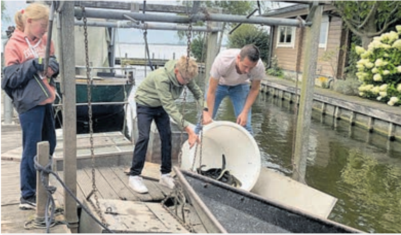
Kennis maken met vakmensen tijdens de Amb8route.