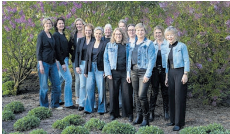
Davanti in het 75-jarige Seringenpark.