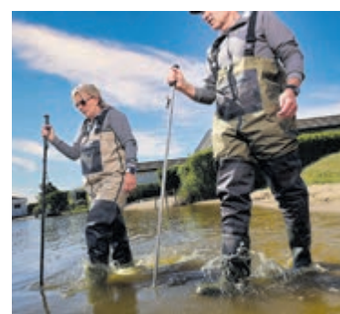
Controle waterkwaliteit bij officiële zwemlocaties.

zwemmen en was sowieso de handen voordat je iets gaat eten. De officiële zwemwaterlocaties zijn te herkennen aan een blauw informatiebord van de provincie Noord-Holland. Zwemmen in oppervlaktewater is altijd op eigen risico. Actuele informatie over de waterkwaliteit en veiligheid staat tijdens het zwemseizoen op zwemwater.nl .