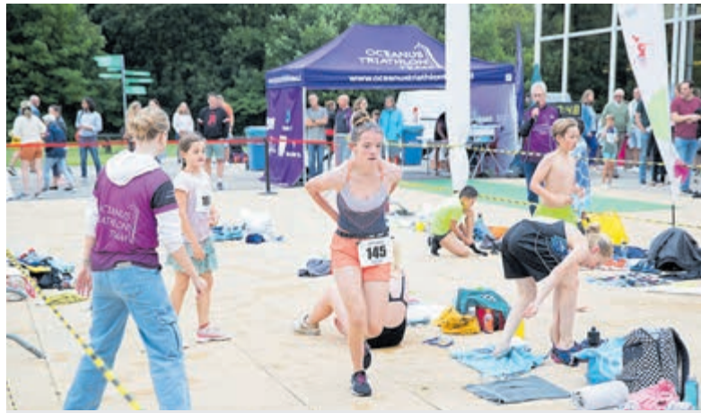
Scholieren Zwemloop Challenge bij Oceanus.