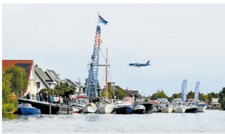
Verzamelen voor de Verhoef Boten Toertocht.

moois van de tafel uitkiezen. Daarna was het tijd voor de lunch. Natuurlijk ontbrak de kroket niet, wat door de gasten altijd erg wordt gewaardeerd. Na de lunch werden de groepen gewisseld, zodat iedereen zowel van de rondleiding als van de bingo kon genieten. Rond twee uur werd er nog een lekker drankje met een hartig hapje geserveerd. Als extra verrassing kreeg iedere gast bij vertrek een mooie plantenschaal met cactusjes of vetplantjes mee naar huis. Voor zowel gasten als vrijwilligers was het een bijzonder geslaagde dag bij Cactuskwekerij Ubink. Stichting SAM kijkt met veel plezier terug op deze middag en gaat alvast op zoek naar een ander bedrijf dat zijn kantine beschikbaar wil stellen voor een nieuwe ontmoeting volgend jaar.