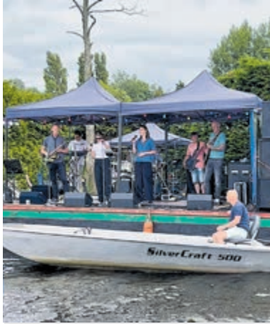
Bands op (voorlopig) zes podia tijdens Plaspop 2026.

Aalsmeer - Over iets meer dan een maandje, zaterdag 20 juni is de nieuw editie van Plaspop, het watertheater op de Westereinderplassen. Vele toppers betreden de verschillende podia om hun kunsten te vertonen. Geluid als nooit tevoren. Live. Geen playback of AI gedoe. Mooie trommels en subtiele snaren. Op (voorlopig) zes podia is vanaf 19.30 uur reuring. Let op! Bij sommige al wat eerder! Daar wordt de voetbalwedstrijd Nederland tegen Zweden al vanaf 19.00 uur vertoont. Stap bijtijds in je bootje en ga oranje verkleed met vlag en wimpel het water op. Een avondvullend programma. Sport en muziek.