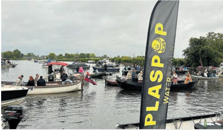
Gezellige drukte tijdens Plaspop.