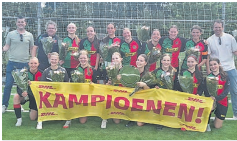
De voetbalsters van MO17-1 van FC Aalsmeer.