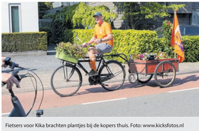
Fietsers voor KiKa brachten plantjes bij de kopers thuis.

gerecycled materiaal. Bovendien produceert Fairphone alleen smartphones waar de arbeidsomstandigheden in de mijnen en fabrieken goed zijn. De werknemers krijgen een eerlijk loon en uiteraard is er geen sprake van kinderarbeid. Voor een Fairphone mobiel betaal je iets meer, maar je koopt wel een eerlijke en duurzame smartphone die langer meegaat dan andere toestellen. Fairphone zet de mens en planeet op de eerste plaats. Meer informatie over Fairtrade is te vinden op www.fairtradegemeenteaalsmeer.nl .