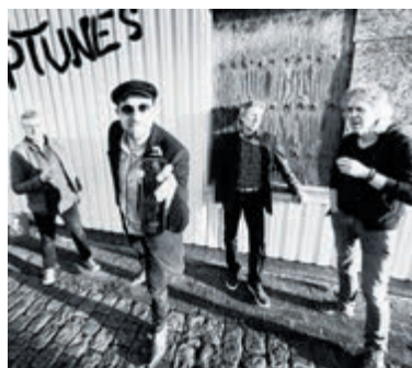
The Claptunes brengen ode aan Eric Clapton in The Shack.