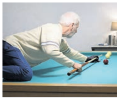
Bandstootwedstrijden bij Biljartvereniging Aalsmeer.

toeschouwer. De wedstrijden zijn op zaterdag 30 mei om 10.00 en 13.00 uur en de grote finale is op zaterdag 6 juni om 13.00 uur. Stap gerust binnen, ontdek de wereld van het biljarten en geniet vrijblijvend van een kop koffie.