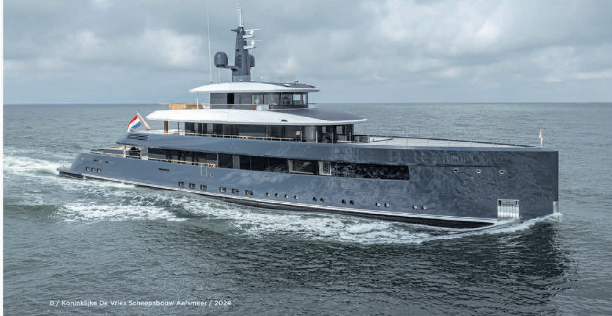
B / Koninklijke De Vries Scheepsbouw Aalsmeer / 2024

Bij Koninklijke De Vries Scheepsbouw in Aalsmeer bouwen we onder de merknaam Feadship superjachten die zich onderscheiden door de kwaliteit van constructie, techniek en afwerking. Ieder jacht is 'custombuilt', volledig naar wens van de eigenaar.