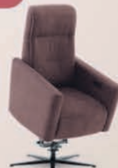
Sta-op stoel Termoli