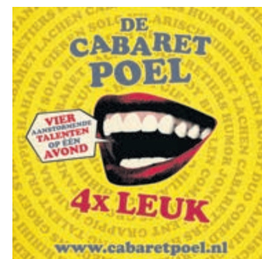
Ontwerp: Matthias Tuns

ziet u vier keer iets nieuws! De voorstelling begint om 20.30 uur, zaal open vanaf 20.00 uur. Kaarten kosten 15 euro per stuk en zijn te bestellen via de ticketshop op de website van KCA. Deze verrassende voorstelling is de laatste van dit seizoen. Na afloop wordt het programma van het komende seizoen bekend gemaakt, waarin weer veel mooie optredens te verwachten zijn.