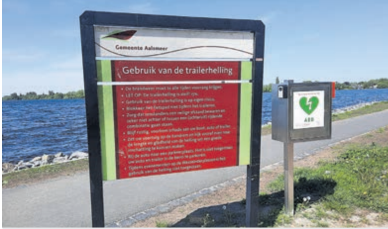
De AED-kast naast het bord bij de brandweersteiger aan de Stommeerweg.