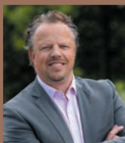
Alexander van der Pijl Dunweg Uitvaartzorg