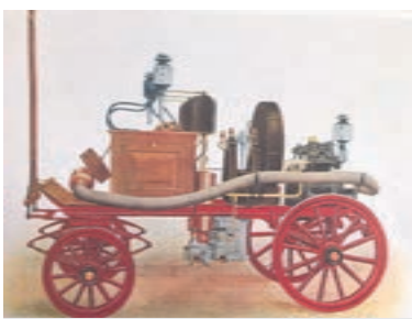
De eerste mobiele motorbrandspuit, aangeschaft door Aalsmeer op 16 mei 1922.