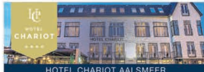
HOTEL CHARIOT AALSMEER

Te koop: Grijs/antraciet laminaat ongeveer 25m² met ondervloer €25,- voor meer info. Tel. 06-23667995