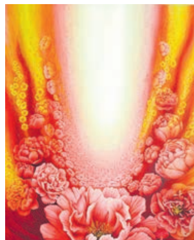
Schilderij Lida Sherafatmand, Reception.

Museum is gevestigd aan Kudelstaartseweg 1 (tegenover de watertoren). Kijk voor meer informatie op: www.flowerartmuseum.nl