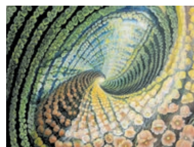
Schilderij Lida Sherafatmand, Affinity.