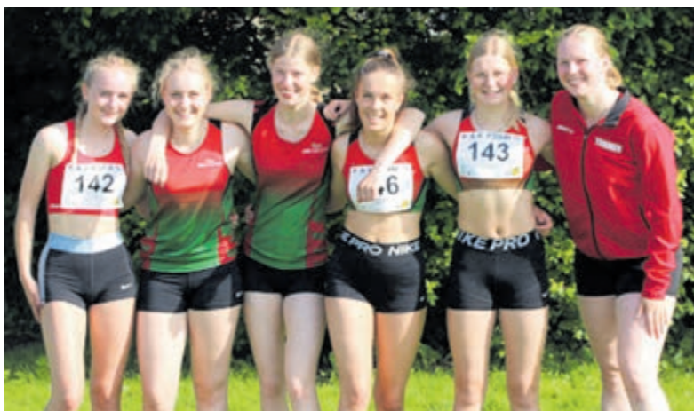
Teamfoto AV Aalsmeer.

Aalsmeer - Twee winnaars waren er afgelopen vrijdag tijdens de kaartavond van BV Hornmeer, allebei met een punten totaal van 5379. Dus moest er geloot worden. Uiteindelijk kreeg Maaïke Spaargaren de hoogste eer en kreeg Siem Burgers plaats twee toebedeeld. Op drie met 5280 punten Plony de Langen. De poedelprijs was voor Theo Nagtegaal met 3786 punten. Komende vrijdag 20 mei is er weer klaverjassen. Iedereen is van harte welkom in buurthuis Hornmeer aan de Dreef 1. De zaal is open vanaf 19.00 uur, aanvang kaarten 19.30 uur.