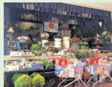
Za. 13 mei: Veiling Kudelstaart in dorps-huis 't Podium vanaf 20u.