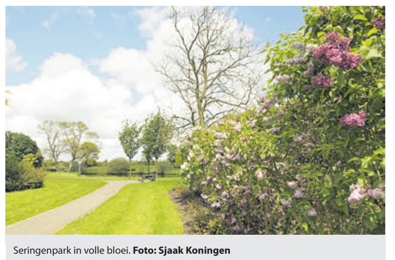
Seringenpark in volle bloei.