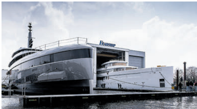
De werf van Koninklijke De Vries Scheepsbouw met bouwnummer 710 (links) en de aankomst in hal 1 van bouwnummer 713 (rechts).