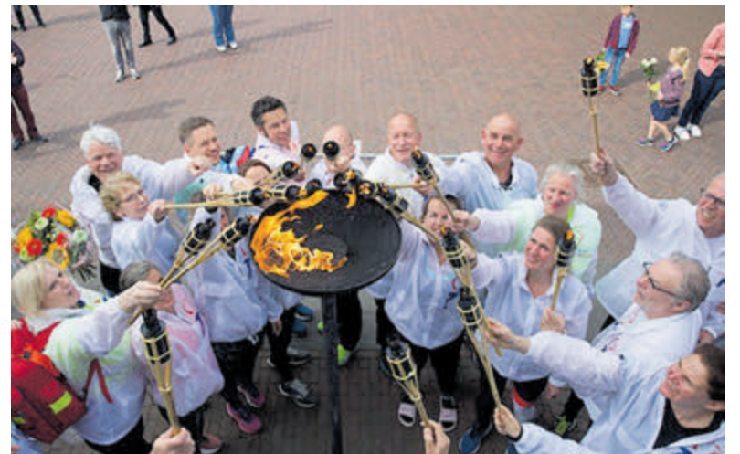
Na de aankomst in Aalsmeer werd gezamenlijk het vrijheidsvuur ontstoken.

Nog nooit was er oorlogsgeweld in mijn huis van dromen, dat gebeurt bij de anderen ver weg, zou je denken. Gruwelen van bloed, uiteengescheurde families waar geen woorden voor zijn, duren vaak maar één journaal, en soms één foto lang, met een bevroren verhaal, over dat wat baren, leven geven was gesmoord in een bommentapijt van bovenaf. Zo stierven moeder en kind, zo is het verhaal, zo verdween de allertzachtste vrede en zijn woede en haat de raadgevers van vandaag. Ook al is de oorlog hier al lang gedaan, klopt hij elke dag wel even aan mijn raam sluipenderwijs dichterbij gekomen door de mazen van de tijd en de dromen door keuzes die niet altijd uit te leggen zijn, er is geen antwoord. Wij, 300.000 jaar mens, complex, teer en kwetsbaar als alle natuur, opeenvolgende generaties, die het grote wiel van de geschiedenis inkleuren en laten draaien met bezwerende verhalen over moed, zwakheid en het zwijgen over wat goed en wat fout in een oorlog die zich herhaalt, en herhaalt en maar herhaalt.