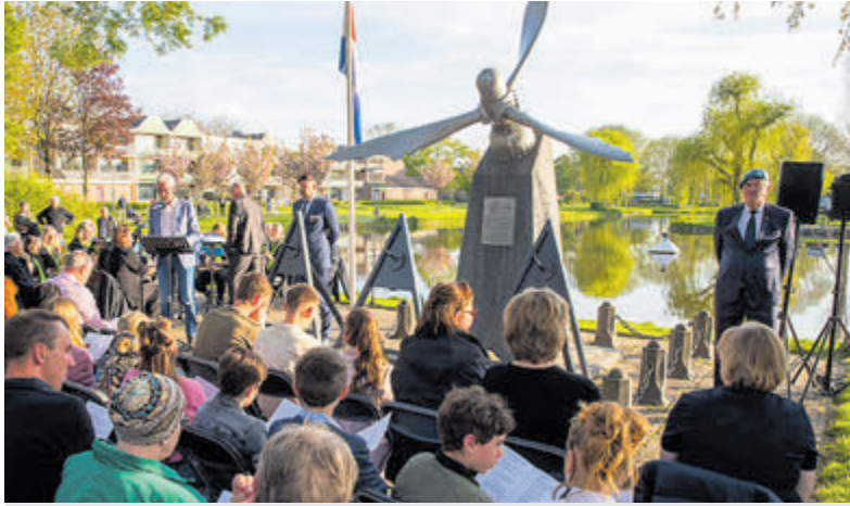
Dodenherdenking in Kudelstaart.