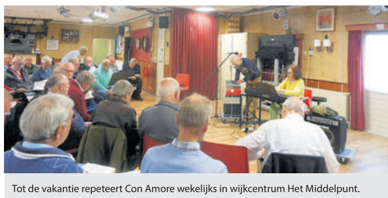
Tot de vakantie repeteert Con Amore wekelijks in wijkcentrum Het Middelpunt.