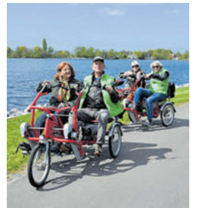
Gezellig en sportief: SAMen fietsen met stichting SAM.

ideeën maar kan die alleen waar- maken als er meer vrijwilligers gevonden worden. Gezocht wordt naar een secretaris en een PR-communicatie vrijwilliger. Kom langs bij Stichting SAM om kennis te maken en word zelf ook vrijwilliger. Voor meer informatie: www.stichtingsam.eu