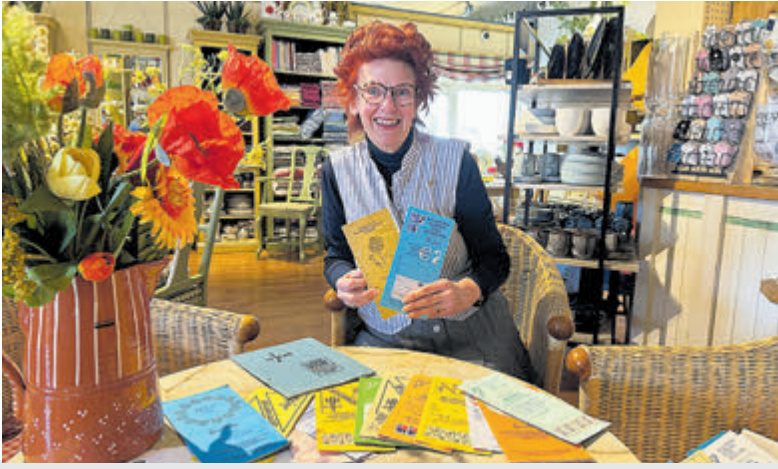
'Vraag om Bloemenzegels, u heeft er recht op' was en is al jaren het devies.