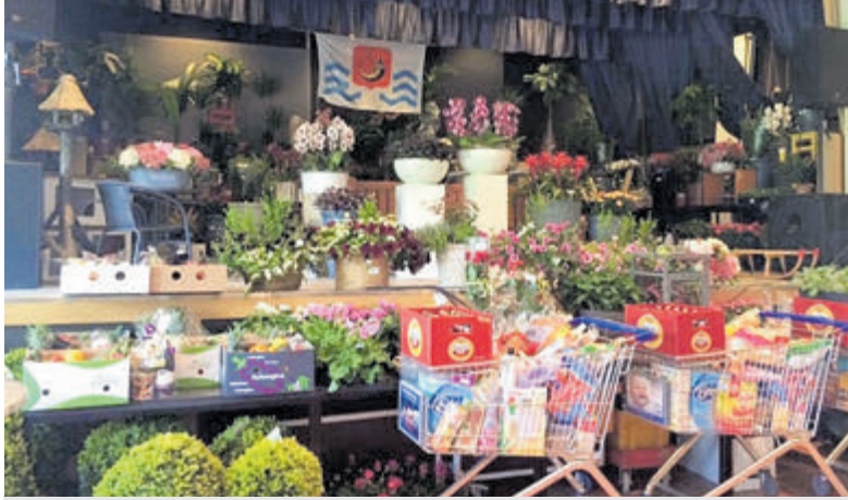
Een podium met veel kavels voor de veiling Kudelstaart voor Kudelstaart.