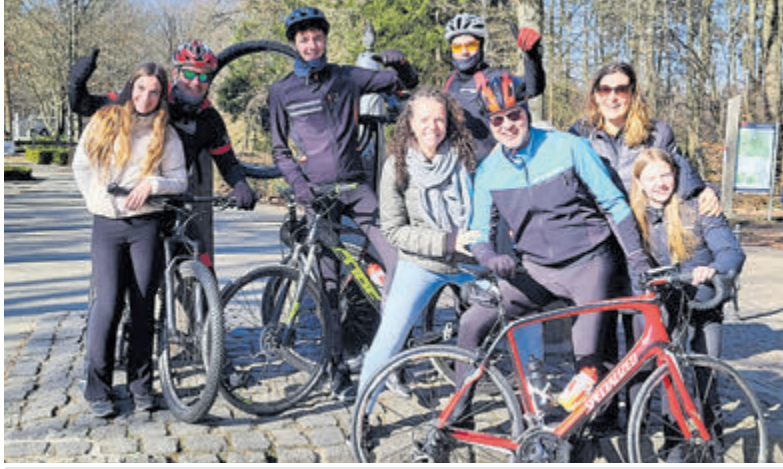
Team Alp d'huFriends aan het trainen in Limburg