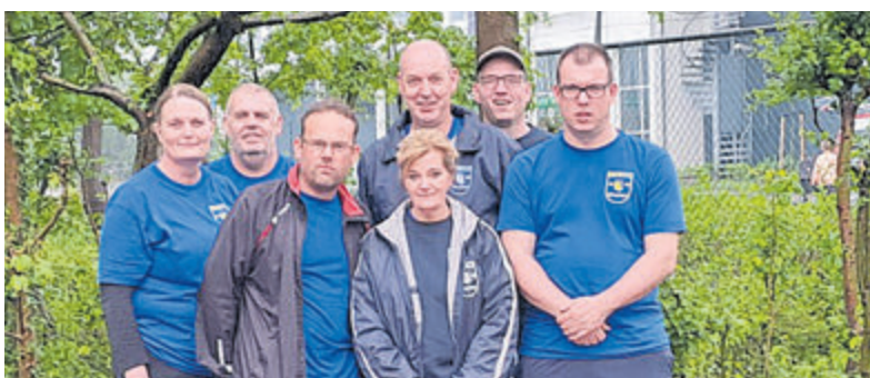
De winnaars van de landelijke wedstrijd in de Hoofdklasse. Team Oirschot.

Ook een keer (recreatief) een rondje midgetgolf spelen? De baan aan de Beethovenlaan is open op woensdag, zaterdag en zondag van 13.00 tot 17.00 uur. Kijk op de facebookpagina van Midgetgolfclub Aalsmeer of de website voor eventueel gewijzigde openingstijden.