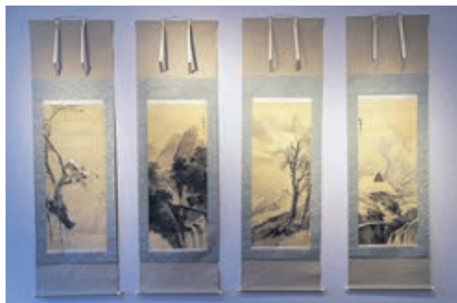
Tentoonstelling 'Japan' in het Oude Raadhuis.